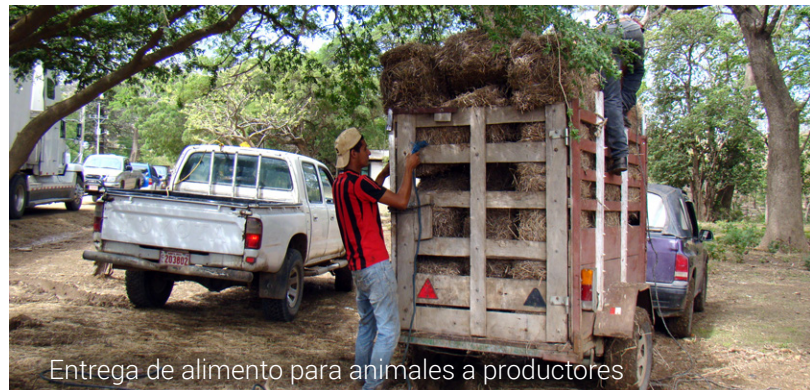
Entrega de alimento para animales a productores

Fondos convertidos en obras La Junta Directiva de la CNE aprobó planes de inversión por más de ₡9000 millones. Esta cifra significa más del 75% por ciento de los ₡15 500 millones de ejecución en menos de seis meses, de los cuales ₡12 000 millones han venido siendo aportados con recursos del Fondo Nacional de Emergencias y el resto, unos ₡3500 millones, con recursos ordinarios de las instituciones que participan en las acciones de respuesta.