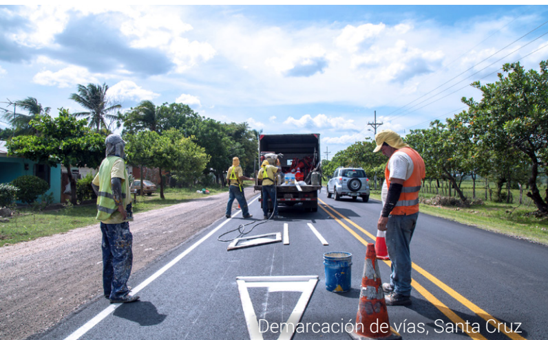
Demarcación de vías, Santa Cruz

El Ministerio de Obras Públicas y Transportes (MOPT) y el Consejo Nacional de Vialidad (Conavi) invierten en Guanacaste, durante 2015, más de ₡28.000 millones en rutas de asfalto y lastre. Aún hay problemas pendientes de solución, pero el Gobierno trabaja en diseños, procesos de adjudicación y contratación para atender el rezago de la obra vial en la provincia. Estos son algunos ejemplos: