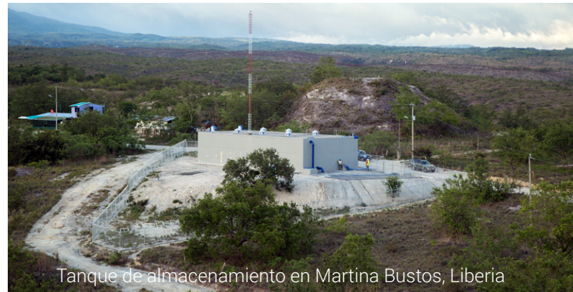
Tanque de almacenamiento en Martina Bustos, Liberia