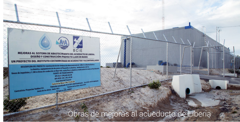
Obras de mejoras al acueducto de Liberia

Agua para Santa Cruz En 2015 estará terminada la construcción del acueducto en el asentamiento Inés Amador, en Santa Bárbara de Santa Cruz, que beneficia a unas 3000 personas y cuesta ₡341 millones.