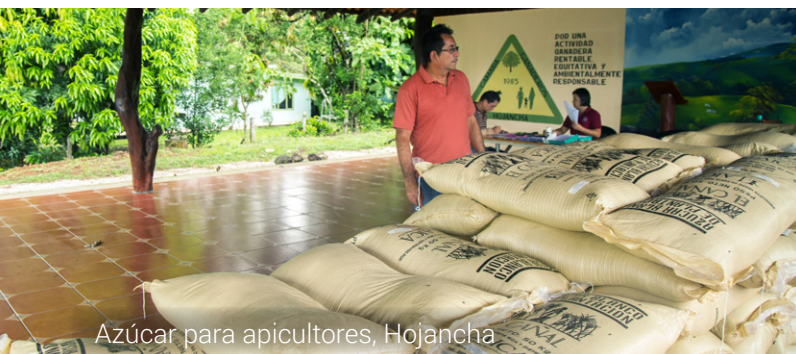
Azúcar para apicultores, Hojancha

El Ministerio de Agricultura y Ganadería (MAG) ha apoyado a los productores con acciones de mitigación frente a la emergencia causada por la sequía; pero también desarrolla proyectos de mediano y largo plazo para impulsar el crecimiento económico de la provincia.