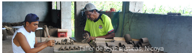
Taller de tejas rústicas, Nicoya

En Guanacaste el desempleo afecta al 13,9% de la población, es una prioridad la creación de más y mejores empleos y la capacitación de sus habitantes.