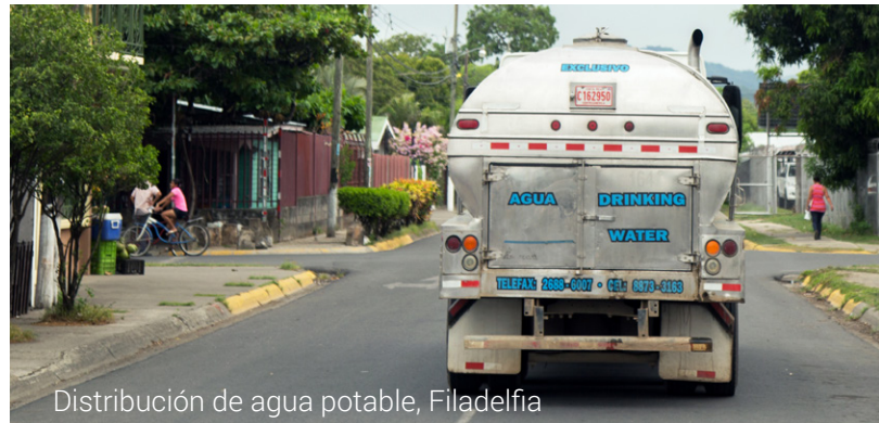
Distribución de agua potable, Filadelfia