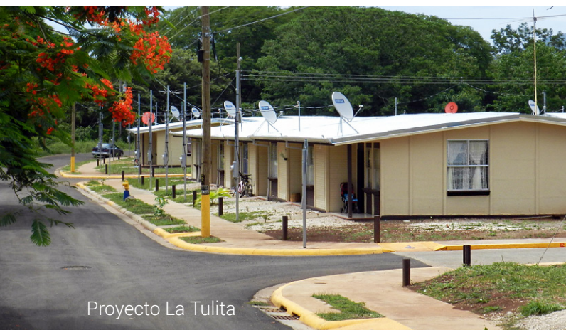
Proyecto La Tulita

Favorecer el acceso a vivienda digna es clave para que las familias mejoren su calidad de vida. En Liberia y Santa Cruz ya han sido finalizados dos proyectos para poblaciones en pobreza y con alta participación de mujeres jefas de hogar.