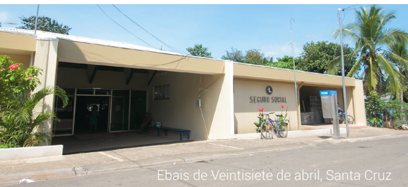
Ebais de Veintisiete de abril, Santa Cruz

Costa Rica aspira tener una población más longeva y saludable y para ello es indispensable que todos los y las aseguradas tengan acceso a servicios médicos con instalaciones óptimas. En este esfuerzo la Caja Costarricense del Seguro Social invertirá en la provincia de Guanacaste ₡43 000 millones entre 2015 y 2019.