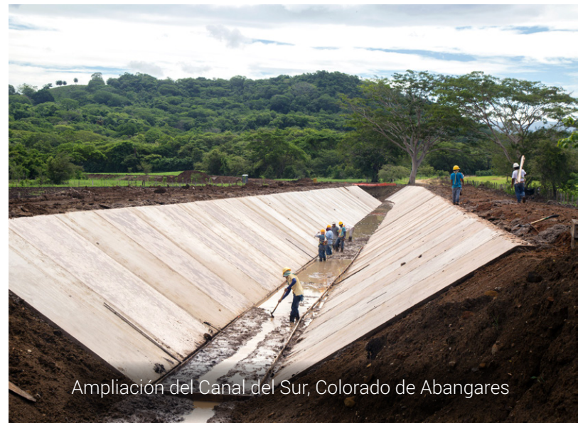
Ampliación del Canal del Sur, Colorado de Abangares

Más agua para la producción en Cañas y Abangares El Servicio Nacional de Aguas Subterráneas, Riego y Avenamiento (Senara) construye una ampliación de 33 kilómetros del Canal del Sur, para irrigar 8800 hectáreas, entre el río Cañas y la quebrada Piñuela en Colorado de Abangares. El canal puede transportar hasta 15 000 litros de agua por segundo. El proyecto cuesta $13 millones y beneficia a más de 200 productores y productoras de arroz, pasto, tilapias, mango, papaya, melón y sandía. La obra se encuentra en un 65 % de avance y funcionará en el primer trimestre de 2016.