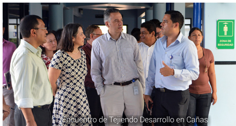
Encuentro de Tejiendo Desarrollo en Cañas

El desarrollo es organización y Tejiendo Desarrollo articula el trabajo de las instituciones del Estado, las empresas y las personas en Guanacaste para crear prosperidad y bienestar donde la región más la necesita.