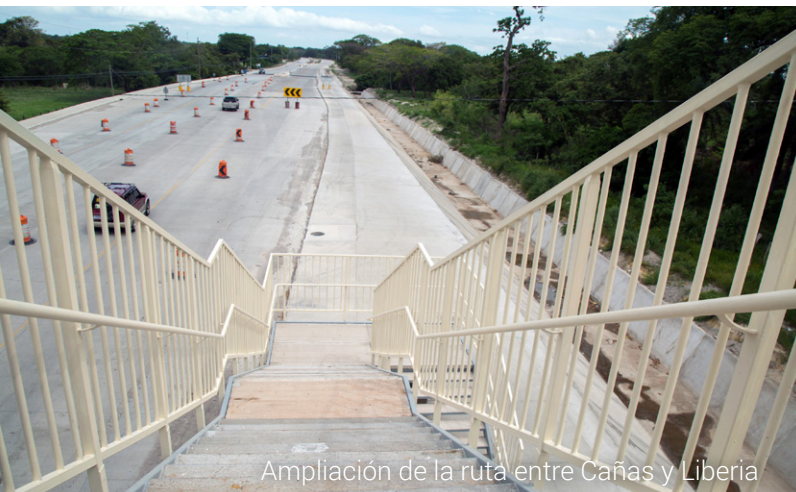
Ampliación de la ruta entre Cañas y Liberia