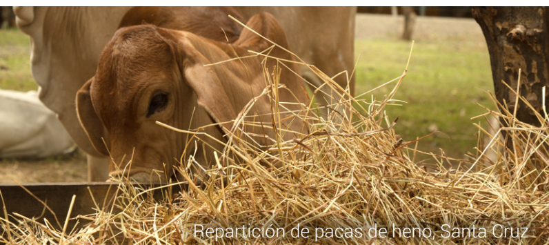
Repartición de pacas de heno, Santa Cruz