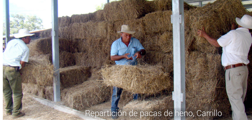
Repartición de pacas de heno, Carrillo

Enlace interinstitucional Las tareas de la CNE articularon aportes de las entidades de los sectores agrícola, ambiental, hídrico, salud, educativo, obras públicas y asistencia social. Solo como un ejemplo de esa coordinación, el IMAS destinó más de ₡800 millones en subsidios a pescadores y ₡330 millones para productores. También ha sido activado el Sistema de Banca para el Desarrollo, para lo cual se destinaron más de ₡5000 millones para financiar proyectos a productores que enfrentan la sequía.