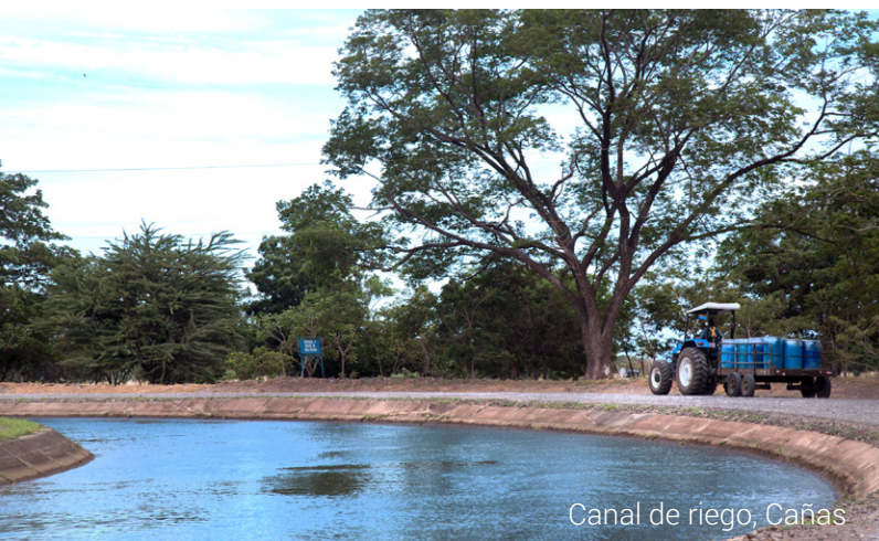
Canal de riego, Cañas

El Gobierno atiende con visión estratégica el problema del agua en Guanacaste para asegurar el aprovechamiento óptimo del recurso hídrico en la Vertiente Pacífico Norte, satisfacer las demandas de agua de las comunidades e impulsar las actividades productivas, así como el mejoramiento del acceso al agua en cantidad y calidad adecuada.