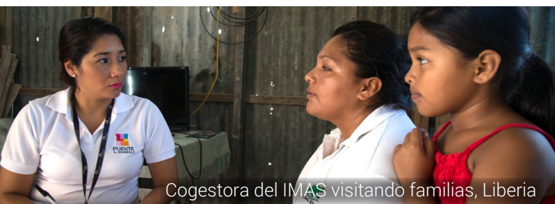
Cogestora del IMAS visitando familias, Liberia

ESTRATEGIA NACIONAL PARA LA REDUCCIÓN DE LA POBREZA