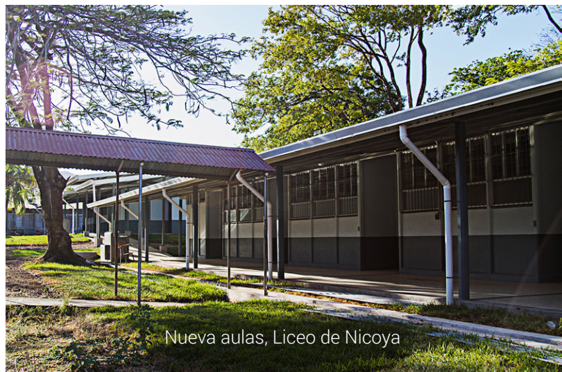
Nueva aulas, Liceo de Nicoya

Renovación de escuelas y colegios De mayo del 2014 a julio del 2015, el MEP ha invertido más de ₡6000 millones en infraestructura educativa. En el último año, la Dirección de Infraestructura y Equipamiento Educativo DIEE, del MEP, construyó nuevas edificaciones en 40 centros educativos de Guanacaste. En unos casos fueron nuevas aulas, comedores estudiantiles, bodegas o laboratorios de cómputo; en otros casos, una construcción completa debido al terremoto.