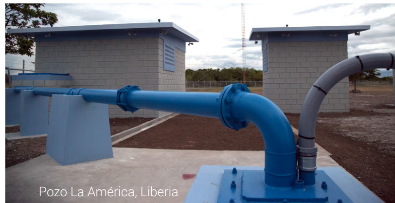
Pozo La América, Liberia

Tratamiento del arsénico Desde marzo de 2015 están funcionando las plantas de tratamiento de arsénico en Bebedero de Cañas, Falconiana y Montenegro de Bagaces. La planta de Quintas Don Miguel está pendiente de instalarse. Estos proyectos tienen un valor superior a los ₡2400 millones.