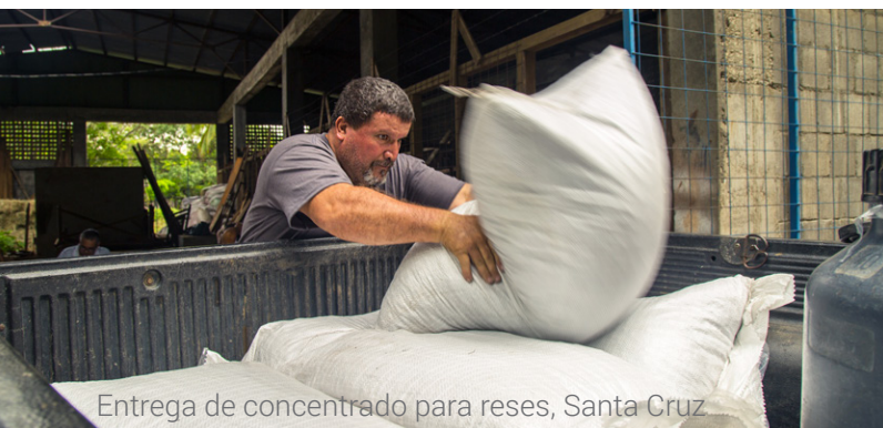
Entrega de concentrado para reses, Santa Cruz