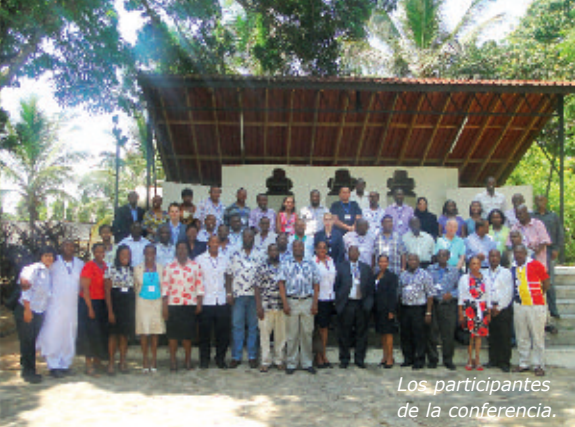
Los participantes de la conferencia.