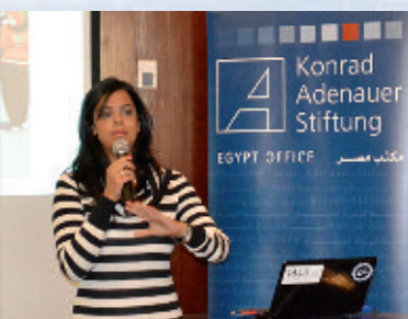
Una activista egipcia explica estrategias de la articulación política en la red.

Una página de facebook inició un movimiento de protesta en Egipto que tuvo su punto culminante preliminar el 11 de febrero de 2011 con la renuncia del presidente de Estado Hosni Mubarak. Ya en diciembre la oficina de representación en Egipto de la KAS había invitado a jóvenes activistas de internet para un intercambio de experien-