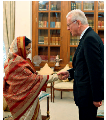
El eurodiputado Dr. Hans-Gert Pöttering conversando con la presidenta de Estado de la República de India Pratibha Patil.

Adicionalmente el presidente de la KAS se reunió con la presidenta india de Estado, Pratibha Patil, la presidenta del parlamento indio (Speaker of the Lok Sabha), la Dra. Meira Kumar, el ministro de estado de Defensa, Pallam Raju, y con Shiv Shankar Menon, asesor nacional de seguridad (National Security Advisor) del gobierno indio.