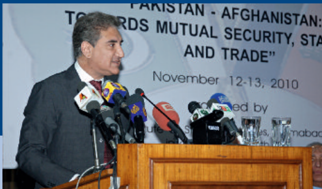
El ministro pakistaní de Relaciones Exteriores Shah Mahmood Qureshi en su discurso inaugural de la conferencia bilateral.