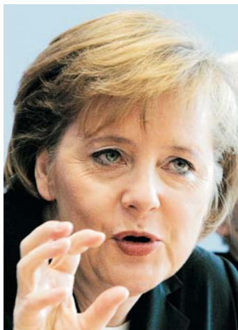
Dr. Angela Merkel, Primera Ministra de la República Federal de Alemania visitará Colombia los días 17 y 18 de mayo.

En este momento, Colombia es el país que más necesita el ADA, porque las tensiones entre Colombia y Venezuela ponen en peligro las exportaciones a dicho país, y por lo tanto una gran cantidad de empleos.