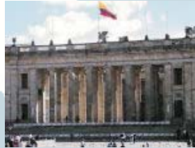
Edificio del Capitolio Nacional

En el marco de este proceso, La KAS asumirá el papel de asesor político y se ha encargado de la coordinación de un grupo de trabajo a solicitud del Gobierno y del Congreso, donde los políticos y científicos darán recomendaciones para la modificación del Reglamento Interno del Congreso.