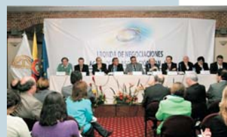
Primera ronda de negociaciones

En abril de 2008 se realizará la tercera ronda de negociaciones en Quito. Las primeras dos rondas tuvieron lugar en Bogotá, el 21 de septiembre de 2007 y en Bruselas del 10 al 14 de diciembre de 2007. Los obstáculos más grandes en este momento son la falta de posiciones comunes de la CAN (Bolivia no está dispuesta a negociar con la UE en materia de inversiones extranjeras, propiedad industrial y servicios, a la par que Colombia no acepta excepciones) mientras que la Unión Europea actúa en bloque.