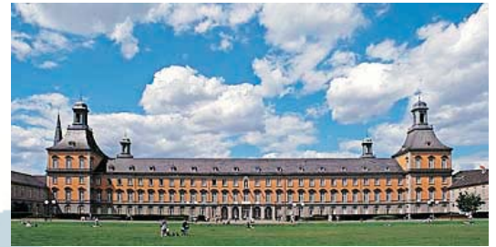
Edificio principal de la Universidad de Bonn, Alemania

constitucional, también el derecho económico internacional, el derecho comunitario de la UE y el derecho público comparativo.