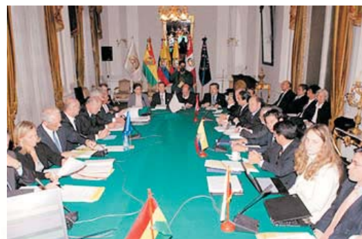
Segunda ronda de negociaciones entre la CAN y la UE realizada entre el 10 y 14 de diciembre de 2007 en Bruselas, Bélgica

El tercer pilar pretende aumentar y enmendar el comercio entre ambas regiones. Para los países de la Comunidad Andina se abrirá un mercado de casi 500 millones de habitantes de manera permanente y firme. Para ello el 17 de julio de 2007 se acordó crear 14 subgrupos, teniendo un grupo para cada tema de negociación: Acceso a mercados, asimetrías y tratamiento especial y diferenciado, reglas de origen y asuntos aduaneros, entre otros temas.