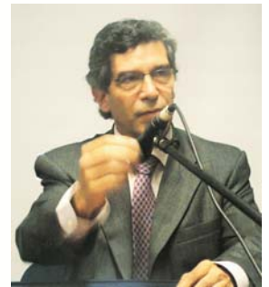
Dr. Rafael Pardo

El Ex Ministro Rafael Pardo (1991-94) se mostró escéptico: las manos de tantos cocineros podrían terminar por estropear el ponqué. La cacofonía diplomática del pasado, en la cual todos negociaban con cada uno, habría llevado más bien al caos. En el ámbito