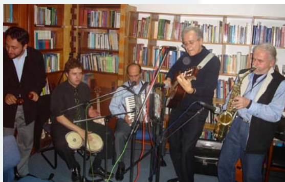
Los músicos amenizaron la inauguración