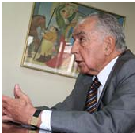
Ex senador Enrique Gómez Hurtado

De igual manera, le inquieta que desde Venezuela esté saliendo una importante cantidad de drogas hacia Europa y África procedente de Colombia y que los laboratorios de procesamiento de coca de los grupos guerrilleros colombianos se estén trasladando a la frontera con Venezuela, a lo que en su concepto obedecería que en los últimos meses en Colombia no se hayan vuelto a dismantelar este tipo de laboratorios.