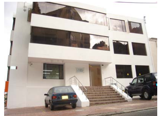
Nueva sede en el barrio El Nogal.

Desde nuestras nuevas instalaciones, mucho más bonitas y amplias, no solo estaremos atendiendo a nuestros amigos y socios, sino también, podremos realizar foros en una sala de reuniones y seminarios y ofrecer a nuestros visitantes un agradable espacio de consulta y lectura en nuestra biblioteca.