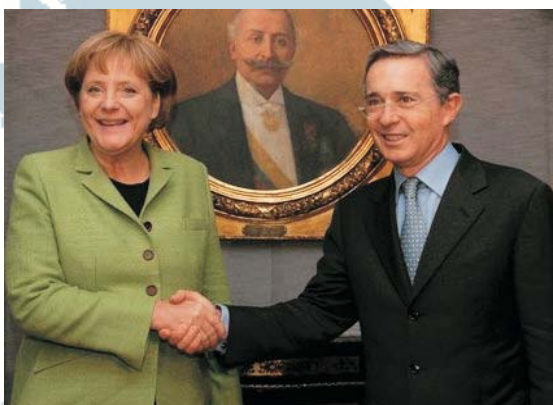
Tanto la Canciller Merkel como el Presidente Uribe reiteraron las buenas relaciones entre Alemania y Colombia.

La Política de Seguridad Democrática de Álvaro Uribe brindó confianza en el sector privado, lo cual no sólo beneficia a compañías multinacionales, sino también a pequeñas empresas del país. Este desarrollo está estrechamente ligado a la intensidad del conflicto. La seguridad y la confianza tienen en Colombia dividendos sociales. Cuando le va bien a la economía del país, hay acceso, al lado del necesario componente militar, a recursos para proyectos sociales y tareas de reintegración para los más de 40.000 combatientes desmovilizados. Los colombianos, quienes no sólo padecen bajo un conflicto vitalicio, sino que viven en una vecindad cada vez más turbulenta, han sabido apreciar el apoyo de Alemania en tiempos difíciles. Ahora reposa en ambas partes tomar los hilos que la Canciller alemana dejó en su visita a Bogotá y no dejar amainar la nueva dinámica de las relaciones bilaterales.