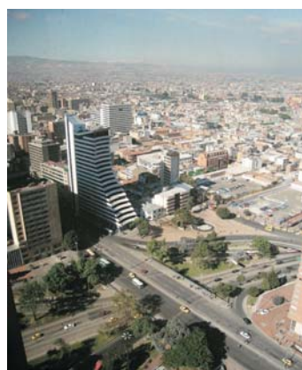
El éxito de las políticas de descentralización en Alemania y Colombia será uno de los temas de la agenda de los alcaldes.

En la imagen, panorámica de Bogotá, capital de Colombia.