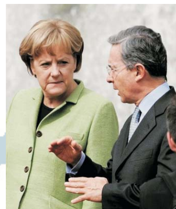
Durante su visita a Colombia, la Canciller de Alemania Angela Merkel, destacó los logros de la política de seguridad democrática de Uribe; al mismo tiempo resaltó la importancia de reparar a las víctimas del conflicto.

El gobierno colombiano reaccionó con alegría ante un segundo punto. Después de que Colombia estuvo a comienzos de marzo cerca de una guerra con Ecuador y Venezuela, debido a que el ejército colombiano mató al número dos de las FARC, Raul Reyes , dos kilómetros dentro de la frontera ecuatoriana; la Canciller no dejó duda de cuál es la parte a la cual le atribuye la obligación de aportar: "es importante que los vecinos tomen parte en la guerra contra el terrorismo", subrayó ella en Bogotá.