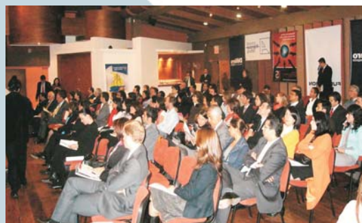
Los asistentes al lanzamiento del premio conocieron en detalle las condiciones de participación y postulación de experiencias. Fue a la vez un escenario de intercambio con otros empresarios.

La premiación está prevista para el mes de octubre de 2008, en ocasión de la feria internacional ExpoAlemania 2008 en Bogotá, espacio al que confluirán empresas nacionales e internacionales, generando así mayor visibilización de los ganadores del premio.