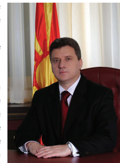
Gjorge Ivanov, Presidenti i katërt i RM-së (2009-2014)

Rrethi i dytë i zgjedhjeve u mbajt më 5 prill të vitit 2009. Gjorge Ivanov fitoi 63,14%, përkatësisht 453.616 nga numri i përgjithshëm i fletëvotimeve të vlefshme, ndërsa kandidati për president Lubomir Danaillov Fërçkovski garën zgjedhore e përfundoi duke fituar 36,86% nga numri i përgjithshëm