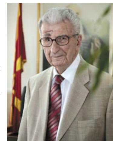
Kiro Gligorov, Presidenti i parë i RM-së (1991-1999)