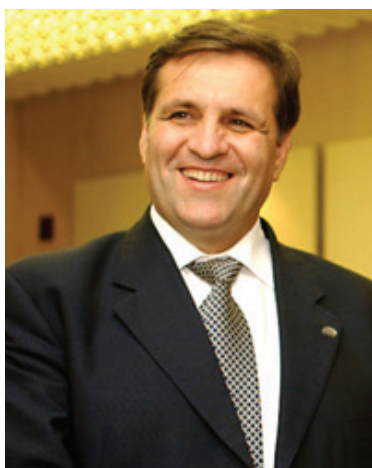
Boris Trajkovski, Presidenti i dytë i RM-së (1999-2004)

Listën e Zgjedhësve. 23 Njëra nga specifikat e këtyre zgjedhjeve ishte se, Komisioni Shtetëror i Zgjedhjeve anuloi një numër të madh të fletëvotimeve –130.810 vota u shpallën si të pavlefshme (12,41% e fletëvotimeve). Për shkak të zhvillimit të këtyre të ngjarjeve, partia Organizata e Brendshme Revolucionare Maqedonase – Partia Demokratike e për Unitet Kombëtar Maqedonas (VMRO-DPMNE), e cila e propozoi Lubisha Georgievskin për president, paraqiti kundërshtim pranë Komisionit Shtetëror të Zgjedhjeve (KSHZ), me kërkesë që zgjedhjet të anulohen. Kundërshtimi u refuzua dhe kështu Kiro Gligorov u bë Presidenti i parë i Republikës së Maqedonisë i zgjedhur në zgjedhje të përgjithshme dhe të drejtpërdrejta. Kiro Gligorov e ushtroi funksionin shëf i shtetit deri më 19 nëntor të vitit 1999. 24