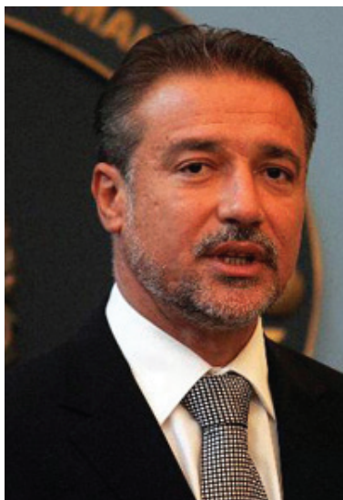
Branko Cërvenkovski, Presidenti i tretë i RM-së (2004-2009)