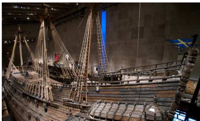
Die Vasa

Wir beginnen den heutigen Tag mit einem Besuch im Vasa-Museum.