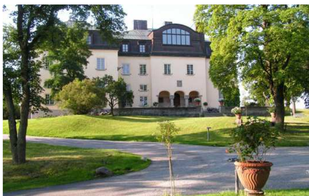
Prins Eugens Waldemarsudde

Die Vasa sollte das größte Kriegsschiff seiner Zeit werden, sank jedoch 1628 vor Stockholm noch auf seiner Jungfernfahrt. So wurde das Schiff mitsamt mehreren Dutzend Ertrunkenen ein Opfer des Größenwahns von Gustav II. Adolf, König von Schweden. Nach 333 Jahre am Meeresboden wurde das imposante Kriegsschiff geborgen, woraufhin es eine neue Reise antrat. Heute ist die Vasa das am Besten erhaltene Schiff des 17. Jahrhunderts und in einem eigens dafür errichteten Museum zu bewundern. Dieser einzigartige Kulturschatz umfasst 98 Prozent der Originalteile, darunter Hunderte kunstvoll geschnittener Holzskulpturen.