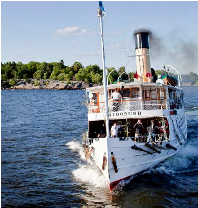
Mit dem Dampfschiff unterwegs

Den heutigen Tag widmen wir einem weiteren herausragenden Kunstmuseum: dem Artipelag, mitten im Schärengarten von Stockholm in grandioser Natur gelegen.