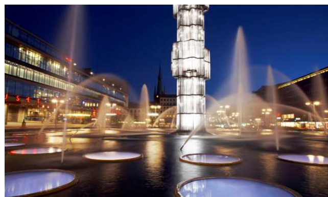
Der Sergelstorg (Platz)

Nach einem Mittagsimbiss im Hotel treffen Sie Ihren Guide für die rund 4-stündige Stadtführung mit architektonischem