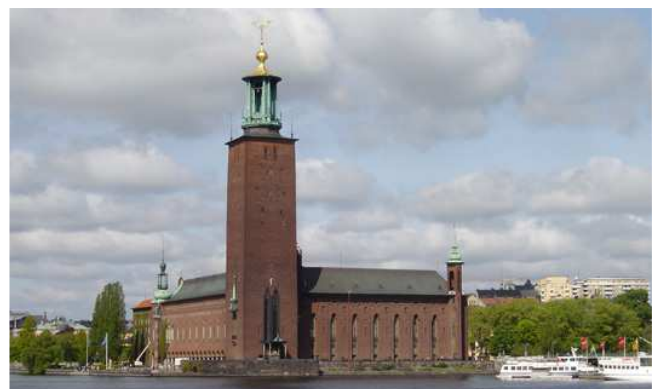
Backsteinfassade des Stadshus

Zum Abschluss der Reise besuchen wir eines der berühmtesten Gebäude Stockholms: das Stadshus (Rathaus). Das 1923 eröffnete Gebäude wurde vom Architekten Ragnar Östberg im Stil der Nationalromantik entworfen und aus acht Millionen Ziegelsteinen erbaut.