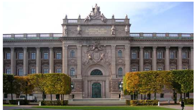
Das Reichstagsgebäude

Unseren letzten Tag in Stockholm beginnen wir mit dem Besuch des Reichstags. Kaum ein Bauwerk in Stockholm ist so leidenschaftlich diskutiert worden wie das Reichstagsgebäude: zu monströs, unzeitgemäß, zu lange Bauzeit und zu teuer. Während der Führung erfahren Sie etwas über die Arbeit des Riksdag und die Aufgaben der Mitglieder, über das, was heute hier geschieht und über die Geschichte des Gebäudes.