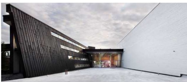
Eingang des Artipelag

Schon die Anfahrt mit dem Schiff durch die Inselwelt Stockholms ist ein besonderes Erlebnis. Das Artipelag – mehr ein Kulturzentrum als „nur“ ein Kunstmuseum – überzeugt durch eine in die Landschaft eingebettete Architektur und hervorragende Ausstellungen. Während einer Führung lernen Sie beides kennen.