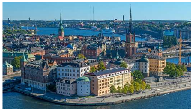
Gamla Stan

Nach dem Frühstück starten wir dem örtlichen Büro der Konrad-Adenauer-Stiftung einen Besuch ab. Hier treffen wir nach Möglichkeit einen Vertreter/eine Vertreterin aus der Politik und erhalten im Gespräch interessante Einblicke in die Landespolitik und aktuell diskutierte gesellschaftspolitische Themen.