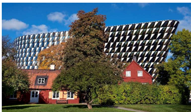
Das Karolinska Institutet

Am Vormittag Ankunft mit dem Flugzeug in Stockholm (alternativ auch Bahnreise am Vortag möglich) und Transfer zum Hotel.