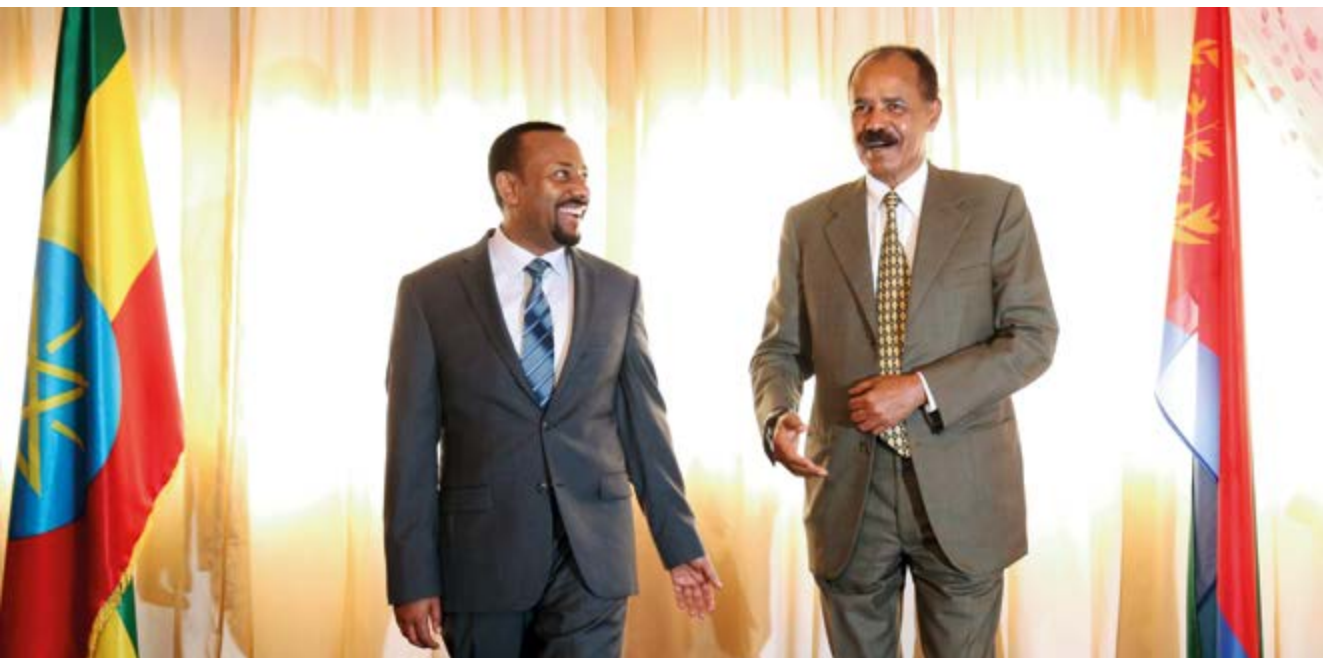
Den Weg der Reformen weitergehen: Durch seine Schritte in Richtung Demokratie und den Frieden mit dem Nachbarn Eritrea hat der äthiopische Ministerpräsident Abiy Ahmed (links) bei europäischen Politikern Hoffnungen geweckt.

Obwohl Äthiopien zuletzt große außenpolitische Aufmerksamkeit zuteilwurde, sollte nicht in Vergessenheit geraten, dass die bisherigen Erfolge bei der Demokratisierung trotz zahlreicher Entwicklungshilfen seitens der EU in den vergangenen Jahrzehnten unzureichend geblieben sind. Die jährlichen Auszahlungen der EU+-Gruppe 34 von einer Milliarde Euro machten fast ein Viertel der Gesamthilfen für Äthiopien und zwischenzeitlich bis zu zehn Prozent des gesamten