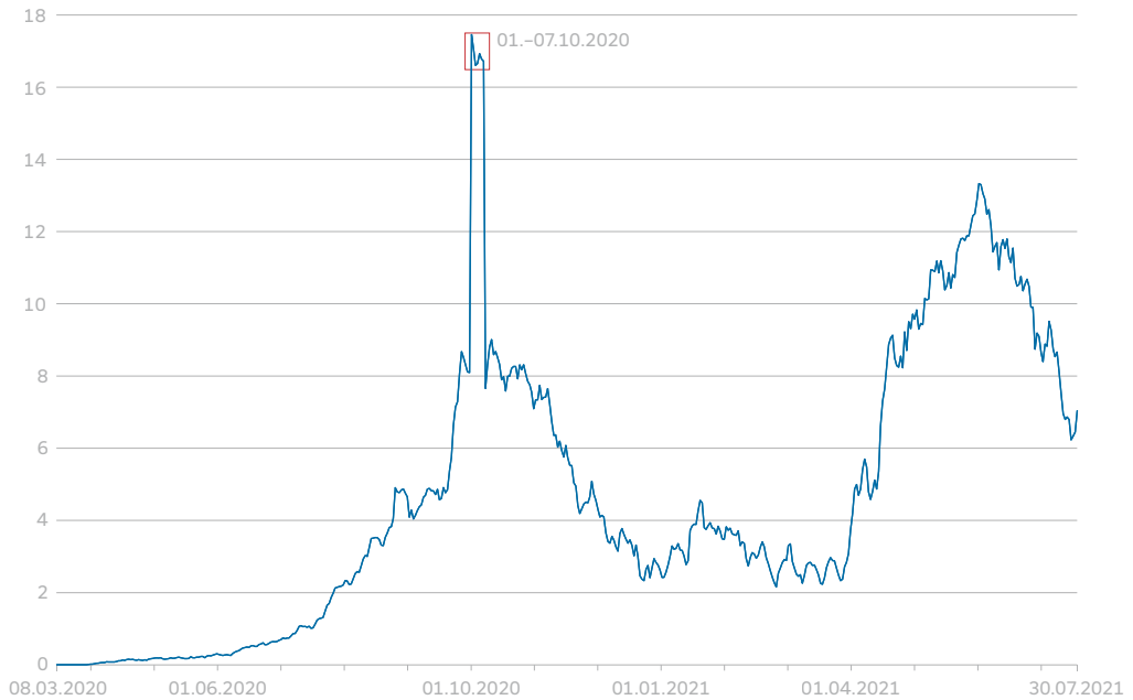
Abb. 2: COVID-19-Todesfälle in Argentinien (pro Million Einwohner)