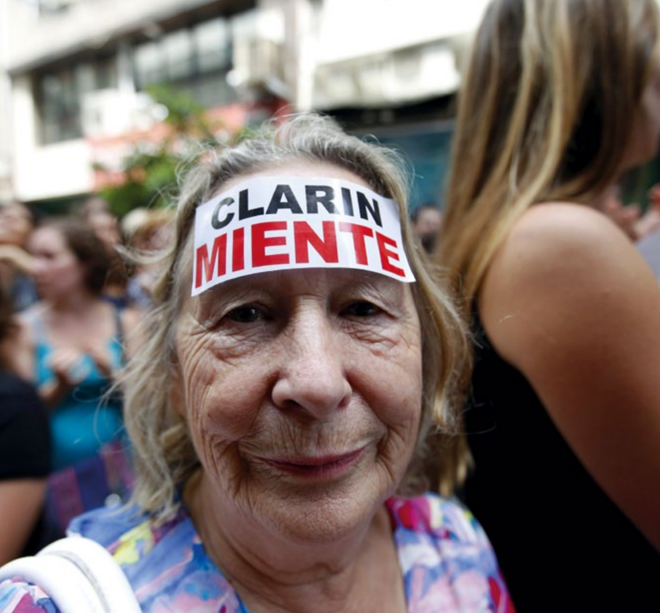
Polarisierte Medien – polarisierte Gesellschaft: Eine Demonstrantin wendet sich in Buenos Aires mit der Parole „Clarín lügt“ gegen die meistgelesene Tageszeitung des Landes.

beziehen, wie beispielsweise Transparenz der Eigentumsverhältnisse, Finanzierung, Umgang mit Kommentaren und Richtigstellungen. Dieses Ergebnis hängt auch damit zusammen, dass es in den argentinischen Medien an einer Tradition von Institutionen für Fragen der Ethik und Selbstregulierung fehlt, die für die Erstellung gemeinsamer Richtlinien nötig wären. 12 Nur sehr wenige Medien haben Ethikkodizes oder Ombudsleute für die Leser und nur eine Zeitung hat sich