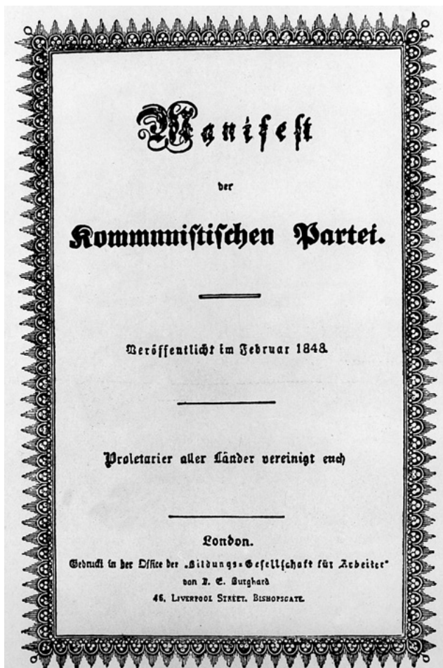
Titelseite der Erstausgabe, London 1848.

Der „konservative oder Bourgeoisozialismus“ (488–489) erschöpft sich nach Marx und Engels in bloß philanthropisch-humanitären Verbesserungsbestrebungen, die an der grundsätzlichen Problematik der gegenwärtig bestehenden materiellen Lebensbedingungen und der diesen vorausgehenden Produktionsverhältnisse im Kern gar nichts änderten. Die Vertreter dieser Richtung erstrebten lediglich „die bestehende Gesellschaft mit Abzug der sie revolutionierenden und sie auflösenden Elemente“ – also nichts anderes als „die Bourgeoisie ohne das Proletariat“ (488)!