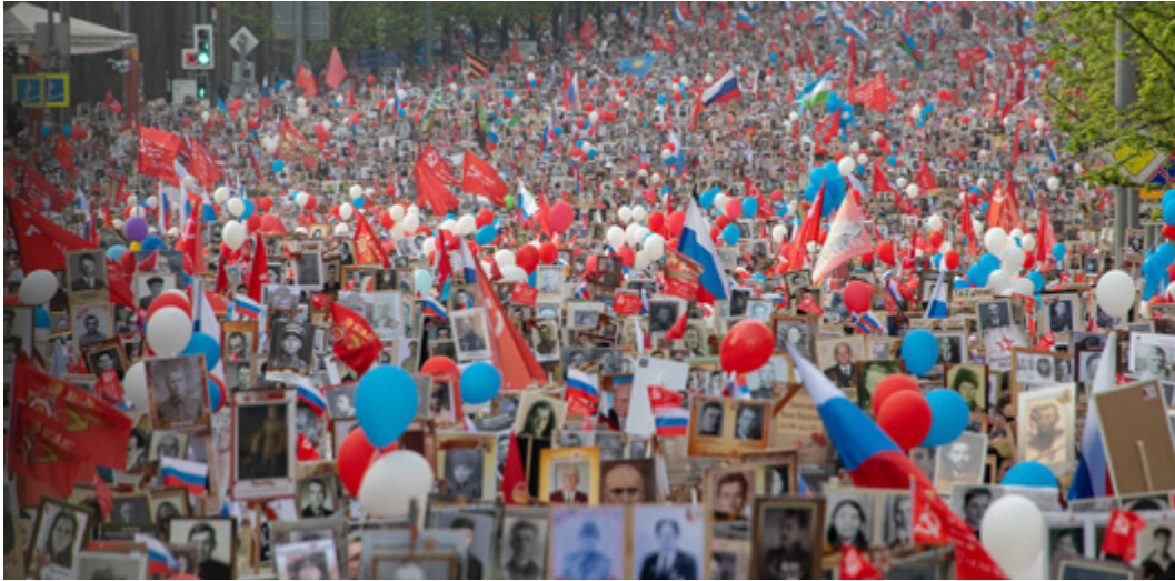
Der Marsch des Unsterblichen Regiments in Moskau am 9. Mai 2019.

sich dem Ritual mit einem Bild seines Vaters an. Der Staat hat schnell das Potential erkannt und instrumentalisiert. Indem der Präsident sich als ein Mann aus dem Volk in die Gemeinschaft einreicht und in der politischen Rhetorik in diesem Zusammenhang Adjektive wie „volkstümlich“ und „völkerverbindend“ verwendet werden, soll das Gefühl einer konsolidierten Gemeinschaft um einen starken Führer, beinahe ein Familienoberhaupt, entstehen. Und außenpolitisch wird der Marsch des Unsterblichen Regiments, das zuletzt in über 40 Ländern stattfand, nun genutzt, um Russlands Landsleute im Kampf für die Bewahrung des historischen Gedächtnisses zu mobilisieren und anderen Interpretationen des Krieges entgegenzutreten.