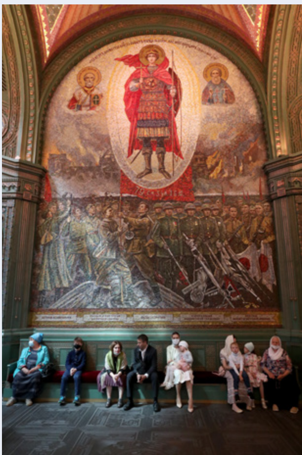
Mosaik an den Wänden der Kathedrale der Streitkräfte in Kubinka bei Moskau.

Im Park „Patriot“ bei Moskau wurde im Juni 2020 die neue „Hauptkirche der Streitkräfte Russlands“ geweiht, deren Altarstufen aus dem Metall erbeuteter Waffen aus dem Zweiten Weltkrieg gegossen wurden. Dieses Bild ist auf den ersten Blick verstörend und doch bringt es die nationale Idee Russlands und den herrschenden imperialen, militärischen, bedrohungs-zentrierten Diskurs auf den Punkt.