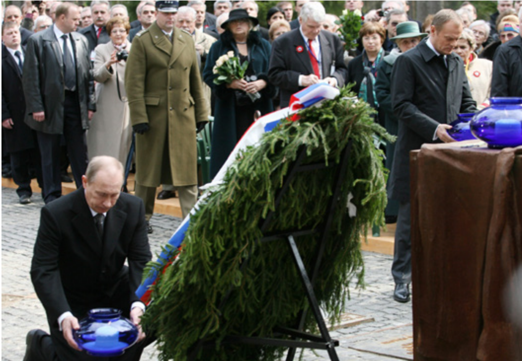
Wladimir Putin im April 2010 bei der Gedenkveranstaltung in Katyn – inzwischen verschweigt er das Massaker, etwa in seinem Artikel von 2020.

Im Jahr 2012 wurde die Kommissionsarbeit eingestellt. Ihre Publikationen mit Gegenargumenten und oftmals Gegenbeschuldigungen waren für die Beilegung der Konflikte eher hinderlich. Die Auflösung des Gremiums war vor allem bedingt durch die verbesserten Beziehungen und den versöhnlichen Ton zwischen Russland, Lettland, aber vor allem Polen in den Jahren 2009 bis 2012. Dies zeigte sich zum einen in der politischen Rhetorik, denn Präsident Dmitri Medwedew und Premierminister Putin äußerten sich in dieser Zeit regelmäßig zu einer Reihe brisanter Fragen der sowjetischen Geschichte aus einer klar antistalinistischen Position. Zum anderen trugen konkrete Maßnahmen dazu bei, etwa die Bildung von gemeinsamen Historikerkommissionen oder die Übergabe von ehemals geheimen Archivdokumenten zum Fall „Katyn“ an Polen.