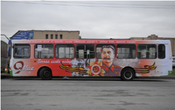
Bus mit dem Porträt von Josef Stalin, Sankt Petersburg 2010. Die sogenannten stalinobusy fahren bis heute jedes Jahr im Mai in verschiedenen Regionen Russlands.

gramms zur patriotischen Erziehung zahlreiche militärhistorische Gesellschaften gegründet, die sich stark in der Bildungsarbeit engagieren, indem sie etwa Geschichte zum Erleben in Form von Reenactments anbieten. Dabei sollen sich gerade junge Menschen als Teil einer siegreichen Großmacht sehen können.