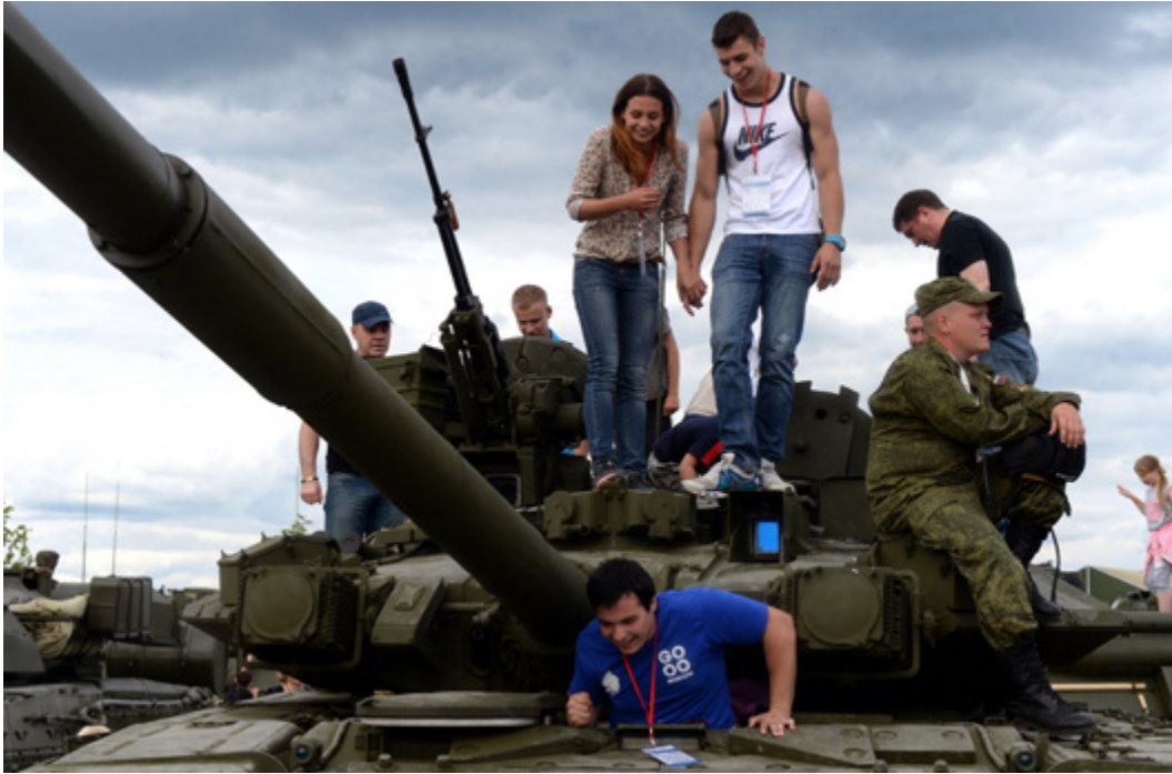
Besucher im Freizeitpark „Patriot“ in Kubinka bei Moskau inspizieren einen russischen Panzer T-72.