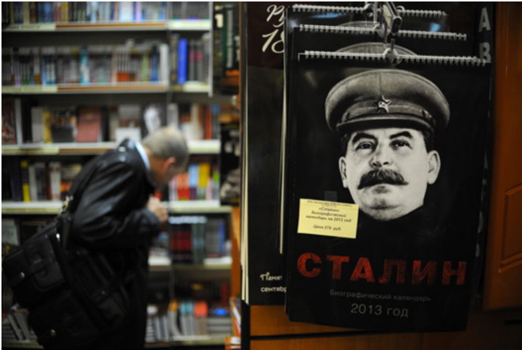
Biographischer Kalender Josef Stalins in einer Moskauer Buchhandlung.

Wirtschaftslenker“ in einer Epoche großer Errungenschaften reflektiert; es ist längst salonfähig geworden, sich als Stalinist zu bekennen.