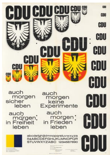
Abb. 13: Druckereivorlage zur Bundestagswahl 1961 (ACDP 10-001-1099/15)

Kandidatenplakate, die grafisch etwas überarbeitet wurden, hielten sich an das vorgegebene Schriftschema. 153 Verantwortlich dafür dürfte die bereits seit 1953 für die CDU tätige Düsseldorfer Agentur Dr. Hegemann GmbH gewesen sein, die den Wahlkampf gemeinsam mit Die Werbe GmbH & Co aus Essen organi-