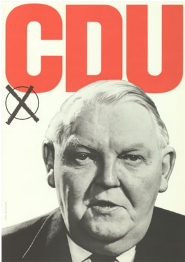
Abb. 14: Plakat zur Bundestagswahl 1965 (ACDP 10-001-1119)

bots“ skizziert habe. 167 Es wurde allerdings empfohlen, das Adler-Kreuz-Logo „nicht ausdrücklich als Plakat und im Inserat zu verwenden“. 168