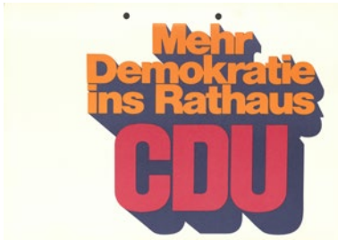
Abb. 16: Logo des Landesverbandes Hamburg zur Bürgerschaftswahl 1970

entwicklung, das heißt Modernisierung dieser Elemente“ beauftragt. 191 Im November entschied man sich dann für einen Entwurf, wobei die Helvetica für Slogan und Logo beibehalten wurde. Der Slogan war in Orange gehalten, das Logo weiterhin in Rot. Beide wurden jedoch parallelperspektivisch dargestellt (Abb. 16). 192