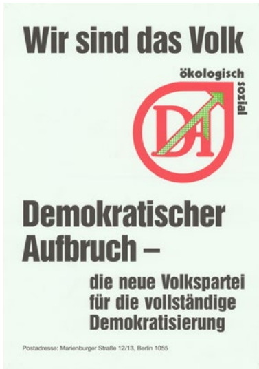
Abb. 23: Plakat des Demokratischen Aufbruchs (ACDP 10-024-5150)

Wie oben beschrieben, führte die Demokratisierung der CDU der DDR als Folge der Friedlichen Revolution zu Diskussionen über die Neugestaltung des eigenen Logos. Die angestellten Überlegungen zur Umgestaltung wurden durch die Ende Januar erfolgte Vorverlegung der Volkskammerwahl vom Mai auf den 18. März 1990 und die Gründung des Wahlbündnisses Allianz für Deutschland (DA) und der Deutschen Sozialen Union (DSU) jedoch rasch obsolet. 275 Auf der Großen Runde der Allianz am 6. Februar 1990, zu der neben den drei Parteien auch Vertreter der CDU-Bundesgeschäftsstelle, der KAS und des CDU-Landesverbandes Berlin zusammenkamen, wurde festgelegt, dass die CDU der DDR mit dem Logo der bundesdeutschen CDU in den Wahl-