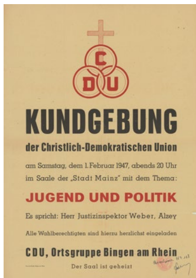
Abb. 8: Plakat der Ortsgruppe Bingen am Rhein von 1947

Auch bei der CDU Rheinland-Pfalz war, wie in Baden, ein Wappen ein zentrales Logoelement. Unter dem Schriftzug „cdU“ in gebrochenen Minuskeln befand sich das Landeswappen in einer abgewandelten Form. Während es im Original von einer eingebogenen Spitze gespalten wurde, war es hier halbgelalten und geteilt. Außerdem hatte man die Volkskrone aus dem Wappen entfernt. Umschrieben war es von einer serifenlosen Linear-Antiqua mit „Land /