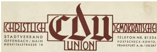
Abb. 6: Briefkopf des Kreisverbandes Offenbach-Stadt von 1948 (ACDP 01-165-009/2)

Einige Verbände nutzten das Logo der Reichsgeschäftsstelle, 57 häufiger blieb man jedoch beim ausgeschriebenen Parteinamen als Wortmarke oder verwendete einfach die Abkürzung CDU. Dadurch gab es einen fast unüberschaubaren Variantenreichtum in dieser Hinsicht. Bei den Kürzeln wurden Antiqua-Schriften bevorzugt, während gebrochene Schriften eher die Ausnahme blieben. 58 Die Verwendung der Fraktur für den ausgeschriebenen Parteinamen kam hingegen häufiger vor, so im Briefkopf des Landesverbandes Schleswig-Holstein, der aber dazu noch ein Kürzel in Grotteskschrift führte. 59 Der Kreisverband Offenbach-Stadt verwendete einen sehr dominanten Briefkopf mit der Wortmarke CDU in gebrochener Schrift, die von den drei ausgeschriebenen Namensbestandteilen in einer sehr dekorativ gestalteten Schrift an drei Seiten umstellt war. Dieser in einem etwas dunkleren Rotton gehaltene Bereich war von einem gleichfarbigen Rahmen umgeben, aus dem jedoch der obere Teil des D-Bogens herausbrach. Die bestehenden Kontaktdaten des Kreisverbandes waren in Futura gehalten (Abb. 6). 60