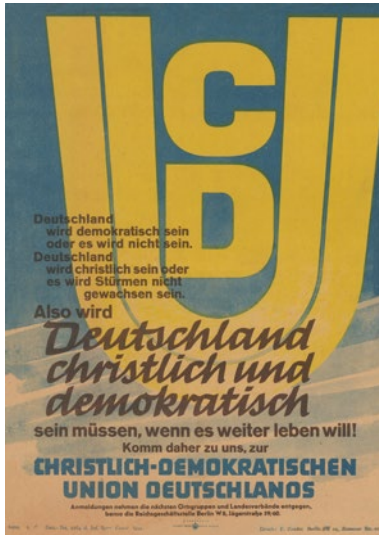
Abb. 2: Plakat mit dem Reichsgeschäftsstellenlogo von 1946