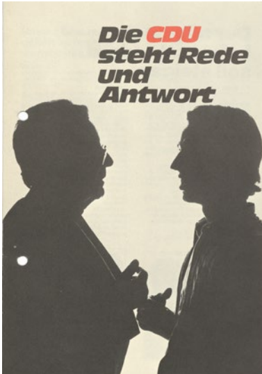
Abb. 19: Faltblatt der CDU Rheinland-Pfalz zur Landtagswahl 1971 (ACDP 03-026-113/1)