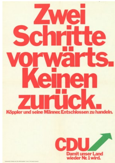
Abb. 18: Plakat des Landesverbandes Nordrhein-Westfalen zur Landtagswahl 1970 (ACDP 10-009-600)

dynamisch-aktiv“ nötig. 197 Den Zuschlag erhielt jedoch die Düsseldorfer Agentur Troost, da man „eine neue Linie in die Wahlkampfwerbung“ bringen wollte. 198 Als Schriftart für Slogans und Logo wurde Franklin Gothic festgelegt, als Farbe „Perfekt-Rot“. Zusätzlich wurde jedoch rechts neben das Akronym CDU ein aufwärtsstrebender grüner Pfeil gesetzt, womit nicht nur eine Wiedergabe der Landesfarben, sondern offenbar auch der gewünschte dynamische Effekt erreicht werden sollte (Abb. 18). 199