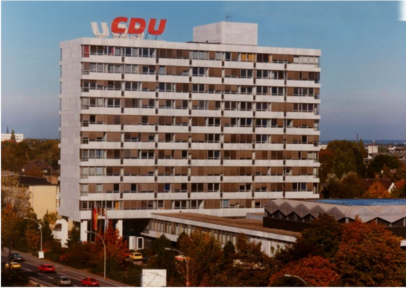
Abb. 20: Foto des Konrad-Adenauer-Hauses in Bonn

sollte. 236 Das Präsidium der CDU fasste am 17. Januar einen entsprechenden Beschluss (Abb. 20). 237 Kurz darauf informierte Elschner dann auch die Landesgeschäftsführer. Die Abteilung Öffentlichkeitsarbeit sollte den Landesverbänden ein Gestaltungsmuster mit genauer Farbangabe, einen Vorlagenkatalog und ein Muster für Briefköpfe zusenden. 238 Diese Zusage erfüllte Werner Brüßau wenige Tage später. 239