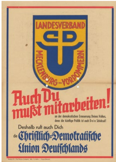
Abb. 3: Plakat der CDU Mecklenburg-Vorpommern

nur als Notlösung gedacht war, allgemein im Zonenverband akzeptiert worden war. Auch die beginnende Transformation der CDU zur von der SED abhängigen Blockpartei änderte zunächst nichts an der Verwendung des Logos.