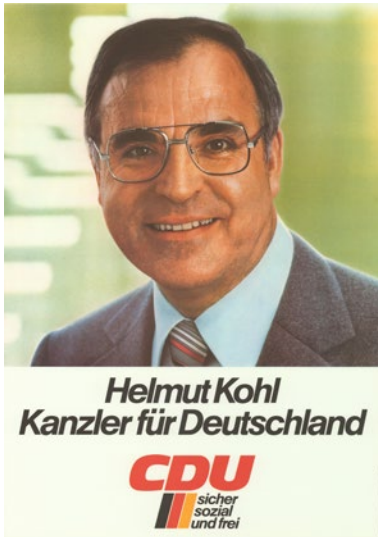
Abb. 22: Plakat zur Bundestagswahl 1976 (ACDP 10-001-1802)

Diese Linie wurde konsequent auch in den Bundestagswahlkämpfen 1980 und 1983 verfolgt, 269 bis man sich 1987 für die Subline „Die Zukunft“ entschied, die aufwärtsstrebend in einer himmelblauen Handschrift gestaltet worden war. Der schräggestellte Flaggenblock blieb jedoch erhalten. 270 Ohnehin war die Adaptivität des Logos seine große Stärke. Selbst in vereinzelt Fällen, in denen Parteigliederungen nicht auf das CDU-Rot zurückgriffen, behielt die Schrift ihre markante Aussagekraft. 271 Es konnte jedoch auch, wie die Bundestagswahlkämpfe gezeigt hatten, erweitert werden. Der Landesverband Berlin entschied sich beispielsweise für seinen Briefkopf für den Ausdruck „Berliner CDU“, wobei „Berliner“ ebenfalls in roter Antique Olive gestaltet worden war, ergänzt durch den bekannten grünen Aufwärtspfeil. 272