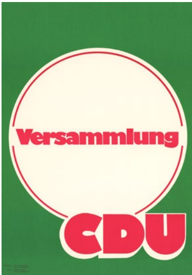
Abb. 17: Plakat der CDU in Niedersachsen zur Landtagswahl 1970 (ACDP 10-008-306)