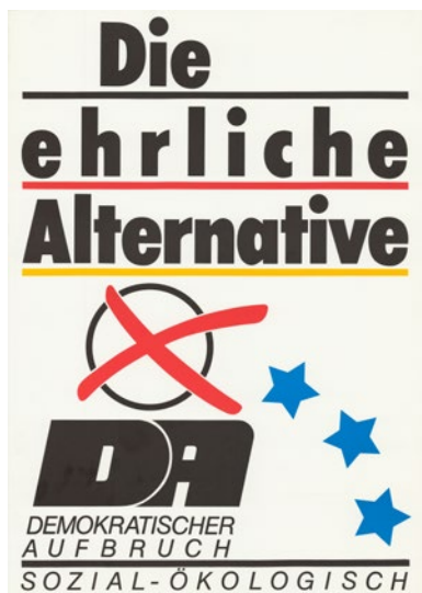
Abb. 24: Plakat des Demokratischen Aufbruchs