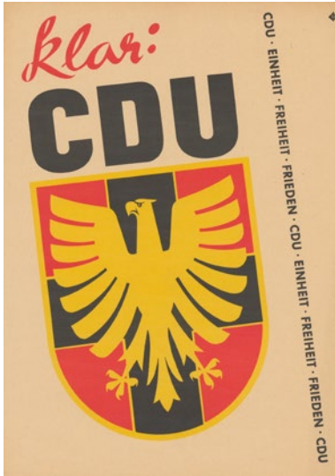
Abb. 12: Plakat zur Bundestagswahl 1953 (ACDP 10-001-418)