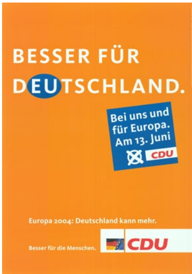
Abb. 26: Plakat zur Europawahl 2004

traleren CDU Kievit abgelöst, die nun für die Gesamtpartei, insbesondere auch bei Onlineauftritten, verbindlich werden sollte. 303