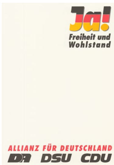
Abb. 25: Plakatvorlage der Allianz für Deutschland

schwarz gefärbten Begriffe „ökologisch“ und „sozial“ gruppierten (Abb. 23). 279 Der Aufbruch aus einem umgrenzten Raum konnte so bildlich wie farblich eindrucksvoll dargestellt werden. Für den Wahlkampf dürfte die Gestaltung aber wohl zu komplex gewesen sein. Auch wenn das Protokoll der Vorstandssitzung am 8. Februar keinen ausdrücklichen Beschluss über das Logo enthielt, wurde die Vorstellung der Werbematerialien der Allianz für Deutschland darin festgehalten. 280 Es ist anzunehmen, dass in diesem Zusammenhang eine Übereinkunft erzielt worden ist, das Logo umzuändern. Die neue Version bestand nun aus einem schrägrechts geneigten A, das zu etwa einem Drittel vom D überlagert wurde, beide in einer ultrafetten Schrift, die durchaus eine gewisse Ähnlichkeit zur Antique Olive aufwies (Abb. 24). 281 Somit konnten die Logos der drei Parteien visuell angeglichen werden, was für den gemeinsamen Wahlkampf nur vorteilhaft sein konnte. Alle drei Logos wurden auf den gemeinsamen Plakaten und Flugblättern der Allianz für Deutschland abgedruckt. Hinzu kam eine Art Logo der Allianz (Abb. 25). Es bestand aus dem Wort „Ja!“ in Schwarz-Rot-Gold und darunter, in kleinerer Schrift, der Subline „Freiheit und Wohlstand“.