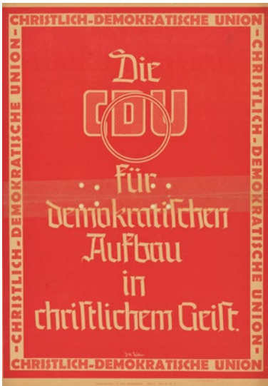
Abb. 9: Plakat der CDU Recklinghausen von 1946 (ACDP 10-017-8)

Rheinland / Pfalz“. 76 Die Veränderungen waren wohl vorgenommen worden, um wappenrechtliche Streitigkeiten mit dem Land zu vermeiden.