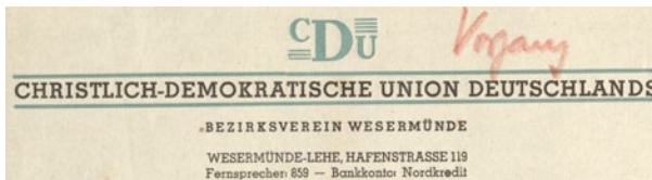
Abb. 7: Briefkopf des Bezirksvereins Wesermünde von 1947 (ACDP 01-182-013/02)

Die verwendeten Wortmarken wiesen in einigen Fällen Charakteristiken von Schriftkunst auf. Die CDU in Wesermünde (ab 1947 Bremerhaven) verwendete die Schriftart Times Bold, allerdings in ungewöhnlicher Anordnung. Gegenüber dem D waren C und U im Kleinformat ausgeführt und links oben beziehungsweise rechts unten neben das D gestellt worden. Die Räume unter dem C und über dem D wurde mit drei bzw. vier horizontalen Strichen aufgefüllt (Abb. 7). 62 Im württembergischen Horb nutzte die CDU eine Schrift im Stile des Art déco mit einem über und unter der Versalhöhe verlängertem C und kleinen griechischen Kreuzen in den Punzen. 63 Die Kreisverbände Alfeld (Leine) und Krefeld verwendeten Wortmarken, deren Buchstaben dreidimensional gestaltet waren. 64 Auch auf Plakaten des Kreisverbandes Hamm von 1946 finden sich entsprechende Signets. 65 Überaus ungewöhnlich war schließlich der Siegelstempel des Kreisverbandes Aalen. C und D bildeten fast einen schwarzen Kreis, von-