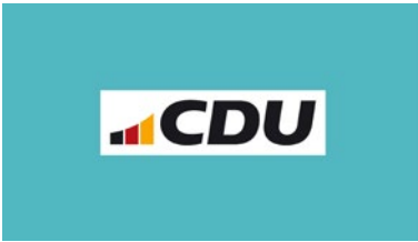
Abb. 28: Logo der CDU seit 2023 (Logo-vorlage der CDU-Bundesgeschäftsstelle)

wird es durch den sogenannten Bogen, der dem Logo vorangestellt wird. Dabei handelt es sich um drei nebeneinanderstehende, in Bogenform ansteigende Balken in den Farben Union-Schwarz, Union-Rot und Union-Gold, die im Manual als „Mercedesstern oder Apfellogo“ der CDU bezeichnet werden und ein wenig an die Signalanzeige eines Mobiltelefons erinnern (Abb. 28). Im Kreativprozess scheinen vor allem die