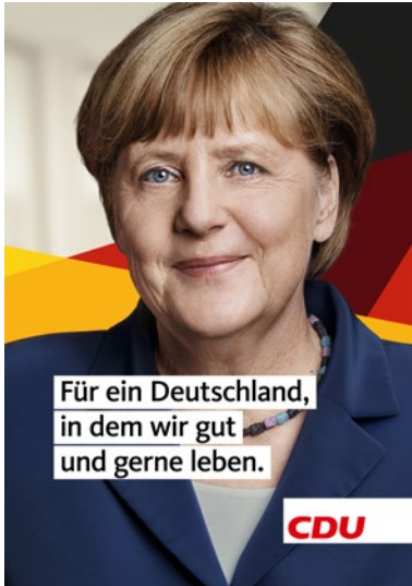
Abb. 27: Plakat zur Bundestagswahl 2017 (ACDP 10-001-15000)

oder virtuell, Vorgaben gemacht. Das Bemühen, auf allen Ebenen eine einheitliche visuelle Strategie durchzusetzen war also klar erkennbar.