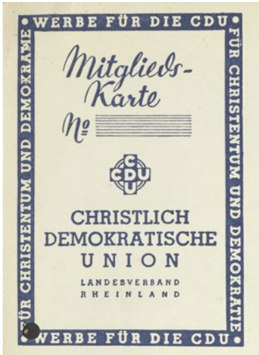
Abb. 10: Mitgliedskarte der CDU Rheinland (ACDP 03-002-025/1)

und sogar im Ruhrgebiet verwendet (Abb. 10). 86 Einen eigenen Weg ging der Kreisverband Monschau. Das Wort UNION wurde über Kreuz gespiegelt, hier über das I, jedoch auf einen stilisierten Schild gelegt, so dass es an ein Wappen erinnerte. 87