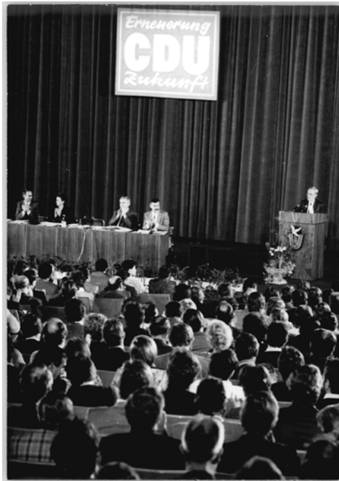
Abb. 5: Foto mit Saalansicht vom Sonderparteitag 1989