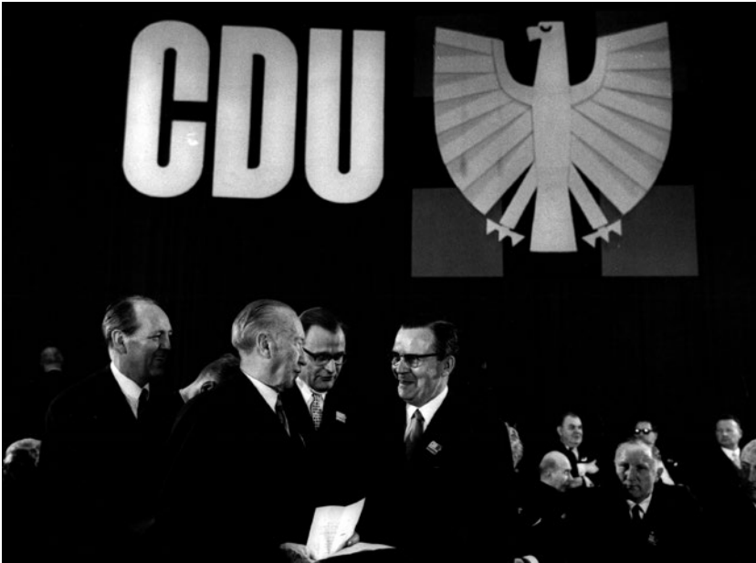
Abb. 15: Foto vom Bundesparteitag 1966 in Bonn

bots“ verwendet. Er zeigte einen noch stärker stilisierten Adler, der stark von geometrischen Formen geprägt war. Die gespreizten Federn waren mit einer etwas dunkleren Goldschicht hinterlegt, so dass das Federkleid fast geschlossen wirkte und der Adler noch dominanter hervortrat (Abb. 15). 179 Dennoch wurde immer deutlicher, dass das Logo als nicht mehr zeitgemäß empfunden wurde. In den Parteitagsillustrierten verschwand es 1965 vom Umschlag und blieb bis 1966 nur noch in Form einer Outline auf Schmutz- und Haupttitel erhalten. 180 1967 prangte auf dem Bundesparteitag in Braunschweig anstelle eines Bildlogos ein gewaltiges Foto des etwa einen Monat zuvor verstorbenen Adenauer an der Frontseite. Hier wurde dann erstmals die 1965 eingeführte rundere Schrift der Wortmarke für die Saaldekoration verwendet, die damit auch in diesem Format die ältere langgezogene Version ersetzte. 181