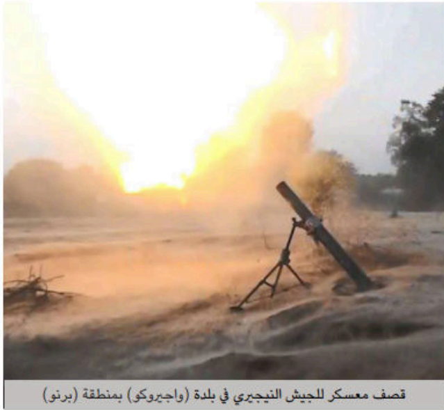
قصف معسكر للجيش النيجيري في بلدة (واجيروكو) بمنطقة (برنو)

The soldiers of the Caliphate in the Western-Africa Province this week attacked an army camp in north-eastern Nigeria. In detail: by the grace of God Almighty, on Sunday, 17 Jumada al- 'Ula, the soldiers of the Caliphate attacked an army camp of the unbelieving Nigerian army in the village of (Wagiroko) in the area of (Borno), with five mortar shells. Pictures shared by ISWAP's media branch showed the impact. Last week the soldiers of the Caliphate already killed and wounded a number of Nigerian soldiers, attacked an army camp and destroyed their equipment in three separate attacks in the area of (Borno) in north eastern Mali.