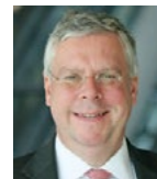
Jürgen Hardt MdB

Chefreporter des Westdeutschen Rundfunks, früherer ARD-Korrespondent in Moskau