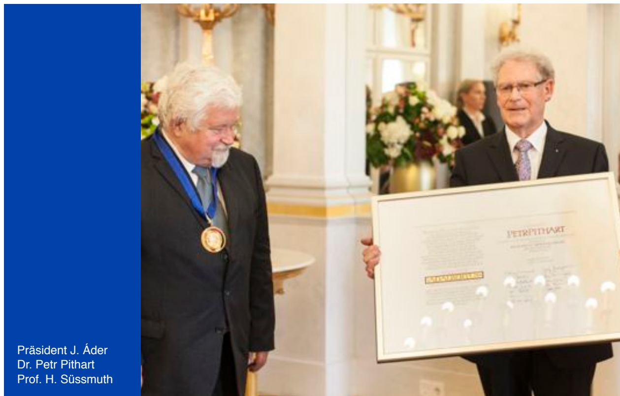
Präsident J. Áder Dr. Petr Pithart Prof. H. Süssmuth