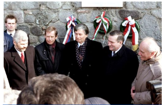
Erster Visegrad Gipfel im Jahr 1991. V.l.n.r.: Krzysztof Bielecki, Václav Havel, József Antall, Lech Walesa, Árpád Göncz