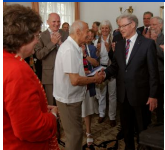
Präsident a. D. Á. Göncz, Prof. Dr. H. Süßmuth

Zum Abschluss der Visite in Budapest legten die Vertreter der Adalbert-Stiftung bei einer Rundfahrt zu den Stätten der Geschichte und des Gedenkens Kränze am Heldenplatz zu Ehren des Unbekannten Soldaten, an der Großen Synagoge und am Grabmal des früheren ungarischen Ministerpräsidenten und Adalbert-Preisträger József Antall nieder.