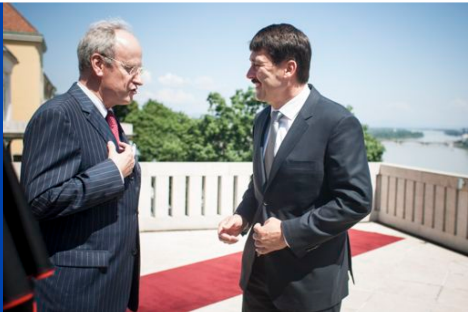
Staatspräsident Dr. János Áder