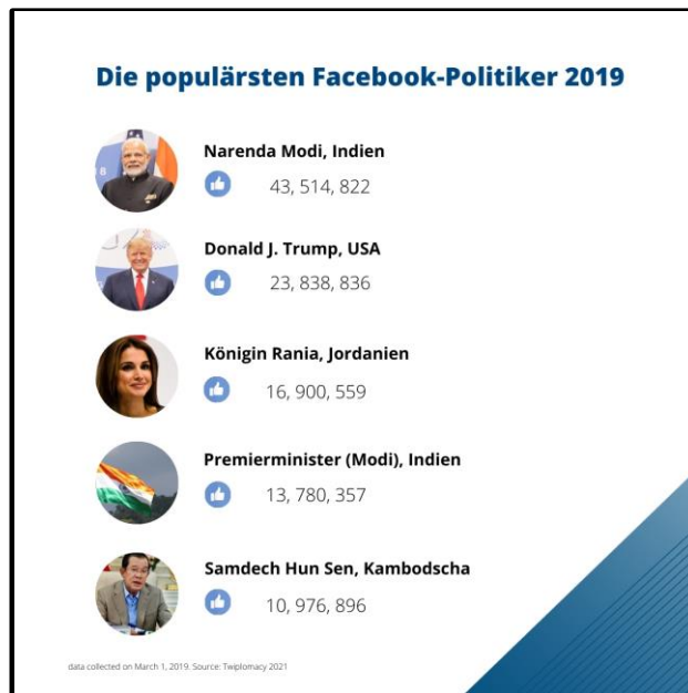
Abb.2: Die populärsten Facebook-Politiker 2019. Eigene Abbildung nach: Twiplomacy 2021, oS.

Zwei weitere kambodschanische Facebook-Seiten mit vielen Likes sind Voice of America (VoA) Khmer und Radio Free Asia Khmer (RFA). VoA ist der Auslandssender der USA ( VoA 2021, oS. ). RFA ist ein asienspezifischer Dienst, der den Zugang zu freien Informationen in Ländern mit einer weniger freien Presse gewährleisten soll ( RFA 2021, oS. ). Beide Sender werden von den Vereinigten Staaten finanziert und bieten regierungsunabhängige Informationen an. Der Betrieb der beiden Sender in Kambodscha verläuft keineswegs reibungslos. Im Jahr 2017 schloss RFA beispielsweise sein Büro in Phnom Penh, da die Regierung die Daumenschrauben für die Presse anzog ( Liu 2016, oS. ). Die Phnom Penh Post gehört ebenfalls zu den wichtigsten kambodschanischen Facebook-Seiten. Die Zeitung, die täglich in englischer und kambodschanischer Sprache erscheint, hat bisher eine relativ unabhängige Berichterstattung beibehalten und berichtet weiterhin kritisch, auch über Premierminister Hun Sen und seine kambodschanische Volkspartei (KVP). Wir stellen also fest, dass unter den beliebtesten Facebook-Seiten unabhängige Stimmen vertreten sind.