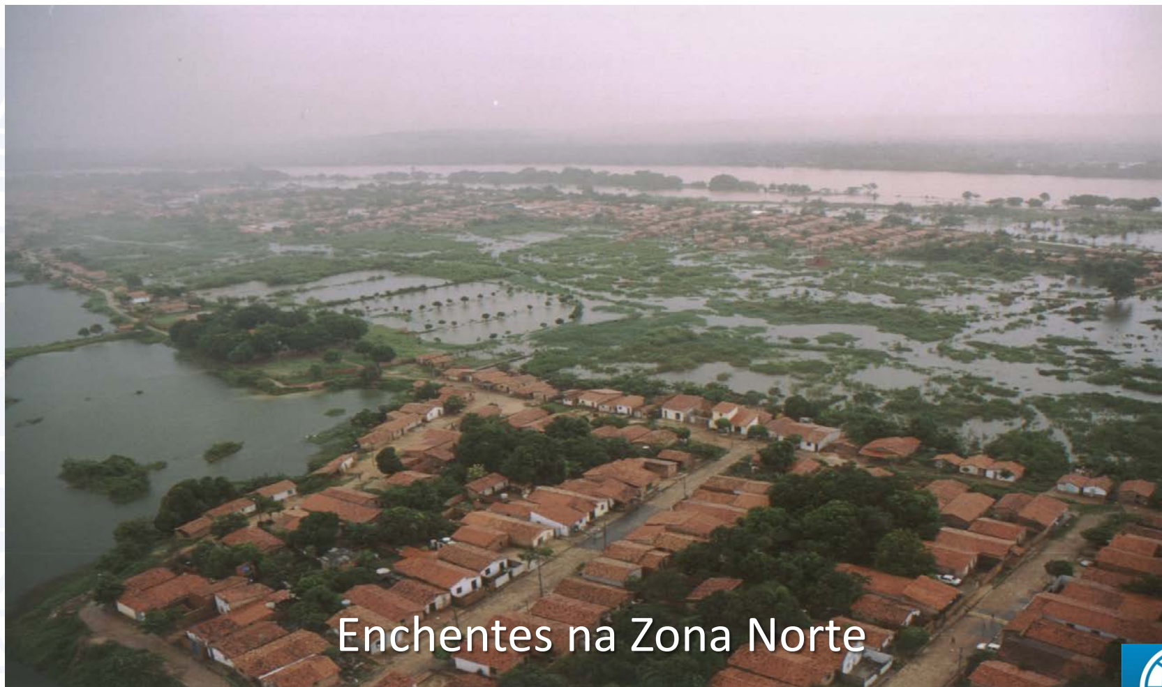
Enchentes na Zona Norte