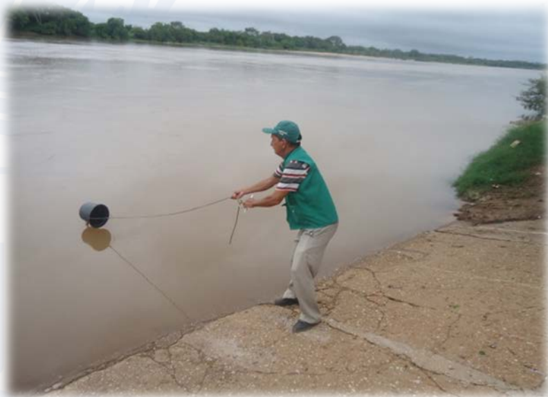
Coleta da água