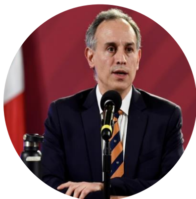
Hugo López-Gatell

Frase de la semana: "Mi misión, que López-Gatell no recibiera la Medalla Belisario Domínguez fue cumplida": Lilly Téllez, Senadora de la República.