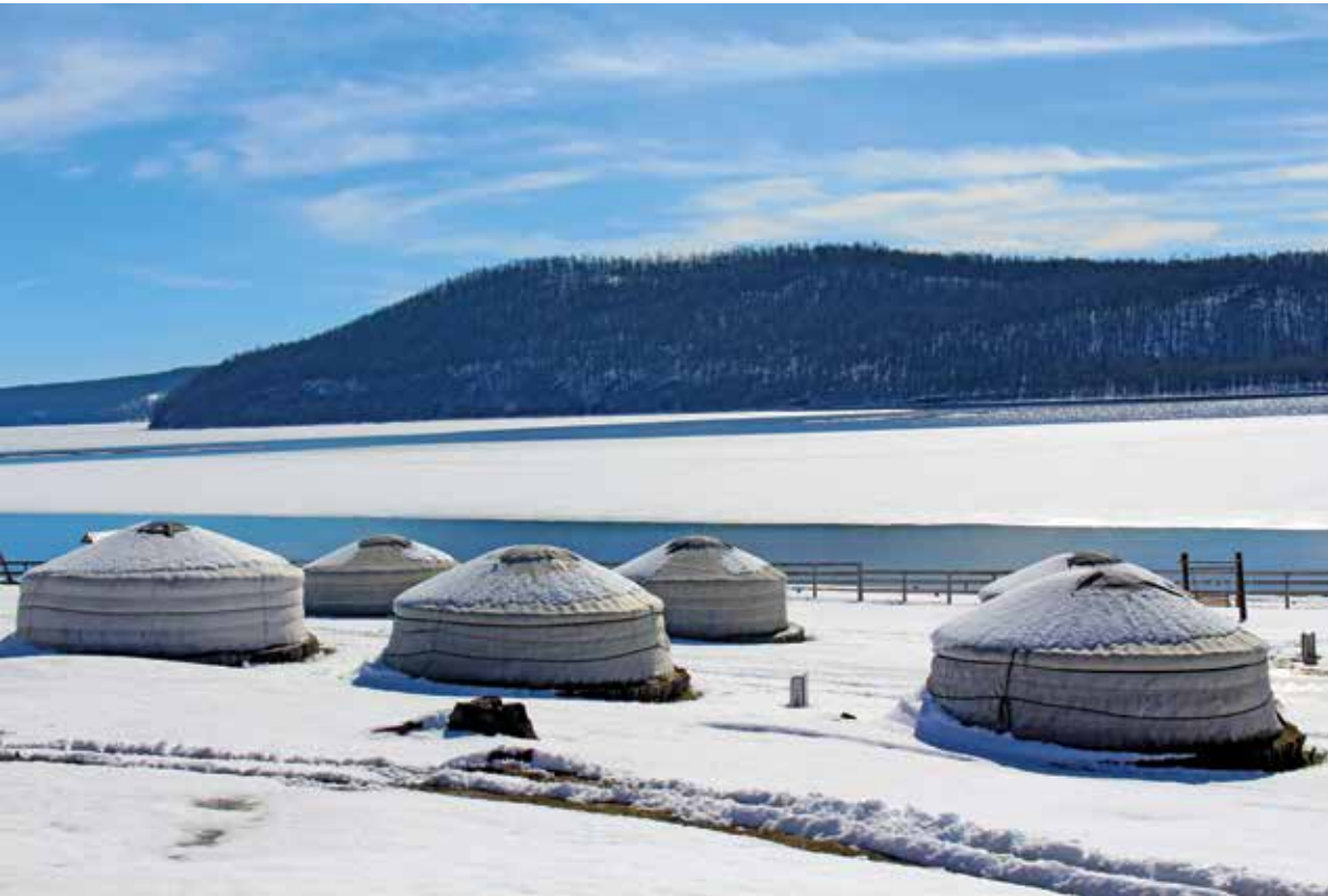
Schneebedeckte Jurten am Khuvsgul-See