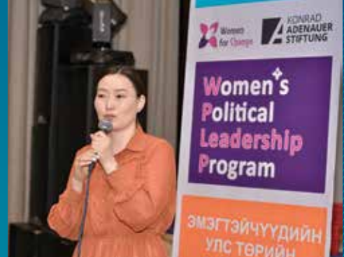
Women's Political Leadership Program

Unser Expertenpanel Staatsaufbau erstellt wissenschaftliche Analysen und Handlungsempfehlungen zu einer geplanten Verfassungsreform und zu rechtspolitischen Rahmenbedingungen.