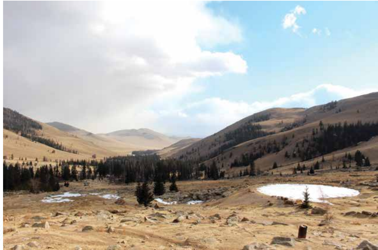
Blick auf die Landschaft der Tuv-Provinz