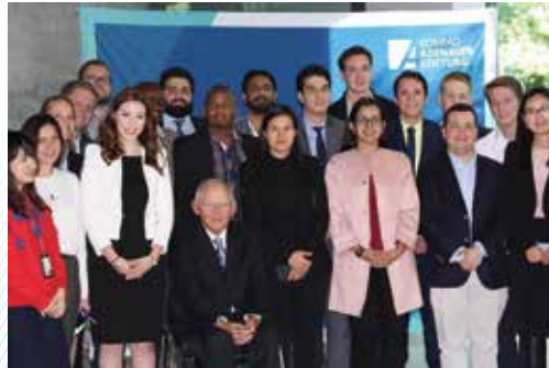
Treffen mit dem Präsidenten des Deutschen Bundestages Dr. Wolfgang Schäuble