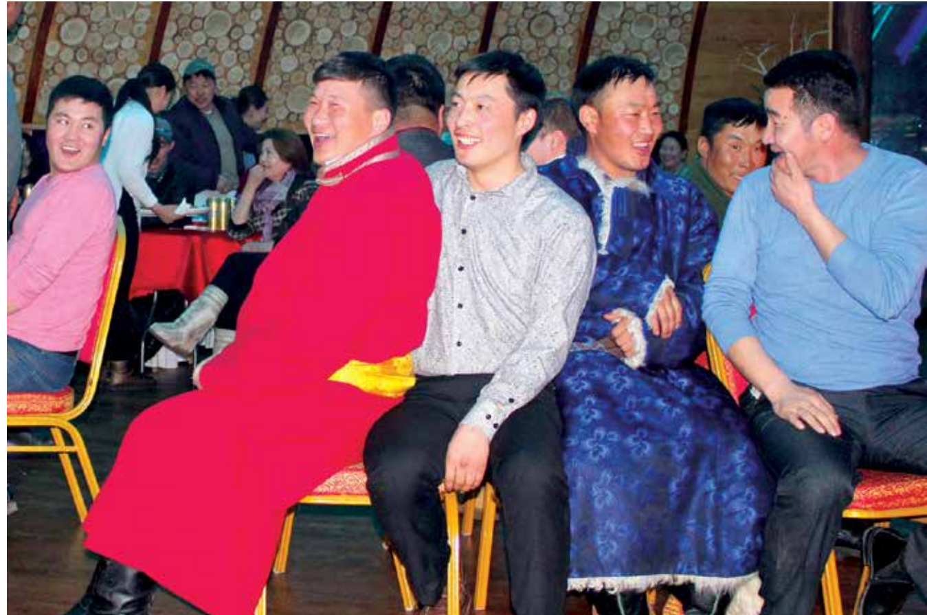
Auch in der Mongolei spielt man „Reise nach Jerusalem“