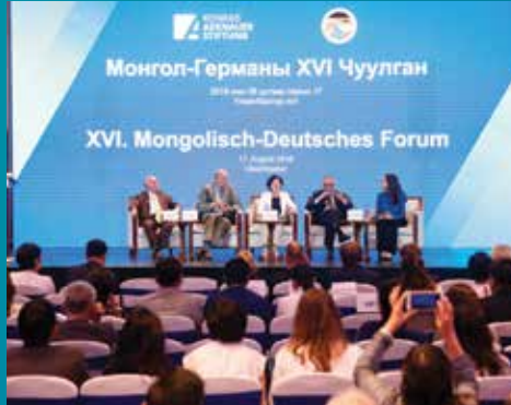
Diskussionsrunde beim XVI. Mongolisch-Deutschen Forum 2018