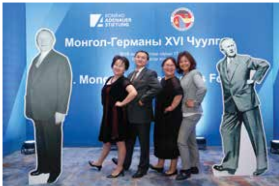
Teilnehmer des Mongolisch-Deutschen Forums

Dr. Ganbat, Botschafter der Mongolei in der Bundesrepublik Deutschland, hob die Bedeutung des Austausches zwischen Deutschland und der Mongolei hervor und warb für intensive Kontakte zwischen beiden Ländern, insbesondere im Bildungs- und Ausbildungsbereich. Über die Frage, wie junge Menschen nachhaltig in die politische Bildungsarbeit involviert werden können, diskutierte ein deutsch-mongolisches Expertenpanel.