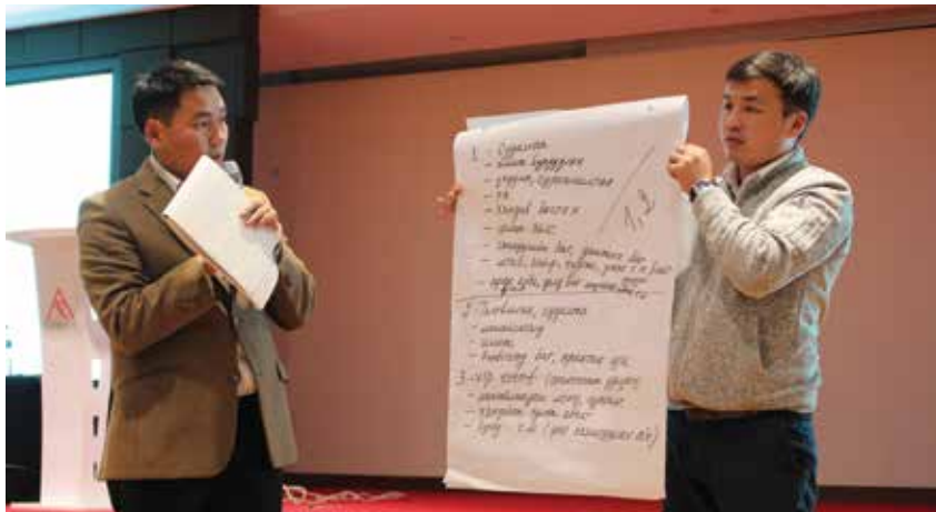
Nachwuchspolitiker präsentieren ihre Arbeitsergebnisse während des Seminars