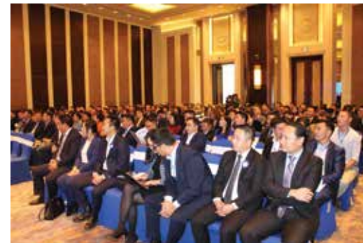
Mehr als 350 junge Teilnehmer und mehrere Abgeordnete kamen zu der Veranstaltung