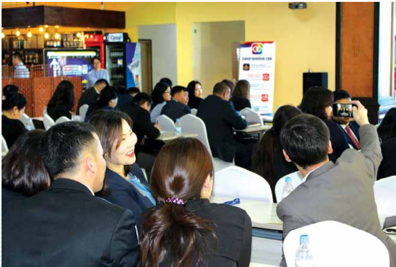
Teilnehmer der Veranstaltung in Darkhan

Im Rahmen der Seminarreihe Aktion Effektive Verwaltung wurden in den Städten Erdenet und Darkhan etwa 200 Staats- und Verwaltungsbeamte zum neuen Beamtengesetz geschult, das 2019 in Kraft getreten ist. Vorgestellt wurden u.a. Methoden zur Effizienzsteigerung, zum Qualitätsmanagement sowie zur Evaluierung von Verwaltungsprozessen. Die Teilnehmer besuchten dabei auch die lokalen Verwaltungen, um sich ein Bild von den Herausforderungen und Lösungsansätzen vor Ort zu machen. Neben dem stellvertretenden Leiter der Regierungskanzlei Byambasuren nahmen auch der Gouverneur der Darkhan-Uul-Provinz, Nasanbat, sowie der Gouverneur der Orkhon-Provinz, Batlut, an der Seminarreihe teil.