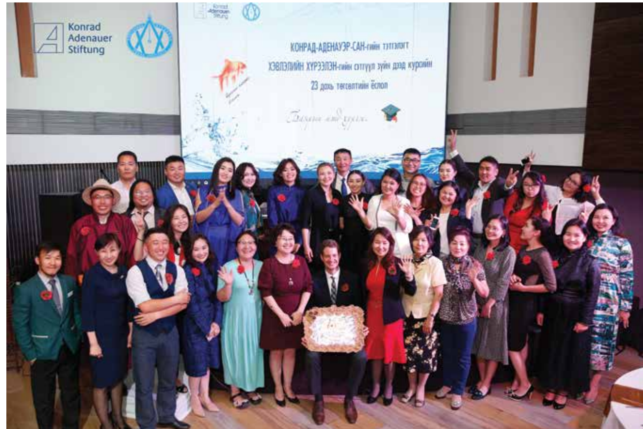
Absolventenfeier des Jahrgangs 2018

Die Abschlussveranstaltung der KAS School for Journalism 2018 fand in Ulaanbaatar statt. Insgesamt 24 Teilnehmer des Programms konnten ihre Zertifikate entgegennehmen. Die besten Absolventen erhielten die Möglichkeit, ihre aktuellen Reportagen und Berichte vor ihren Freunden und Familien vorzustellen. Als besonderen Ausdruck ihres Dankes schenkten die Teilnehmer dem Team der KAS eine künstlerisch dekorierte Torte.