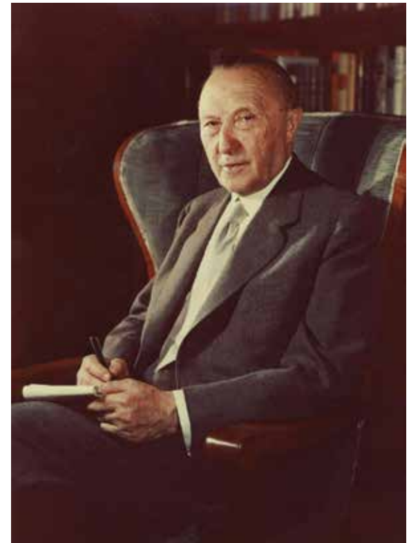
Konrad Adenauer (1876-1967)

Zur Erreichung ihrer Ziele erarbeitet die KAS als Think Tank und Beratungsagentur wissenschaftliche Analysen und politische Handlungsempfehlungen. Sie fördert begabte junge Menschen aus dem In- und Ausland ideell und materiell in der Phase ihrer Ausbildung und verleiht Preise u.a. in den Sparten Literatur und Journalismus. Außerdem werden Tagungen, Kongresse und Seminare sowohl für die interessierte Öffentlichkeit als auch für ausgewählte Zielgruppen organisiert und durchgeführt. Durch dieses breite Spektrum an Tätigkeiten soll die gesellschaftlich-politische Mitbestimmung der Bürger ausgebaut, das Verantwortungsbewusstsein der Entscheidungsträger in Politik und Wirtschaft geschärft sowie die selbstbestimmte Entwicklung eines jeden Staates ermöglicht werden.