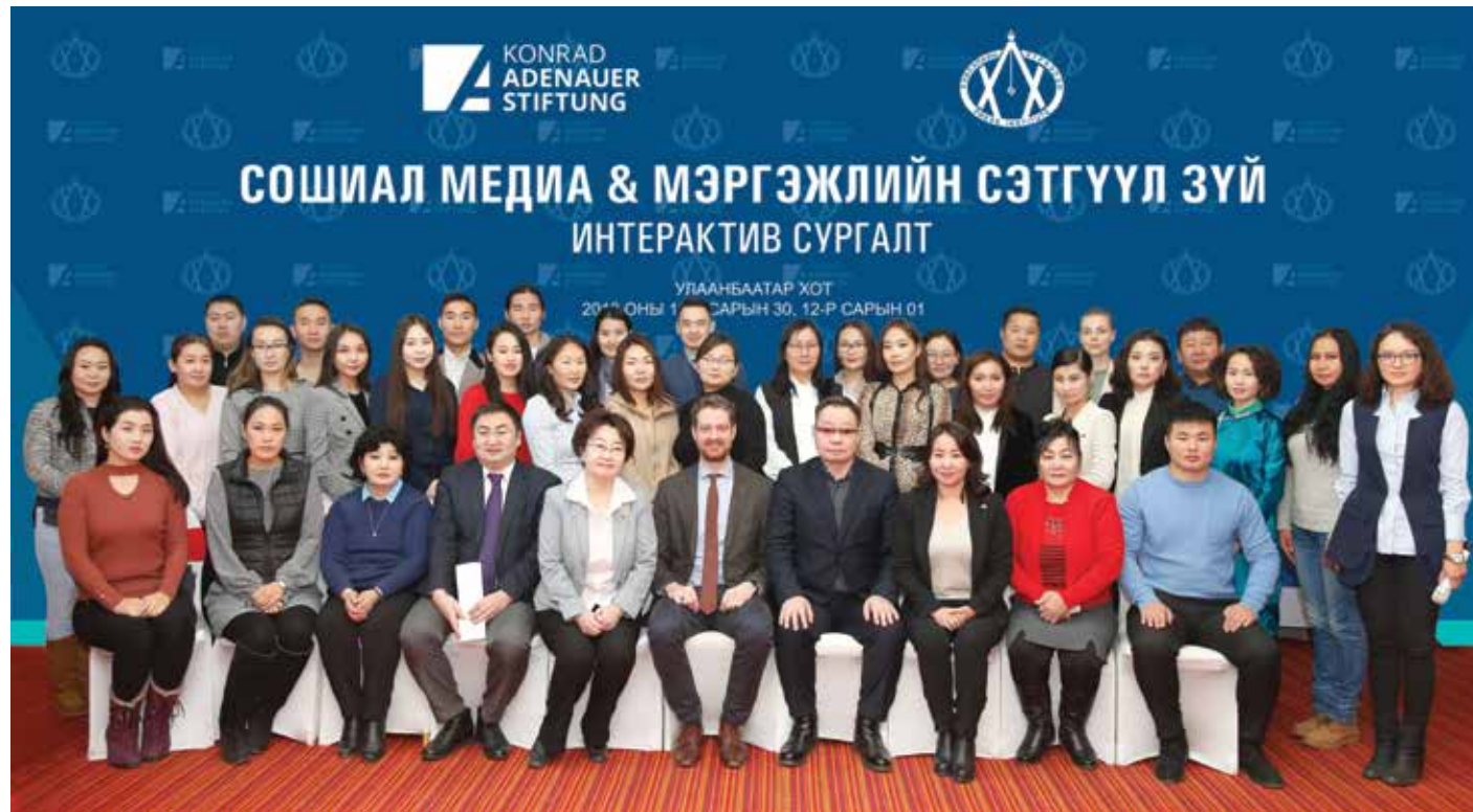
Tauschten sich zur Rolle der sozialen Medien aus: Teilnehmer des Workshops außerhalb Ulaanbaatars

Gemeinsam mit dem Presseinstitut veranstaltete die KAS einen zweitägigen Workshop für Journalisten, der den Einfluss der sozialen Medien auf den Fachjournalismus thematisierte. Neben den Chancen und den Herausforderungen, die die sozialen Medien den Journalisten bieten, wurde über den Datenjournalismus, eine neue Entwicklung im Onlinejournalismus, referiert. Weitere Fachvorträge wurden zu den Themen Parlamentsjournalismus, Politik und Medien sowie zur Rolle der Medien in einer demokratischen Gesellschaft gehalten. Die Veranstaltung verdeutlichte, dass die kostenlosen Informationen und Berichterstattungen im Internet gerade in der bevölkerungsarmen Mongolei eine enorme Herausforderung für kostenpflichtigen Qualitätsjournalismus, insbesondere im Print-Bereich, darstellen.