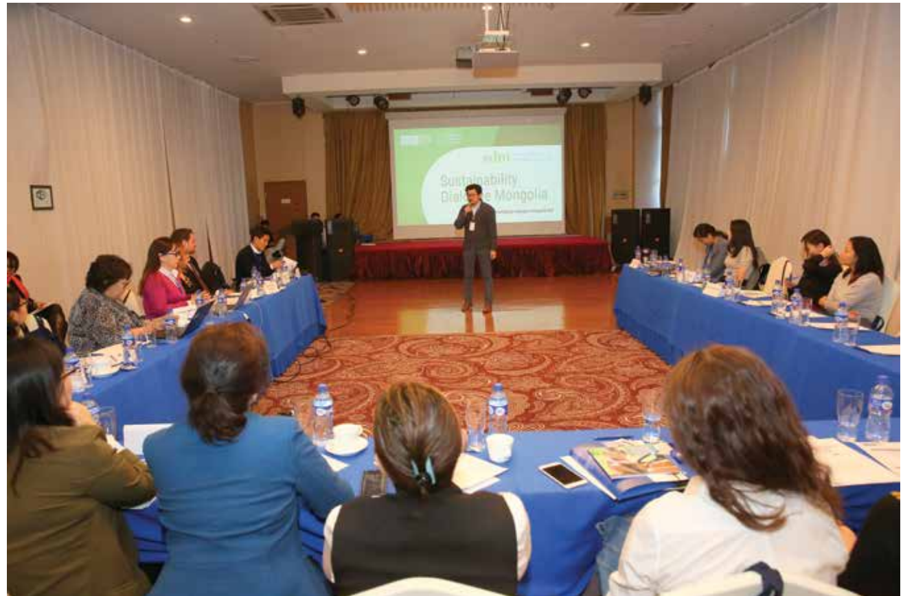
Der Sprecher von APU, dem größten Getränkehersteller der Mongolei, bei seinem Impulsvortrag zu nachhaltiger Unternehmenspolitik

Mehr als 30 Unternehmerinnen und Unternehmer sowie Vertreter des Entwicklungsprogramms der Vereinten Nationen kamen zusammen, um sich über Strategien zur Umsetzung der Sustainable Development Goals auszutauschen. Der Workshop, der in der Hauptstadt Ulaanbaatar stattfand, wurde von der KAS in Zusammenarbeit mit der NGO Corporate Governance Development Center organisiert. Ziel war es, einen gemeinsamen Forderungskatalog zur Erreichung der Nachhaltigkeitsziele zu erarbeiten. Dieser soll dann im Austausch mit politischen Entscheidungsträgern diskutiert werden, um bessere Rahmenbedingungen für Unternehmen zu schaffen, die nachhaltig wirtschaften.