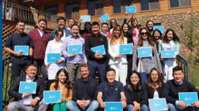
KAS Political Empowerment College

Gemeinsam mit der Akademie für Politische Bildung und der Sant Maral Stiftung führen wir Studien und Meinungsumfragen durch, um das politische Bewusstsein in der mongolischen Gesellschaft zu analysieren und zu schärfen.