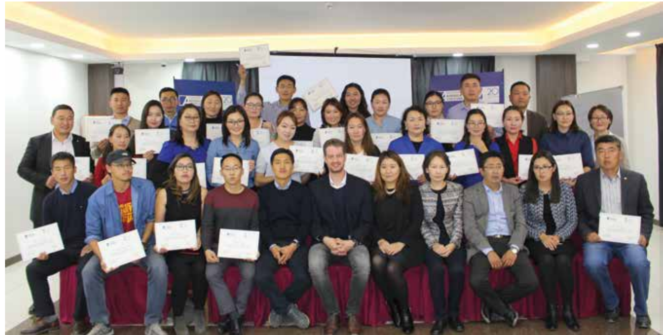
Teilnehmer mit ihren Zertifikaten

Gemeinsam mit Experten der Zorig-Stiftung startete die KAS in der Uvurkhangai-Provinz ihre neue Seminarreihe zur politischen Bildung, die sich insbesondere an die junge ländliche Bevölkerung richtet. In Planspielen und Vorträgen wurden bei diesem Seminar Formen der Bürgerbeteiligung, die Grundlagen des politischen Systems der Mongolei sowie Fragen der Gewaltenteilung diskutiert.