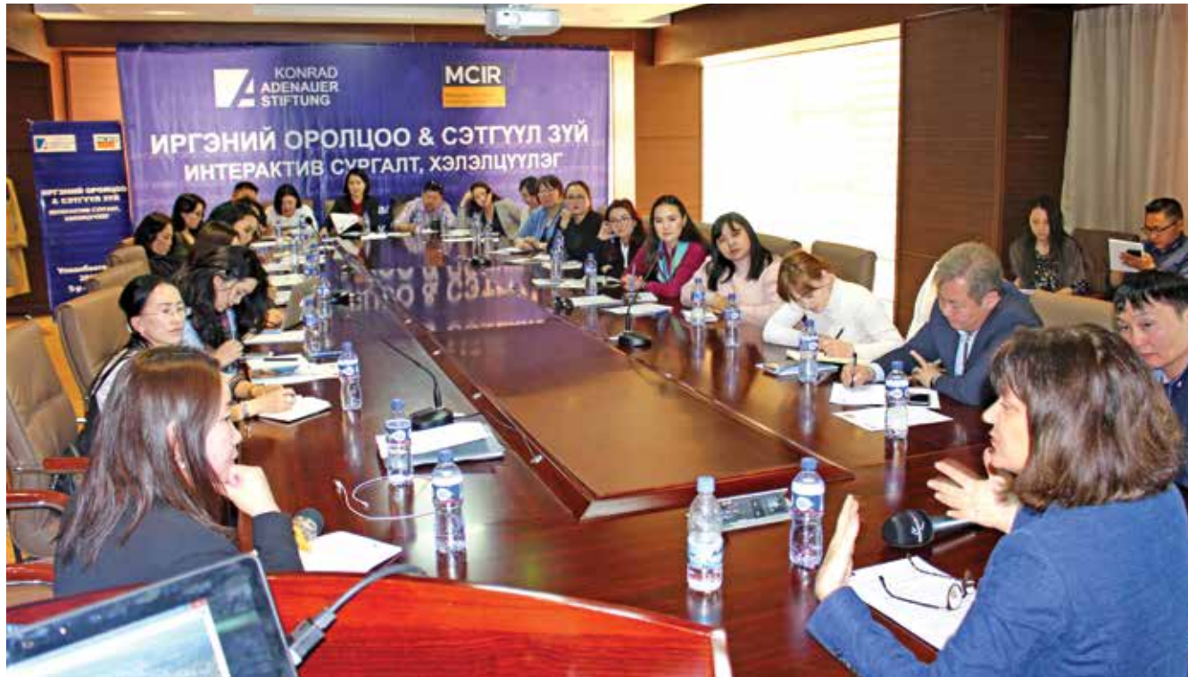
Dr. Eva Lohse, ehemalige Oberbürgermeisterin der Stadt Ludwigshafen am Rhein, bei ihrem Vortrag zu Formen der Bürgerbeteiligung

Im Khustai-Nationalpark fand ein von der KAS in Zusammenarbeit mit dem Zentrum für Investigativjournalismus organisiertes Seminar zu unterschiedlichen Formen der Bürgerbeteiligung statt. Über 30 Journalisten verschiedener Medienbranchen waren hierzu eigens aus Ulaanbaatar angereist, darunter auch zahlreiche Absolventen der KAS School for Journalism der Jahrgänge 2017 und 2018. Dr. Eva Lohse, ehemalige Oberbürgermeisterin der Stadt Ludwigshafen am Rhein, sprach über ihre Erfahrungen mit unterschiedlichen Formaten der Bürgerbeteiligung am Beispiel eines großen Infrastrukturprojekts, dem Neubau der Hochstraße Nord, in ihrer Heimatstadt.