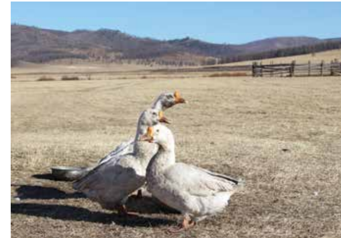
In der Khentii-Provinz werden auch Gänse gehalten, die in der Mongolei eher selten anzutreffen sind