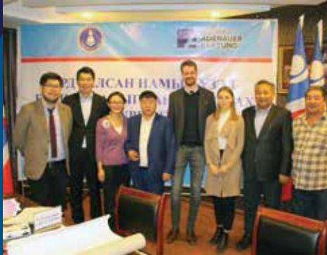
Veranstaltung mit der Akademie für Politische Bildung in Khentii