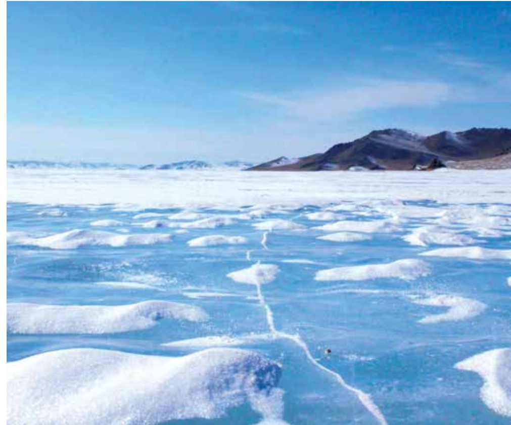
Winterliche Seelandschaft in Arkhangai