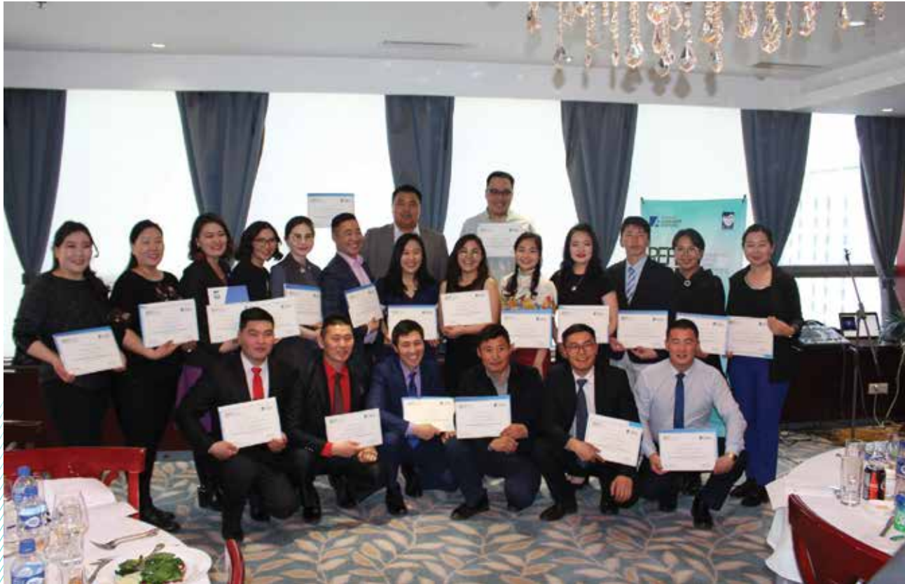
Abschlussfeier des Umweltprogramms von KAS und Zorig-Stiftung

Zwei Wochen hatten sich die Teilnehmer des Rural Environmental Fellowship Program intensiv mit Themen wie Recycling, erneuerbaren Energien, Luftverschmutzung und nachhaltiger Wasserwirtschaft beschäftigt – nun war es Zeit, Abschied zu nehmen und mit neuen Projektideen in die Heimatprovinzen zurückzukehren. Die Abschlussveranstaltung bot den Teilnehmenden und den Organisatoren nochmals Gelegenheit, das Erlernete zu reflektieren und sich über zukünftige Programme zum Umwelt- und Naturschutz in der Mongolei auszutauschen.