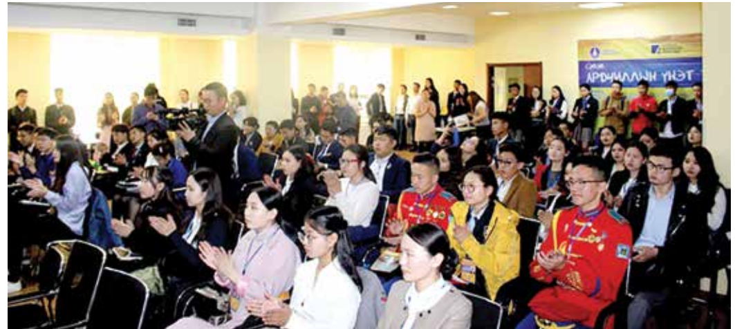
Publikum der Eröffnungsveranstaltung