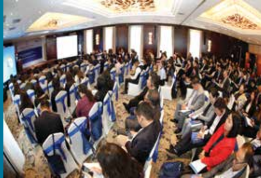
IV. Demokratiekongress 2018