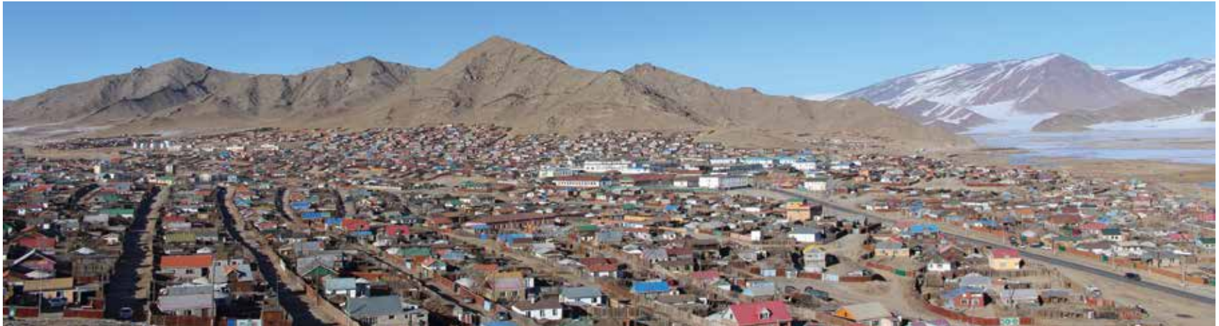
Blick auf das Zentrum der Zavkhan-Provinz