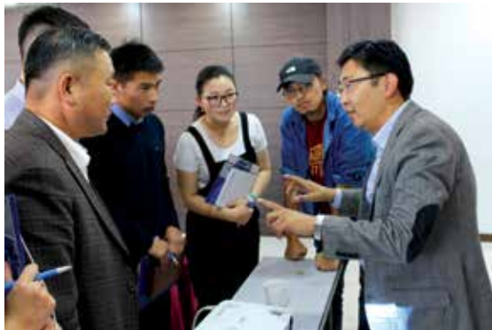
Instruktionen zur Gruppenarbeit

Gemeinsam mit Experten der Zorig-Stiftung startete die KAS in der Uvurkhangai-Provinz ihre neue Seminarreihe zur politischen Bildung, die sich insbesondere an die junge ländliche Bevölkerung richtet. In Planspielen und Vorträgen wurden bei diesem Seminar Formen der Bürgerbeteiligung, die Grundlagen des politischen Systems der Mongolei sowie Fragen der Gewaltenteilung diskutiert.