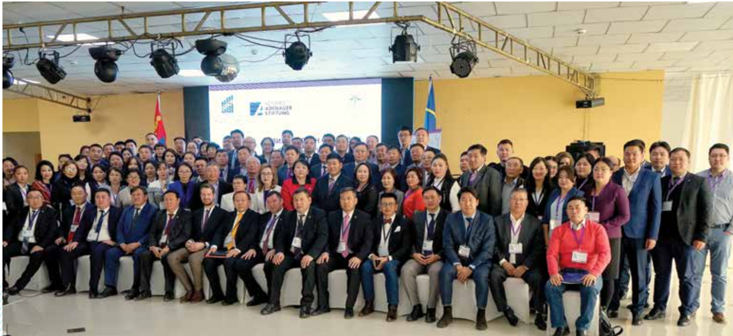
Wirtschaftsforum in Darkhan, einer der größten Städte der Mongolei

Drei Gouverneure und vier Landtagspräsidenten in Darkhan: Gemeinsam mit dem Economic Policy and Competitiveness Research Center veranstaltete die KAS das 5. Regionale Wirtschaftsforum, dessen Ziel die Stärkung der wirtschaftlichen Entwicklung in den Provinzen ist. Rund 200 Gäste nahmen an dem Wirtschaftsforum in der drittgrößten Stadt der Mongolei teil. Vier Panels widmeten sich den Themen Anwerbung und Ausbildung von Fachkräften, Impulse zur Wirtschaftsförderung, Hindernisse und Perspektiven für Investitionen sowie den Exportchancen für regionale Produkte.