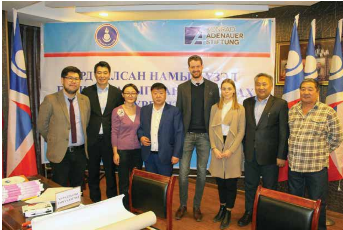
Das Team der KAS Mongolei mit den Dozenten des Seminars