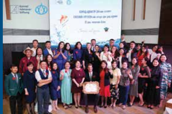
Absolventen der KAS School for Journalism 2018

Durch Seminarreihen mit der Regierungskanzlei der Mongolei stärken wir die Qualifizierung von Staatsbeamten sowie die kommunale Selbstverwaltung.