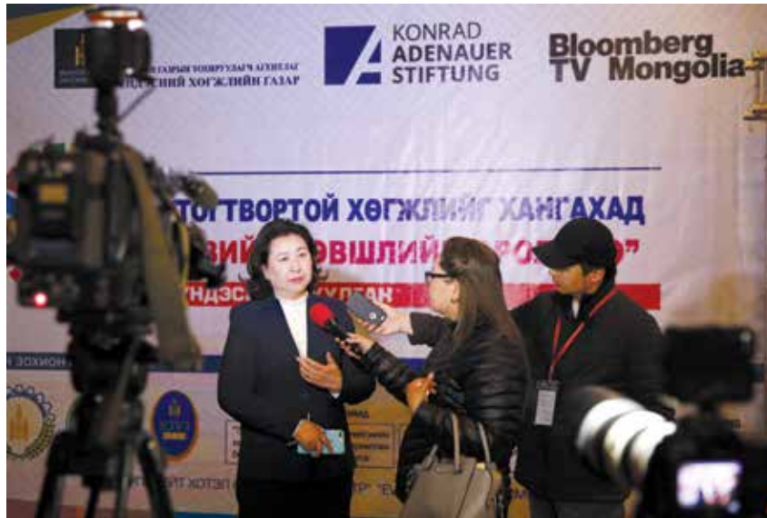
Die Parlamentsabgeordnete Garamjav im Interview