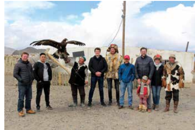
Die Bayan-Olgii-Provinz ist für die Haltung von Adlern bekannt, mit denen dort gejagt wird