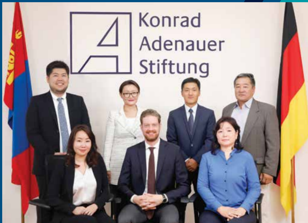
Das Team der KAS Mongolei

Dabei setzt sich die KAS vorrangig für die Prinzipien der Rechtsstaatlichkeit sowie die Förderung der deutsch-mongolischen Beziehungen ein und wirbt für die Soziale Marktwirtschaft. Die KAS ist stark vernetzt mit politischen Institutionen, zivilgesellschaftlichen Organisationen und Bildungseinrichtungen. Ein wichtiges Ziel ist es außerdem, junge und begabte Menschen darauf vorzubereiten, künftig Verantwortung in Politik, Wirtschaft und Gesellschaft zu übernehmen. Dafür vergibt die KAS Stipendien an junge Mongolen für ein Studium sowohl in Deutschland als auch in der Mongolei. Da es in der Mongolei in den Schulen keinen Politikunterricht gibt, legt die KAS in der Mongolei ein besonderes Augenmerk auf politische Bildung. Hierzu werden insbesondere mit jungen Erwachsenen und Studierenden Projekte durchgeführt, bei denen politisches Grundwissen auf lebendige Art vermittelt wird.