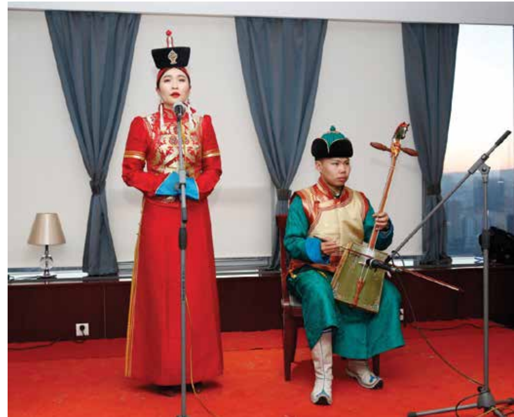
Musikalische Eröffnung mit Kehlkopfgesang und Pferdekopfgeige