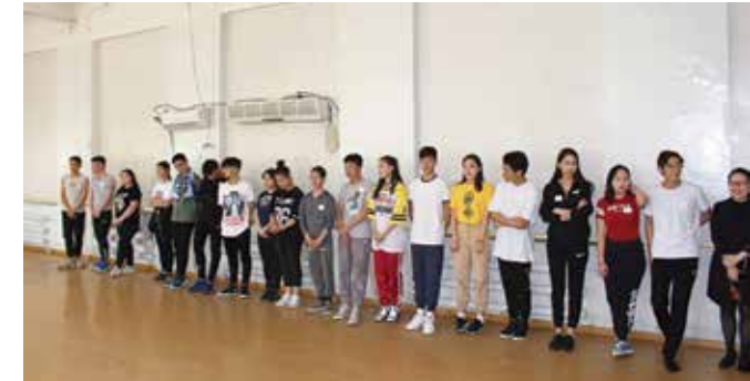
Teilnehmer aus insgesamt neun Schulen

Anlässlich des 70-jährigen Jubiläums der Berliner Luftbrücke fand in Zusammenarbeit mit der Kultursondergesandten der Mongolei, Oyuntuya, und dem Arts Council of Mongolia ein von der KAS gefördertes Projekt statt, welches dem Publikum und vor allem den teilnehmenden Schulkindern tänzerisch dieses historische Ereignis näherbringen sollte.