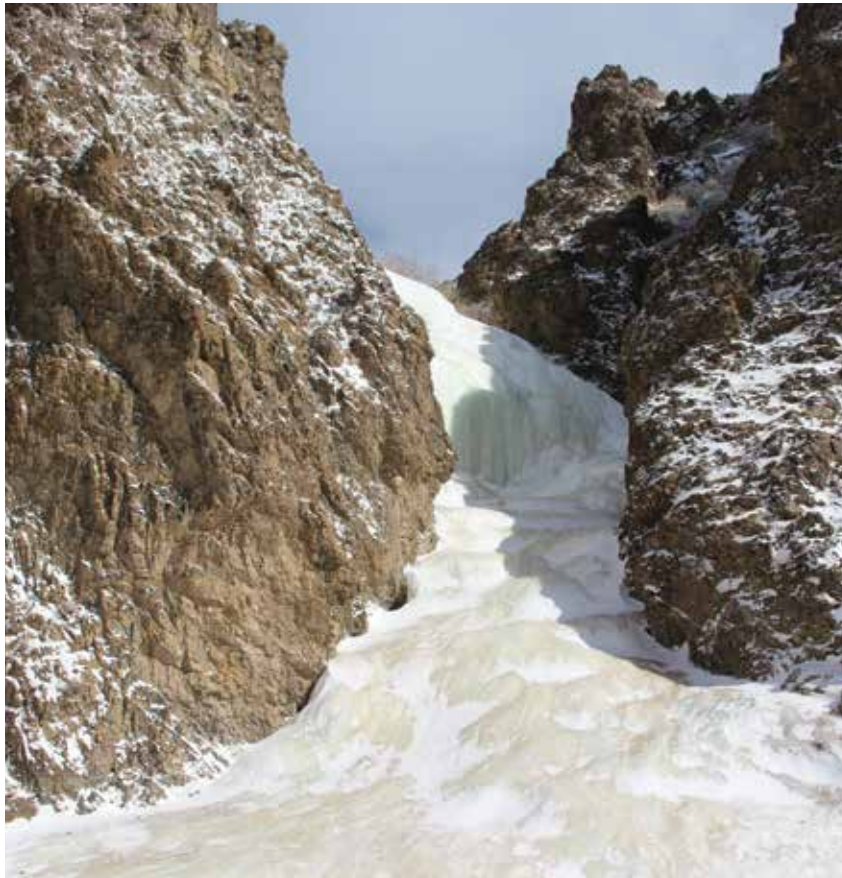
Gefrorener Wasserfall in der Omnogovi-Provinz