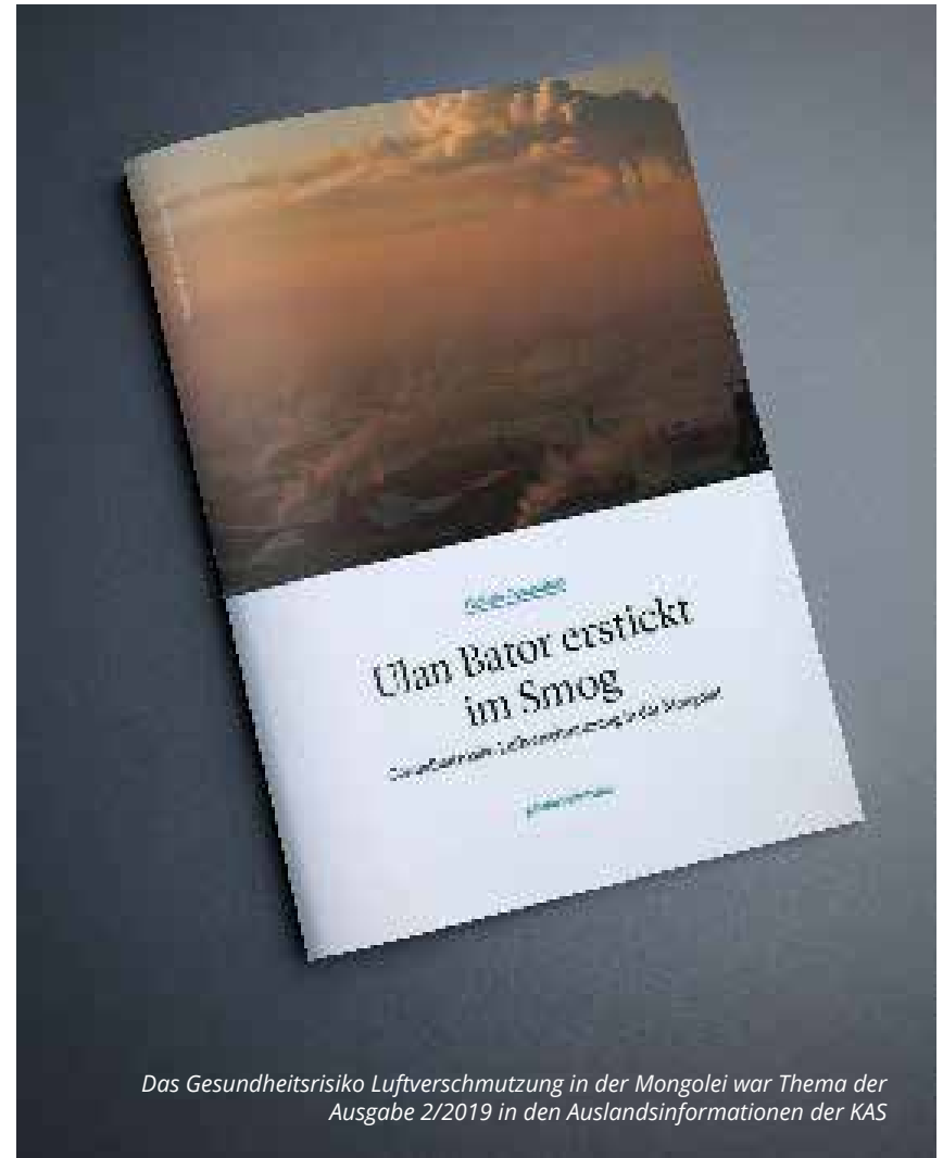
Das Gesundheitsrisiko Luftverschmutzung in der Mongolei war Thema der Ausgabe 2/2019 in den Auslandsinformationen der KAS