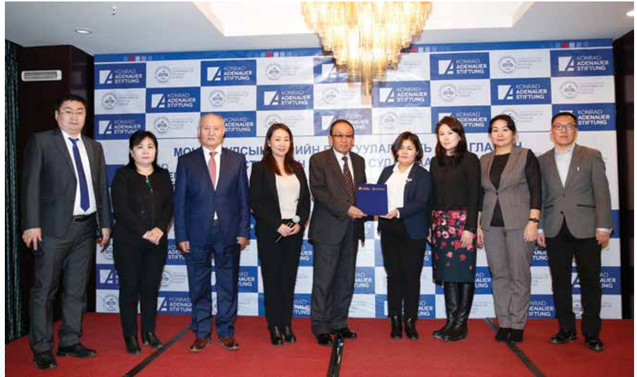
Übergabe der Studie an den Parlamentarischen Ausschuss für Staatsaufbau