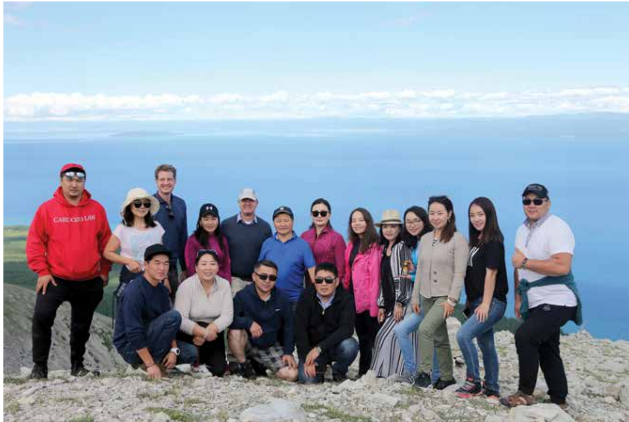
Premierminister a.D. Altankhuyag (Mitte, blaues Hemd) posiert mit den Teilnehmern am Khuvsgul-See