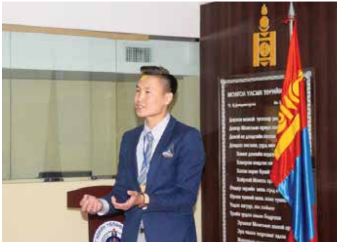
Redner während der Vorrunde des Rhetorikwettbewerbs