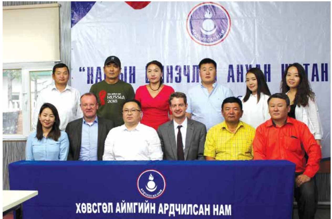
Mitarbeiter der KAS mit Lokal- und Landespolitikern der Khuvsgul-Provinz

In Murun, der Hauptstadt der Khuvsgul-Provinz, trafen Vertreter der KAS mit Lokal- und Landespolitikern zusammen, um über neue Formate für eine bürgernahe Politik und politische Nachwuchsförderung zu beraten. Hierbei stand der Einfluss sozialer Medien auf die Debattenkultur im Mittelpunkt der Diskussion. Darüber hinaus wurden die Chancen der Nutzung der neuen Medien für die Politikvermittlung erörtert. Daneben waren die politische Bildung in der Mongolei sowie die Parteienfinanzierung weitere wichtige Gesprächsthemen.