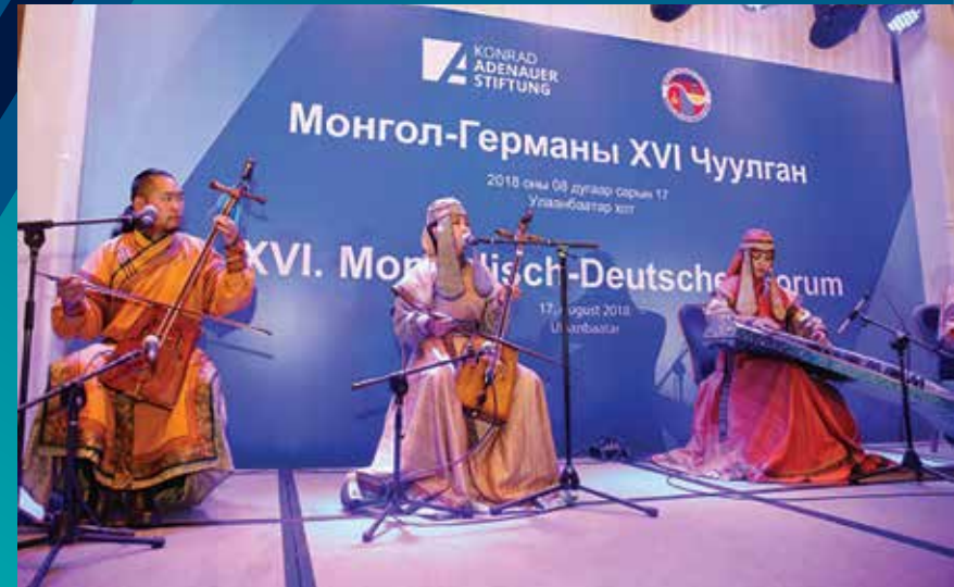
25-jähriges Jubiläum der KAS in der Mongolei

Das Auslandsbüro der KAS in Ulaanbaatar wurde auf Einladung der mongolischen Regierung bereits 1993 eröffnet. Damit war die KAS als erste deutsche politische Stiftung mit einem eigenen Auslandsmitarbeiter in der Mongolei vertreten. Im Jahr 2018 wurde im Rahmen des Deutsch-Mongolischen Forums das 25. Jubiläum der KAS in der Mongolei gefeiert. Mit ihren Projekten und Maßnahmen unterstützt die Stiftung somit nahezu von Beginn an die vor 30 Jahren begonnene Transformation der Mongolei von einem sozialistischen Staat hin zu einer stabilen Demokratie.