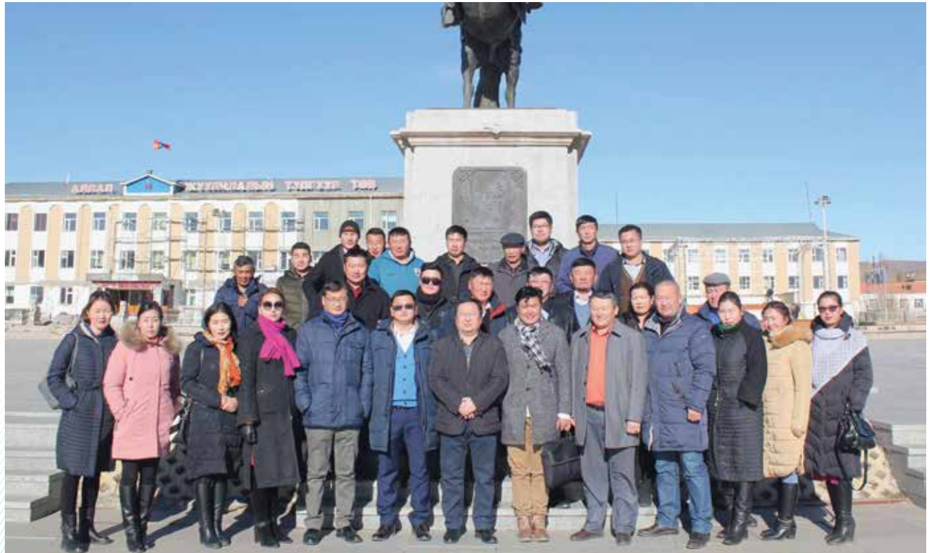
Gruppenbild im Zentrum von Murun, Hauptstadt der nördlichen Khuvsgul-Provinz

Parteiorganisation, Wahlkampfstrategien sowie Öffentlichkeitsarbeit waren die Hauptthemen des Seminars zur bürgernahen Politik, das die KAS in Kooperation mit der Akademie für Politische Bildung in Murun, Khuvsgul-Provinz, durchgeführt hat. Die rund 50 Teilnehmer, mehrheitlich lokale Entscheidungsträger, konnten ihr erlerntes Wissen u.a. zu Marketing- und PR-Strategien sowie zur Mobilisierung von Wählergruppen in praxisorientierten Gruppenarbeiten und Rollenspielen vertiefen.