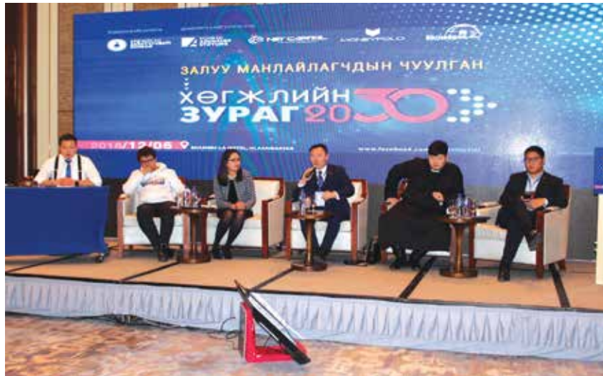
Während der Paneldiskussion tauschten sich die Diskutanten über ihre Zukunftsvision 2030 aus

Nach dem Vorbild des Deutschlandtages der Jungen Union fand im Dezember 2018 erstmals der Mongoleitag der Jungen DP statt. Zu den rund 350 Gästen zählten u.a. der Parteivorsitzende der DP Erdene, Premierminister a.D. Amarjargal, der Parlamentsabgeordnete Erdenebat sowie der Generalsekretär der DP Tuvaan. Auf dem Mongoleitag wurde über die Zukunftsvision 2030 der jungen Generation diskutiert und ein Strategiepapier verabschiedet, das eine nachhaltige Wirtschaftsentwicklung im Sinne der UN-Entwicklungsziele einfordert. Ende des Jahres 2019 soll erneut ein Mongoleitag stattfinden, um den Austausch zwischen der DP und ihrer Jugendorganisation weiter zu vertiefen.