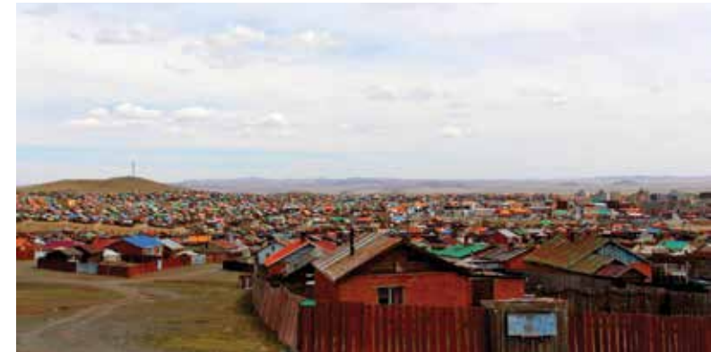
Blick über die bunten Dächer von Arvaikheer