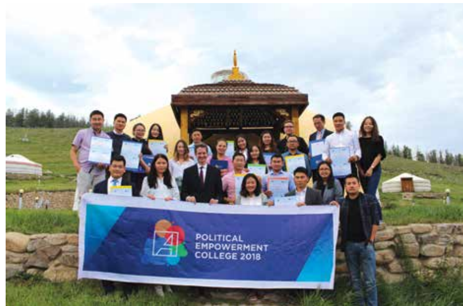
Gemeinsames Abschlussfoto des KASPEC-Jahrgangs 2018

21 junge Menschen nahmen am KAS Political Empowerment College 2018 teil. Erstmals wurde ein zehntägiges Onlineseminar mit den Teilnehmern im Vorfeld der Veranstaltung durchgeführt. Themenschwerpunkte waren u.a. die Menschenwürde sowie die Rolle der Parteien in einer Demokratie. Das nächste KAS Political Empowerment College wird Ende August 2019 durchgeführt. Zu den Referenten zählen u.a. der ehemalige Justizminister der Mongolei Timujiin sowie die stellvertretende Vorsitzende der DP Narantuya.