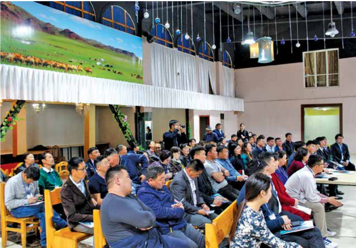
Mitglieder der DP beim Workshop der KAS