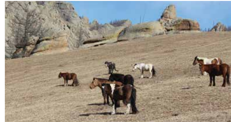
Pferde im Terelj-Nationalpark

Ein Blick auf die Berufsbiographien erfolgreicher Führungspersönlichkeiten in der Mongolei verdeutlicht, wie wichtig Kontakte, institutionelle Förderung und vor allem Mentoringbeziehungen für den Verlauf von Karrieren sind. Genau hier setzt das Frauenprogramm der KAS an, dessen Auftaktveranstaltung für das Jahr 2019 im Terelj-Nationalpark stattfand. Erneut wurden 21 Frauen aus den zahlreichen Bewerbungen ausgewählt, um an dem mehrmonatigen Programm teilzunehmen. Vorträge und Gruppenarbeiten dienten dazu, einander kennenzulernen und unterschiedliche Problemfelder im Bereich der Gleichberechtigung zu beleuchten sowie persönliche Erfahrungen auszutauschen.