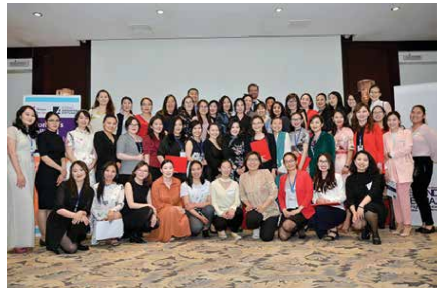
Der Abschlussjahrgang 2019

Die Abschlussveranstaltung des Women's Political Leadership Program fand Anfang Juni 2019 statt und markierte den Endpunkt des diesjährigen Programms. Während eines Zeitraums von drei Monaten wurde den Teilnehmerinnen Wissen zu Menschenrechten, Rechtsstaatlichkeit, Grundzügen der Demokratie, Gleichberechtigung und zur persönlichen Entwicklung vermittelt. Seit 2015 gibt es über 100 Absolventinnen des Programms, die mittlerweile untereinander ein starkes Netzwerk geschaffen haben.