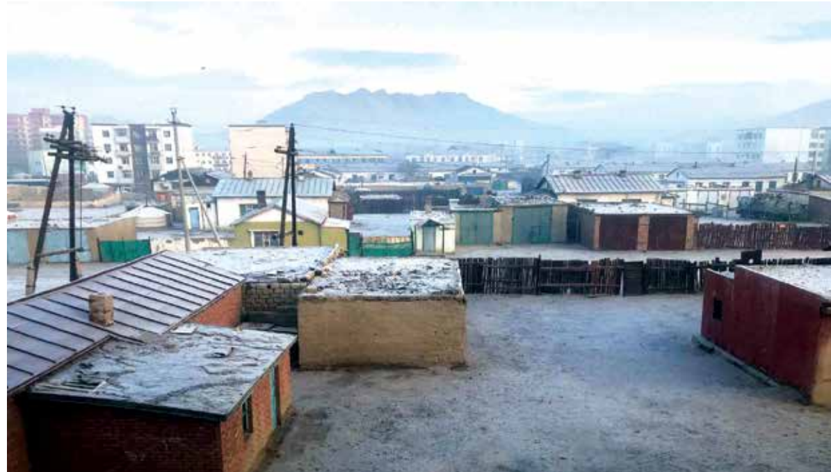
Blick auf das Zentrum der Khovd-Provinz