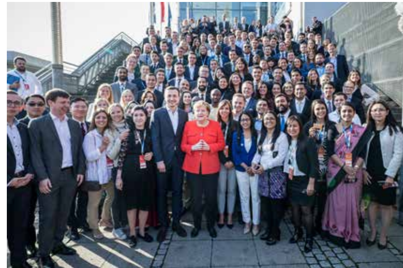
Gruppenbild mit Bundeskanzlerin Dr. Angela Merkel