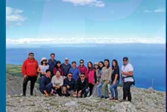
Konferenz zur Rohstoffpolitik in der Khuvsgul-Provinz