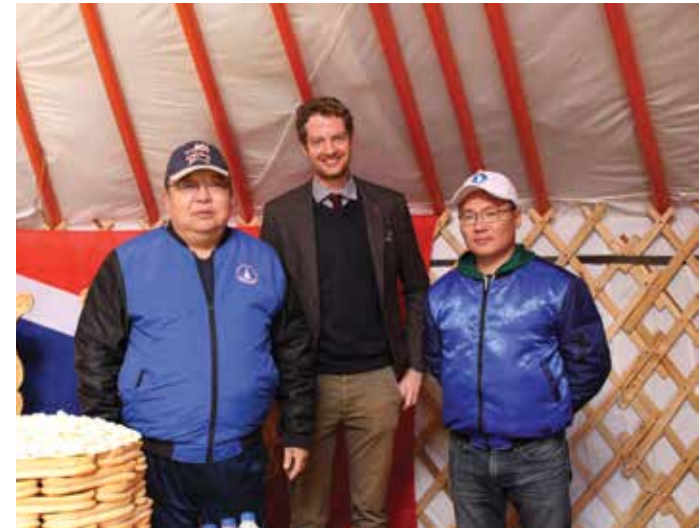
Der DP- Vorsitzende der DP Erdene (links) und der Vorsitzende der Jungen DP Erdenebold (rechts) beraten sich mit der KAS zum neuen Parteiprogramm