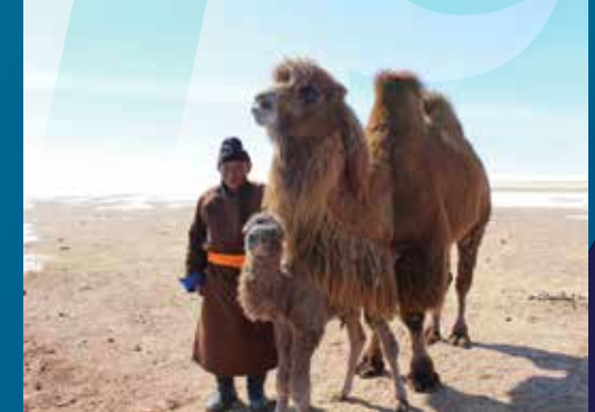
Kamelnomade in der Wüste Gobi

Gemeinsam mit unserer Partnerpartei, der Demokratischen Partei (DP) , leisten wir einen Beitrag zur Stabilisierung des demokratischen Systems und bilden Nachwuchspolitiker aus. Dabei arbeitet die KAS auch mit den Vereinigungen bzw. Sonderorganisationen der DP zusammen. Hierzu zählen die Frauen Union der DP, die Junge DP sowie der Studierendenverband der Partei.