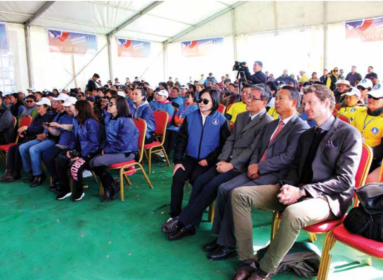
Teilnehmer des Regionalkongresses vor den Toren Ulaanbaatars