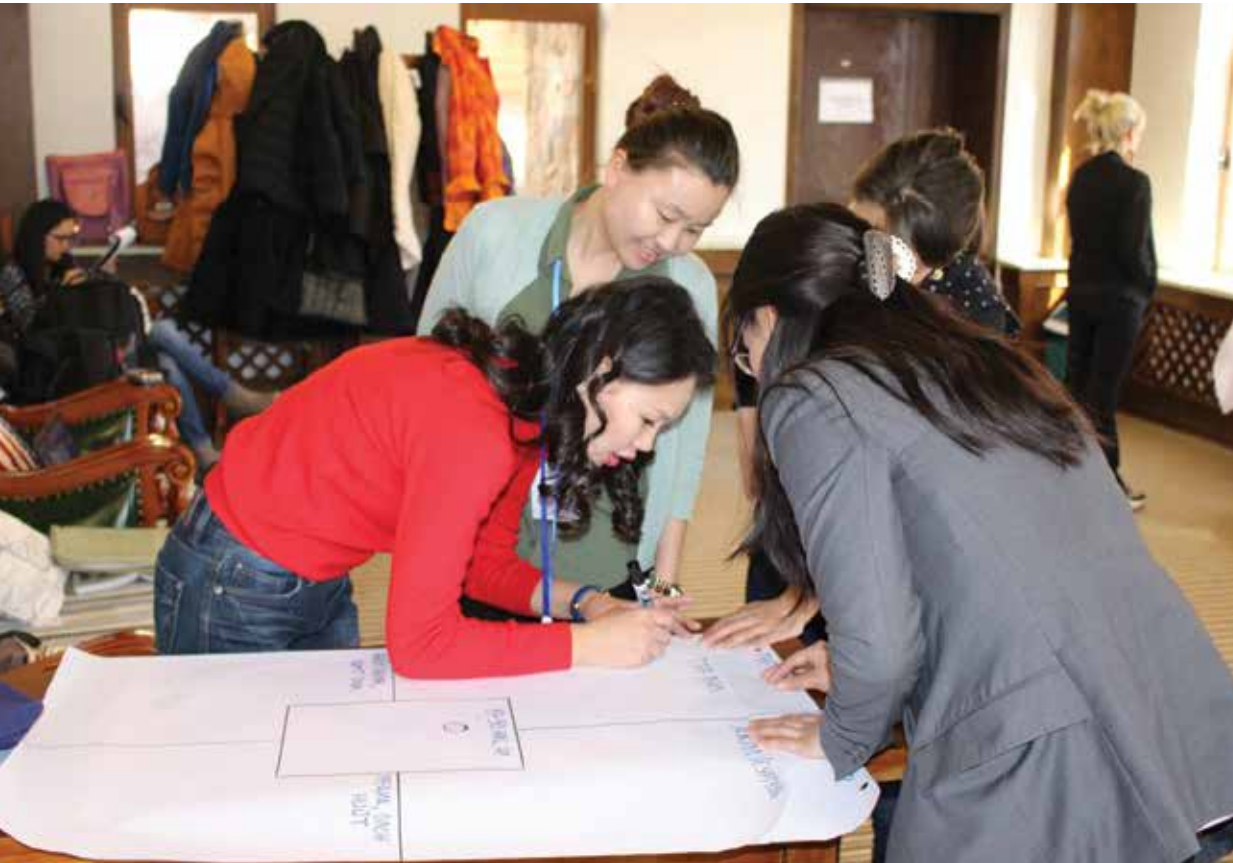
Gruppenarbeit zum Austausch persönlicher Erfahrungen mit gesellschaftlichen Rollenbildern