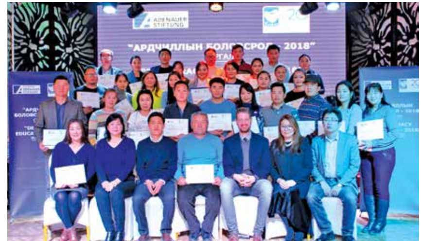
Gruppenbild der Teilnehmer in der Omnogovi-Provinz

In der ganz im Süden der Mongolei gelegenen Omnogovi-Provinz in der Wüste Gobi setzten die KAS und die Zorig-Stiftung ihre Seminarreihe zur politischen Bildung fort. Rund 50 junge Menschen nahmen an der Veranstaltung teil, die sich unterschiedlichen Aspekten der mongolischen Demokratie widmete. Themen waren u.a. die anstehende Verfassungsreform, der Parlamentarismus sowie die Rolle der Medien in der Demokratie.