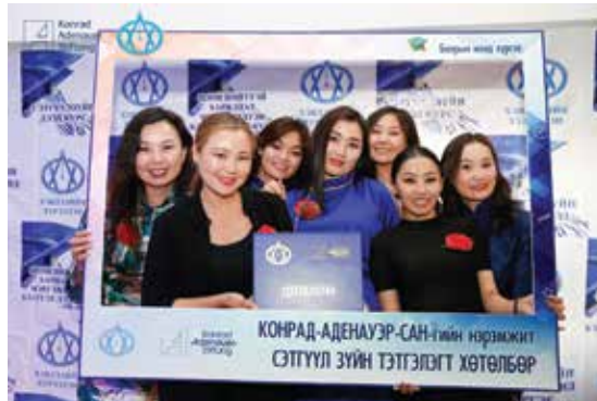
Absolventinnen der KAS School for Journalism 2018

Die Abschlussveranstaltung der KAS School for Journalism 2018 fand in Ulaanbaatar statt. Insgesamt 24 Teilnehmer des Programms konnten ihre Zertifikate entgegennehmen. Die besten Absolventen erhielten die Möglichkeit, ihre aktuellen Reportagen und Berichte vor ihren Freunden und Familien vorzustellen. Als besonderen Ausdruck ihres Dankes schenkten die Teilnehmer dem Team der KAS eine künstlerisch dekorierte Torte.