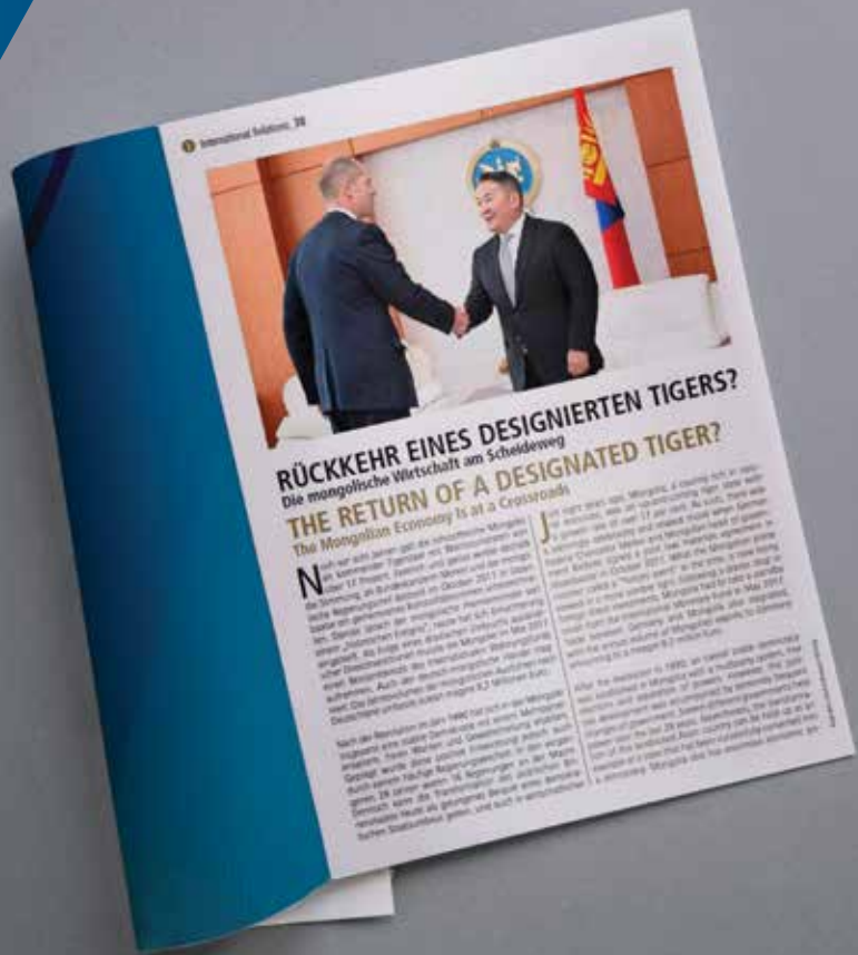
Mit einem Namensartikel machten wir im April 2019 auf die aktuellen wirtschaftlichen Entwicklungen der Mongolei im Diplomatischen Magazin aufmerksam