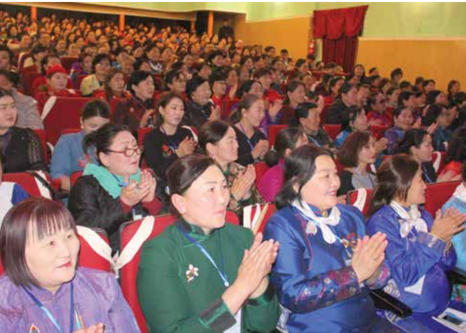
Die Teilnehmerinnen in der ersten Reihe trugen die traditionelle mongolische Tracht, sogenannte Deels

Mongolischer Volkstanz in traditioneller Tracht ▶