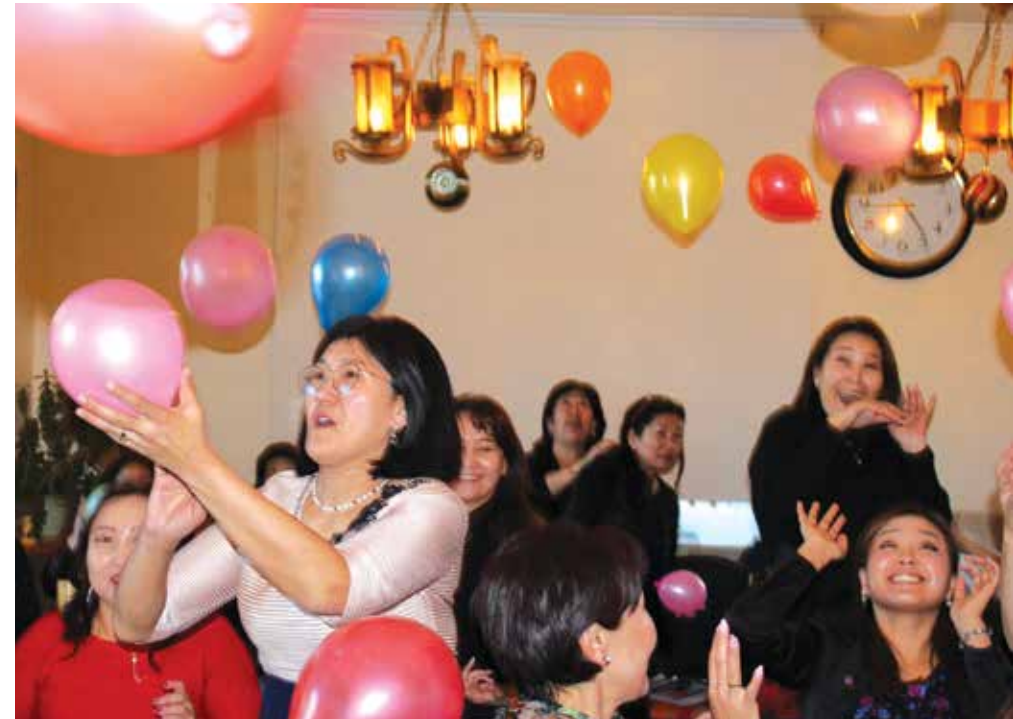
◀ Gruppenbild am Veranstaltungsort im Terelj-Nationalpark