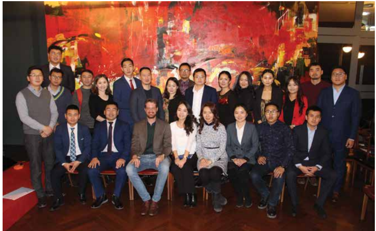
Alumni des KASPEC-Programms der vergangenen drei Jahrgänge

Über die Frage der Einführung eines Politikunterrichts in mongolischen Schulen diskutierten die Alumni des KAS Political Empowerment College bei ihrem Jahrestreffen 2018. In Form von Vorträgen präsentierten die Absolventen ihre Ideen und Gedanken zur Vermittlung von politischer Bildung, wobei sie auch Vergleiche zu den Systemen und Erfahrungen im internationalen Kontext, etwa in Deutschland und den USA, heranzogen. In der anschließenden Podiumsdiskussion entwickelte sich ein lebhafter Austausch. Einig waren sich die Teilnehmer darin, dass das Ziel der politischen Mündigkeit der Bürger nur durch das Zusammenspiel unterschiedlicher Akteure zu erreichen sei. Ab 2019 sollen die Alumni Vorschläge für eigene Projekte bei der KAS einbringen können. Der beste Projektvorschlag soll dann in Kooperation mit der KAS umgesetzt werden.