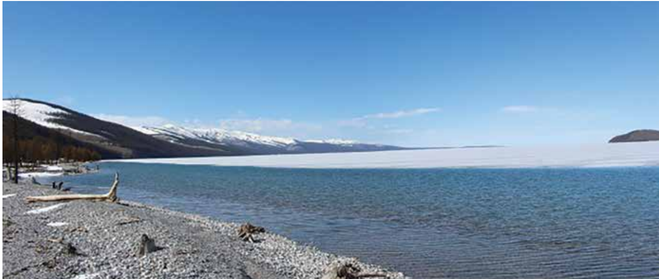
Ufer des im Mai immer noch teilweise zugefrorenen Khuvsgul-Sees