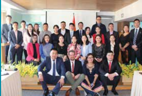
Rural Environmental Fellowship Programm 2018