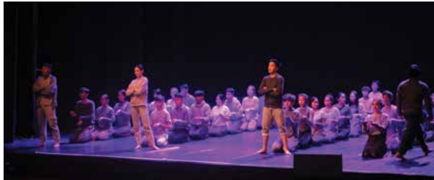
Die drei Anführer mit verschränkten Armen symbolisieren die Westmächte, von denen sich der Anführer der Sowjetunion (rechts) abkehrt

Nach weniger als zwei Wochen Training fand am 18. Mai die eindrucksvolle Aufführung des Tanzprojekts zur Berliner Luftbrücke statt, welches die Schüler unter der Leitung des Choreographen Volker Eisenach einstudiert hatten. Mehr als 600 Zuschauer und zahlreiche Medienvertreter verfolgten die Aufführung. Mit einer Fotoausstellung im Eingangsbereich und kurzen Dokumentarfilmen wurde die historische Bedeutung der Luftbrücke näher beleuchtet. Besonders die Geschichte der sogenannten Rosinenbomber stieß auf das Interesse der Kinder. Die Aufführung fand im Rahmen der Feierlichkeiten des 45. Jubiläums der diplomatischen Beziehungen zwischen der BRD und der Mongolei statt.