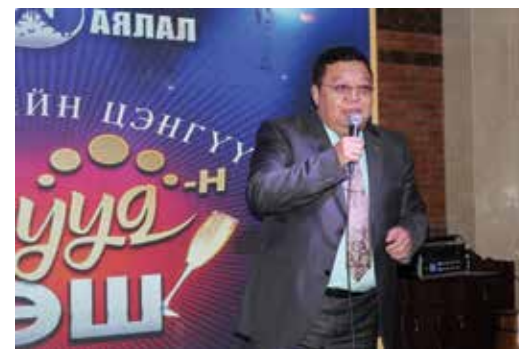
Der Parteivorsitzende der DP Erdene