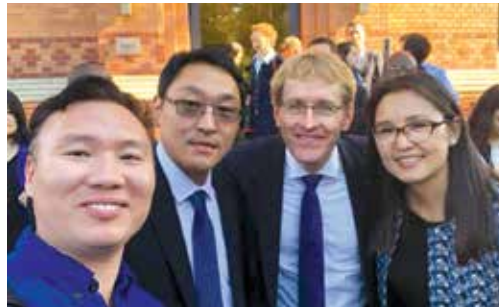
Die mongolischen Teilnehmer trafen den Ministerpräsidenten des Landes Schleswig-Holstein Daniel Günther

Anlässlich des Deutschlandtages der Jungen Union am 5. und 6. Oktober 2018 reiste eine dreiköpfige Delegation der Jungen DP aus der Mongolei nach Deutschland, um sich über moderne Wahlkampfmethoden auszutauschen und sich über die inhaltliche Zusammenarbeit der Nachwuchsorganisation mit den Mutterparteien (CDU und CSU) zu informieren. Die mongolische Delegation traf u.a. zu Gesprächen mit dem Präsidenten des Deutschen Bundestages Dr. Wolfgang Schäuble sowie mit dem Ministerpräsidenten des Landes Schleswig-Holstein Daniel Günther zusammen. Der Deutschlandtag der Jungen Union stand dieses Jahr unter dem Motto „Deutschland 2030: Fester Kurs und klare Koordinaten“ und wurde von Paul Ziemiak MdB, Vorsitzender der Jungen Union, eröffnet. Zu den hochrangigsten Rednern gehörten Bundeskanzlerin Dr. Angela Merkel und Bundesgesundheitsminister Jens Spahn MdB.