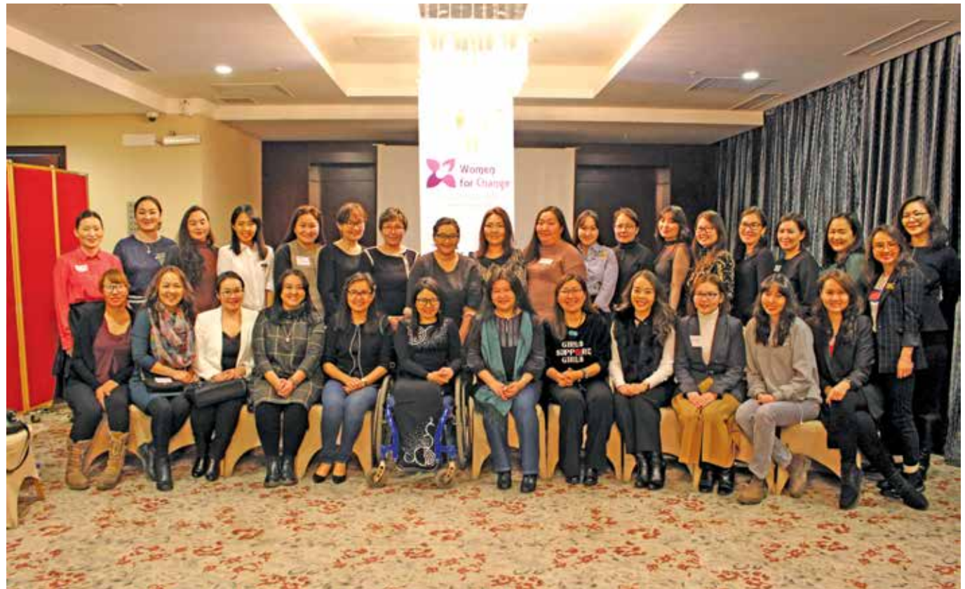
Alumni-Treffen im Dezember 2018

Unter dem Motto der Stärkung des Frauennetzwerks der KAS fand die Jahresversammlung des Alumni-Netzwerks des Women's Political Leadership Program statt. Zum vierten Mal absolvierten im Jahr 2018 junge Frauen das Programm, das auf die Aus- und Weiterbildung begabter Frauen in Führungspositionen abzielt. Auf der Jahresversammlung wurde das neue Mentorship Program vorgestellt. Im vergangenen Jahr haben die Absolventinnen des Frauenprogramms eine eigene NGO gegründet, um das durch die KAS erworbene Wissen weiterzugeben. Ein schönes Zeichen für die Nachhaltigkeit unserer Projekte vor Ort!