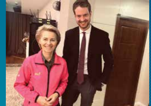
Gespräch mit Bundesministerin Ursula von der Leyen

Durch Publikationen, Videopodcasts, Länderberichte und Analysen informieren wir über aktuelle Entwicklungen in der Mongolei.