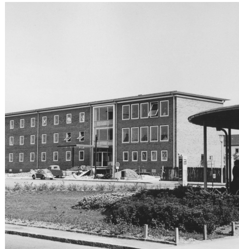
Die Zentrale Erfassungsstelle Salzgitter 1961

MITTWOCH | 20. MÄRZ 2013 | 18.00 UHR | AULA HENNEBERGISCHES GYMNASIUM SCHLEUSINGEN