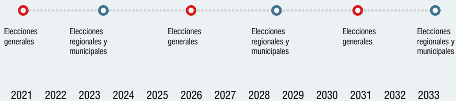
Gráfico N° 2: Cronograma de elecciones generales y elecciones regionales y municipales (propuesta)

Elaboración: Comisión de Alto Nivel para la Reforma Política (CANRP)