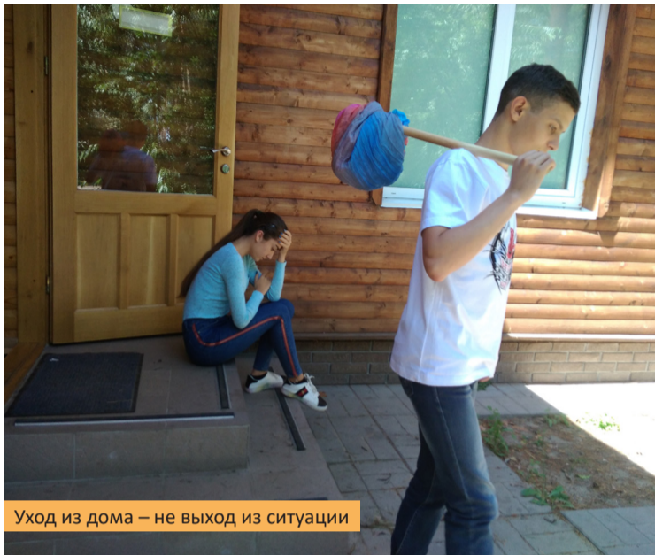
Уход из дома – не выход из ситуации