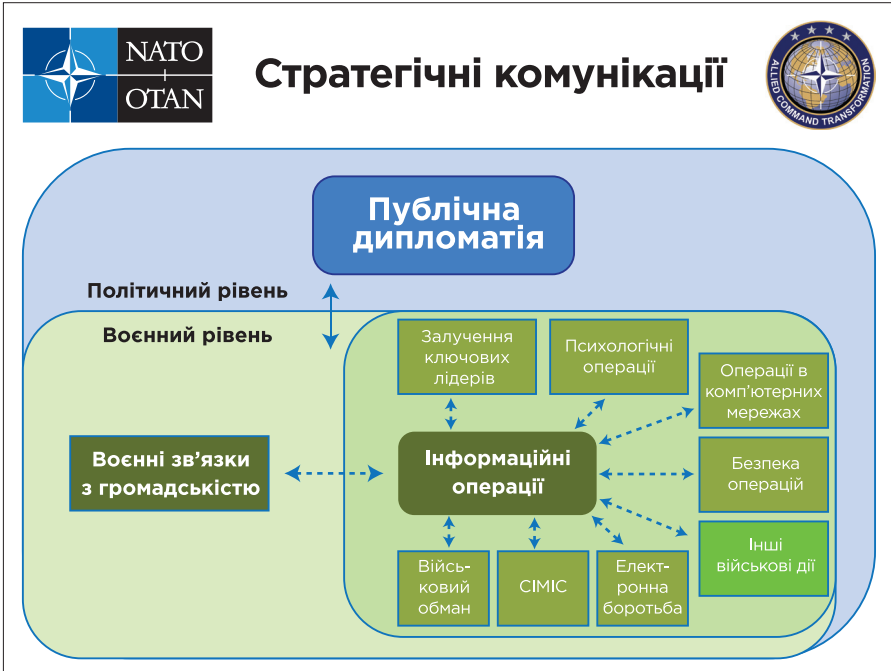
Рис.1. Як працюють стратегічні комунікації в НАТО.

складно, але насправді є дуже простим. Це все – про координацію позицій та здатність говорити «одним голосом». 5 Активний розвиток стратегічних комунікацій в Альянсі розпочався з його операції в Афганістані та був розширений на усю діяльність НАТО.