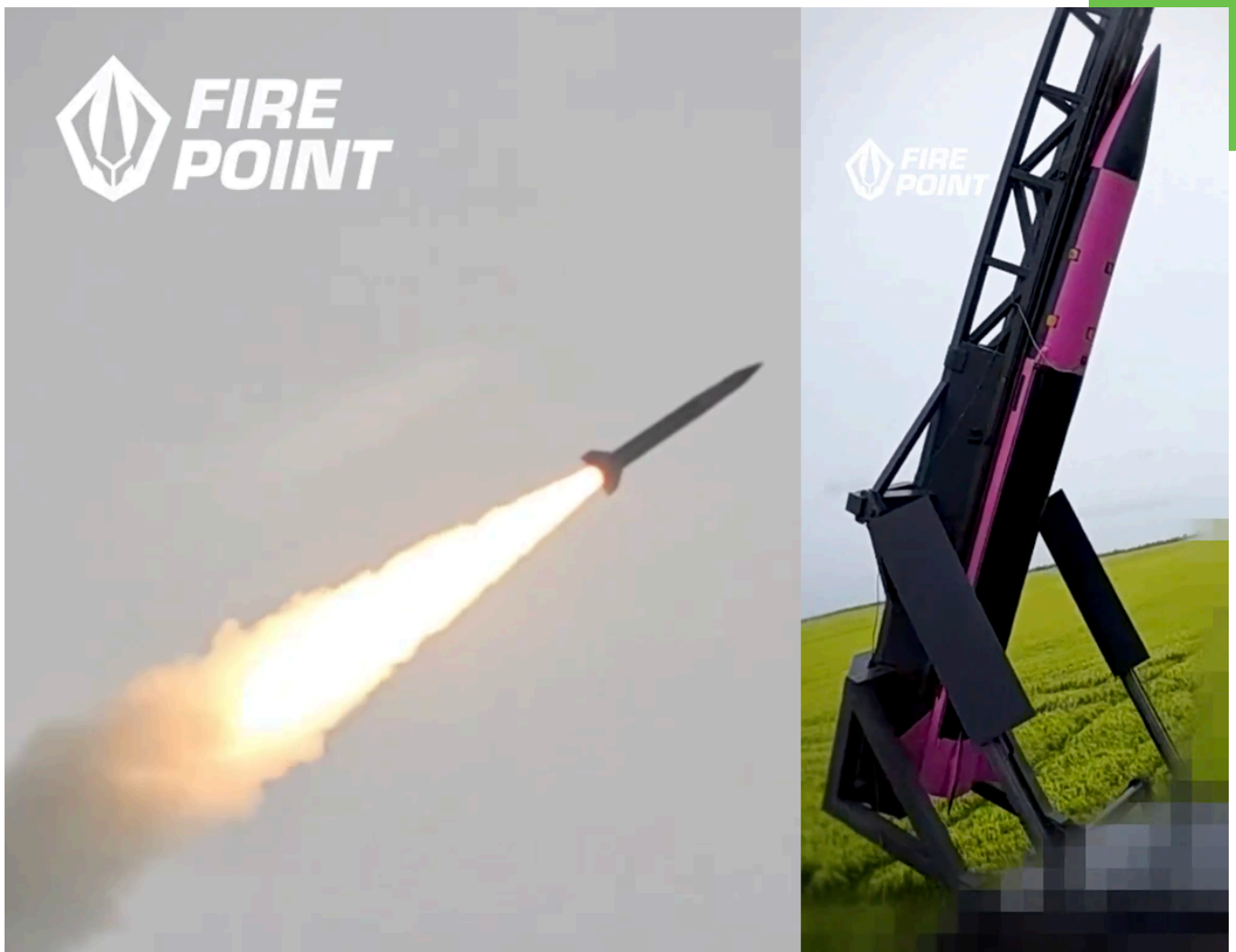
Testflug einer ukrainischen FP-7X-Abfangrakete, die zur Abwehr von ballistischen Raketen entwickelt wird.

Die fortlaufende Weiterentwicklung russischer Waffensysteme macht deutlich, dass dieser Krieg über den Abnutzungskampf hinaus zunehmend als technologischer Wettlauf zu verstehen ist. Für Europa ergibt sich daraus die Notwendigkeit, Innovations-, Beschaffungs- und Anpassungszyklen deutlich zu beschleunigen. Die Fähigkeit, neue Technologien schnell in einsatzreife militärische Fähigkeiten zu überführen, dürfte künftig zu den entscheidenden Faktoren europäischer Abschreckungs- und Verteidigungsfähigkeit zählen. Ebenso dürften Kosten-Nutzen-Abwägungen zunehmend an Bedeutung gewinnen, wodurch insbesondere die Ukraine