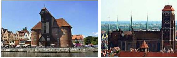
Krantor und Marienkirche