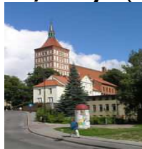
Schloss in Allenstein; St. Jakobus: Konkathedrale des Frauenburger Doms