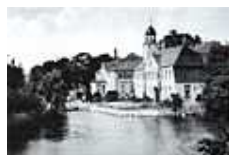
Puttkamersches Wasserschloss Karstnitz um 1900

Zur Geschichte des Stammsitzes der von Puttkamers