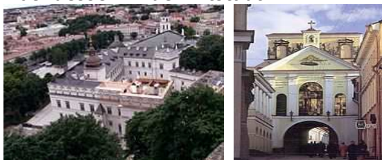
Schloss und Altstadt