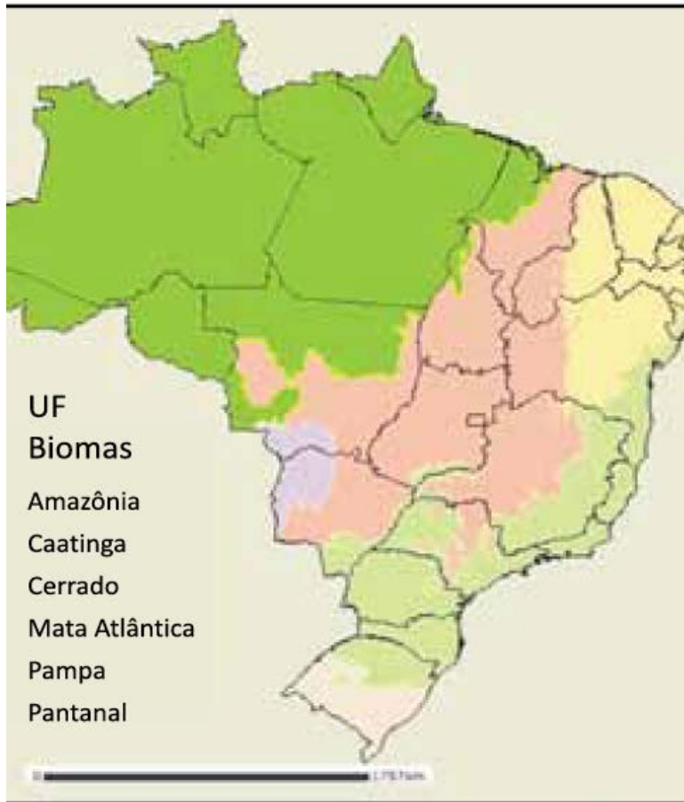
Figura I-1: Mapa dos Biomas Brasileiros.