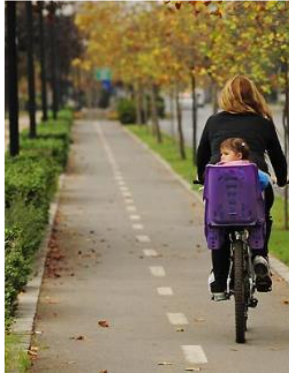
CICLORUTAS 100 km