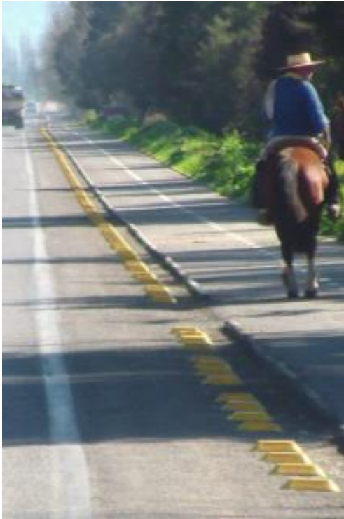
SENDAS MULTIPROPOSITOS 200 km