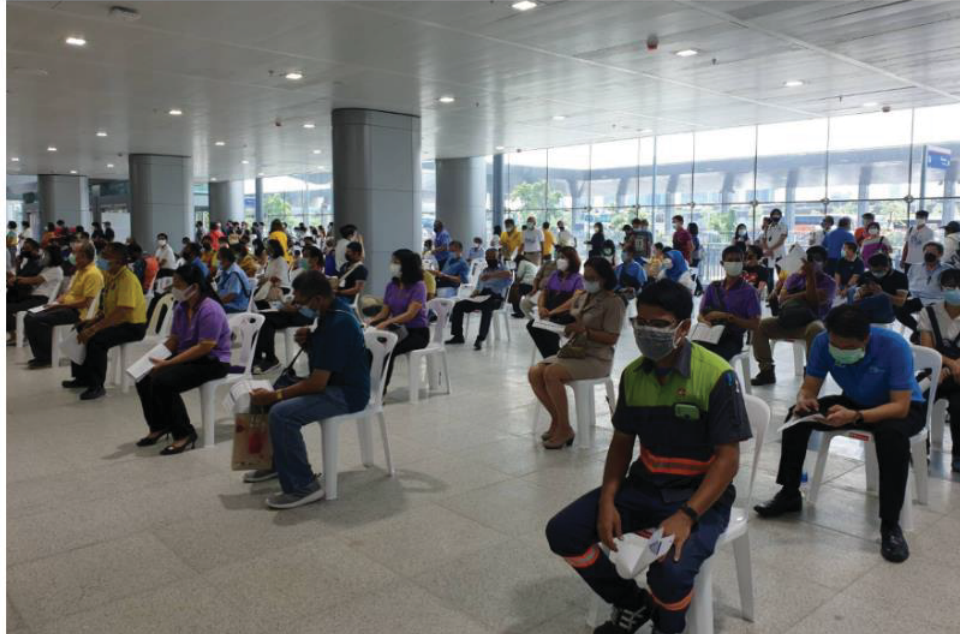
(บรรยากาศประชาชนรอฉีดวัคซีนโควิด-19 ที่ศูนย์ฉีดวัคซีนกลางบางซื่อ ที่สถานีกลางบางซื่อ เมื่อวันที่ 24 พ.ค.2564)

สำหรับไทยควรมีการเสริมศักยภาพในการบริหารจัดการด้านสาธารณสุขทั้งในด้านงบประมาณ หน่วยงาน บุคลากร และองค์ความรู้ เพื่อรับมือกับสถานการณ์การแพร่ระบาดที่มีแนวโน้มเกิดขึ้นในอนาคต