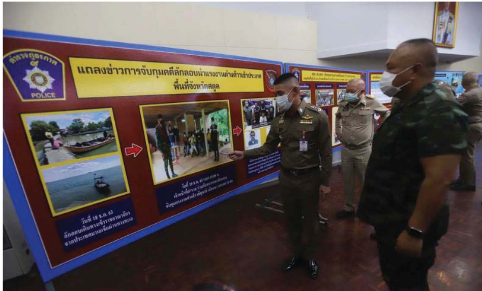
(ศูนย์ปฏิบัติการสำนักงานตำรวจแห่งชาติส่วนหน้า และกองทัพบกที่ 4 แถลงผลการจับกุมแรงงานต่างด้าวหลบหนีเข้าเมือง เมื่อวันที่ 22 ม.ค. 2564)

ซึ่งไทยควรสร้างความเข้มแข็งให้กับชุมชนชายแดนเพื่อเฝ้าระวังขบวนการนำพาแรงงานผิดกฎหมาย รวมถึงการลดขั้นตอนและลดค่าธรรมเนียม เพื่ออำนวยความสะดวกให้แรงงานจากประเทศรอบบ้านเข้าประเทศไทยผ่านช่องทางจุดผ่านแดนให้มากขึ้น