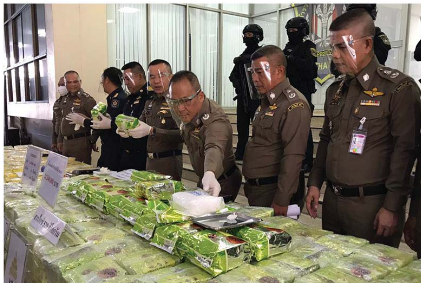
(กองบัญชาการตำรวจปราบปรามยาเสฟติด แถลงผลการจับกุมขบวนการค้าเสฟติด เมื่อวันที่ 3 ก.พ.2564)

เช่น ปัญหาครอบครัว ปัญหาความอ่อนแอทั้งร่างกายและจิตใจของประชาชน ปัญหาอาชญากรรมและการกระทำผิดกฎหมาย เป็นต้น ซึ่งส่งผลต่อความสงบเรียบร้อยและความมั่นคงของประชาชนและของชาติโดยรวม