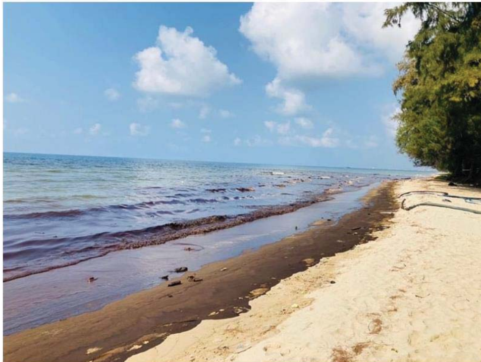
(ภาพคราบน้ำมันตามแนวชายหาดแห่งหนึ่งในพื้นที่ จ.ระยอง ที่ได้รับผลกระทบจากเหตุน้ำมันรั่วไหลบริเวณจุดขนถ่ายน้ำมันในทะเลของ บมจ.สตาร์ปิโตรเลียม รีไฟน์นิ่ง ในช่วงเดือน ก.พ.2565)

รวมทั้งการเสริมสร้างองค์ความรู้และความตระหนักรู้เกี่ยวกับความสำคัญของทะเลอย่างเป็นระบบบนพื้นฐานของข้อมูลเชิงวิชาการ ซึ่งหากมีการจัดตั้งองค์กรจัดการความรู้ทางทะเลในอนาคต จะเป็นส่วนเสริมให้การรักษาความมั่นคงและผลประโยชน์ของชาติทางทะเลเป็นไปอย่างมีประสิทธิภาพมากยิ่งขึ้น