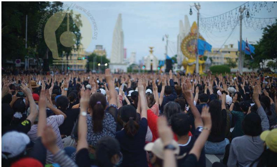
(ภาพการประชุมของกลุ่มที่เรียกตนเองว่า 'ประชาชนปลดแอก' อนุสาวรีย์ประชาธิปไตย เพื่อยื่นยัน 3 ข้อเรียกร้อง 2 จุดยืน และ 1 ความฝัน เมื่อวันที่ 16 ส.ค. 2563)

ทั้งนี้ ในห้วงที่ผ่านมา ประชาชนบางกลุ่มจะขาดความรู้ความเข้าใจเกี่ยวกับบทบาทของสถาบันพระมหากษัตริย์ ส่งผลให้เกิดความขัดแย้งทางความคิดในหมู่ประชาชน และทัศนคติความเห็นต่างเกี่ยวกับสถาบันพระมหากษัตริย์