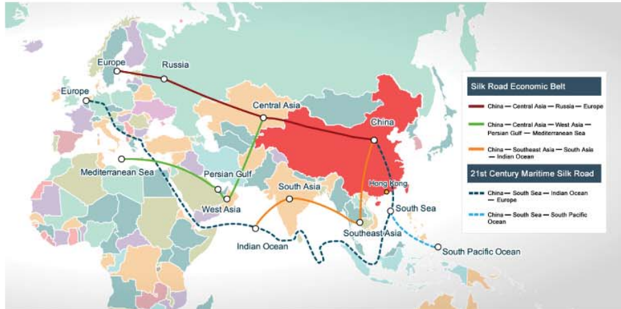
New Silk Road Map

(แนวเส้นทางสายไหมใหม่ตามนโยบาย BRI ของจีน