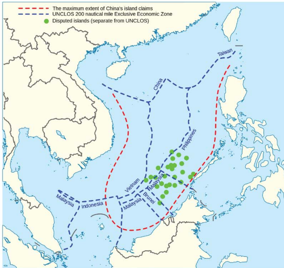
(พื้นที่พิพาททะเลจีนใต้ ที่มาภาพ : wikipedia)

อีกทั้งไทยยังมีแนวโน้มถูกกดดันจากประเทศมหาอำนาจเพื่อขอรับการสนับสนุนเกี่ยวกับการแสดงท่าที หรือการดำเนินกิจการในทะเลจีนใต้ อีกด้วย ดังนั้น ไทยจึงควรแสดงท่าทีต่อการสนับสนุนในการแก้ไขข้อพิพาทของคู่กรณีต่าง ๆ ผ่านกระบวนการสันติและสร้างสรรค์ เพื่อลดความขัดแย้งในบริเวณพื้นที่ทะเลจีนใต้