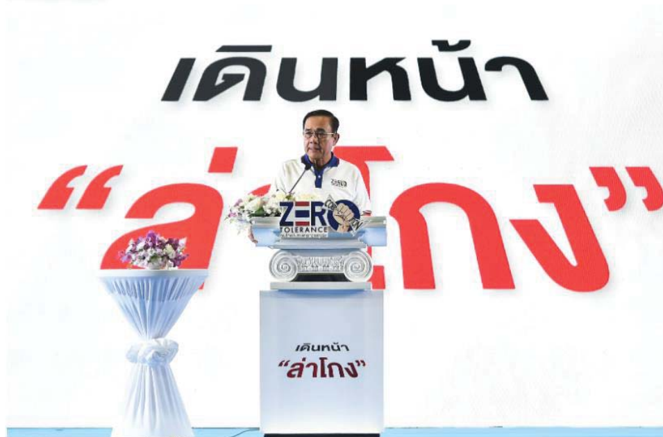
(พล.อ.ประยุทธ์ จันทร์โอชา นายกรัฐมนตรี ประกาศเจตนารมณ์ต่อต้านการทุจริต เนื่องในวันต่อต้านคอร์รัปชันสากล (ประเทศไทย) เมื่อวันที่ 9 ธ.ค.2562)

ส่งผลให้ปัญหาหรือความรุนแรงและซับซ้อนมากยิ่งขึ้น อีกทั้งยังเป็นอุปสรรคสำคัญในการพัฒนาประเทศ ตลอดจนส่งผลต่อความเชื่อมั่นต่อรัฐบาลภาครัฐ และระบอบประชาธิปไตยตามลำดับ