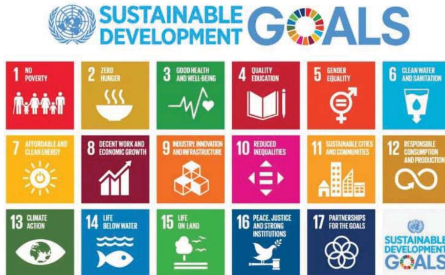
เป้าหมายเพื่อการพัฒนาที่ยั่งยืน (Sustainable Development Goals –SDGs)