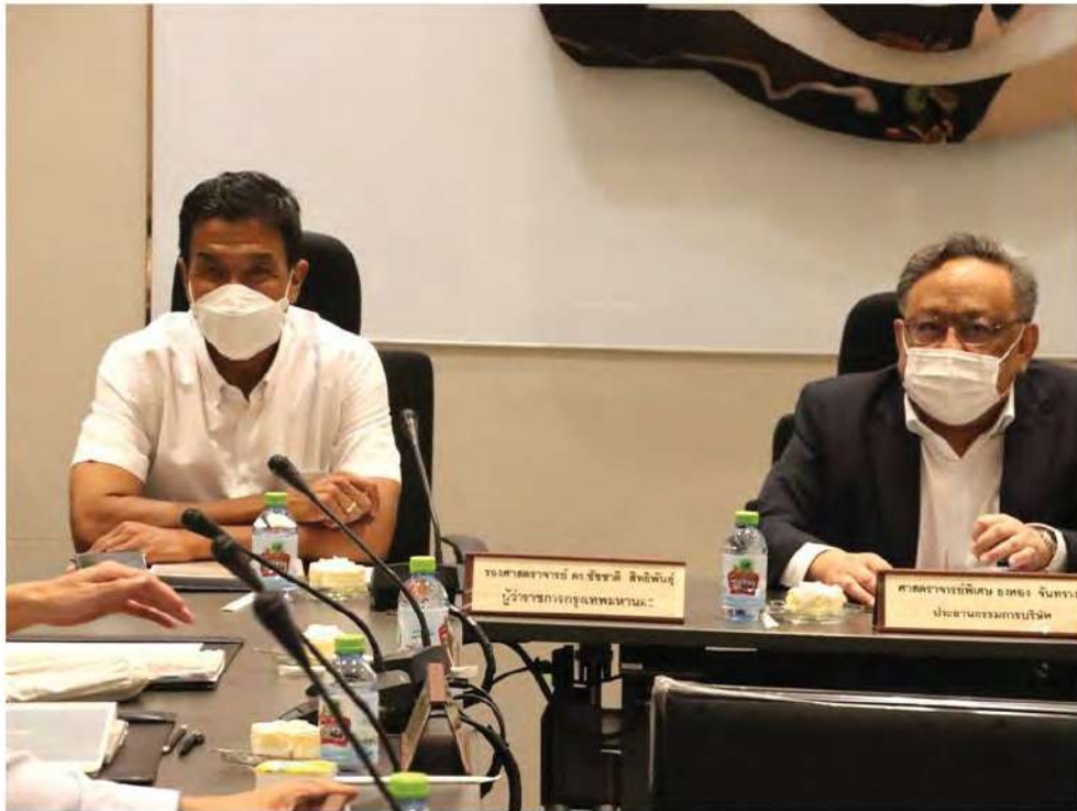
นายชัชชาติ สิทธิพันธุ์ ผู้ว่ากทม. ร่วมประชุมกับคณะกรรมการของ บจ.กรุงเทพมหานคร เมื่อวันที่ 2 ก.ค. 65

แต่ปัจจุบันเวลาผ่านไปผ่านมา 1 ปีแล้ว ปัญหารถไฟฟ้าสายสีเขียว ดูเหมือนจะยังคงหยุดนิ่งสนิทไม่คืบหน้าไปไหน