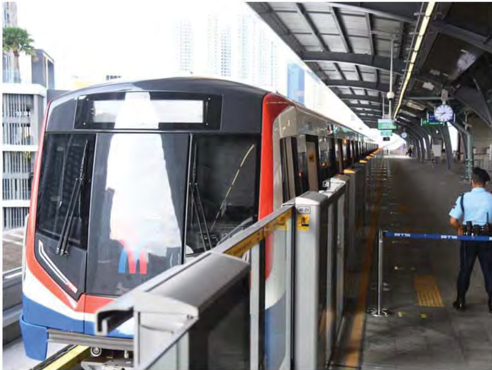
ภาพจาก: กรุงเทพมหานคร (กทม.)

เรียกได้ว่าเป็น 1 ปีของรถไฟฟ้าสายสีเขียวที่ยังยักตื้อติดกัก ยักถักติดกัก