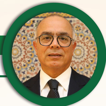
M. Ryad Mezzour

Ministre de l'Education nationale, du Préscolaire et des Sports