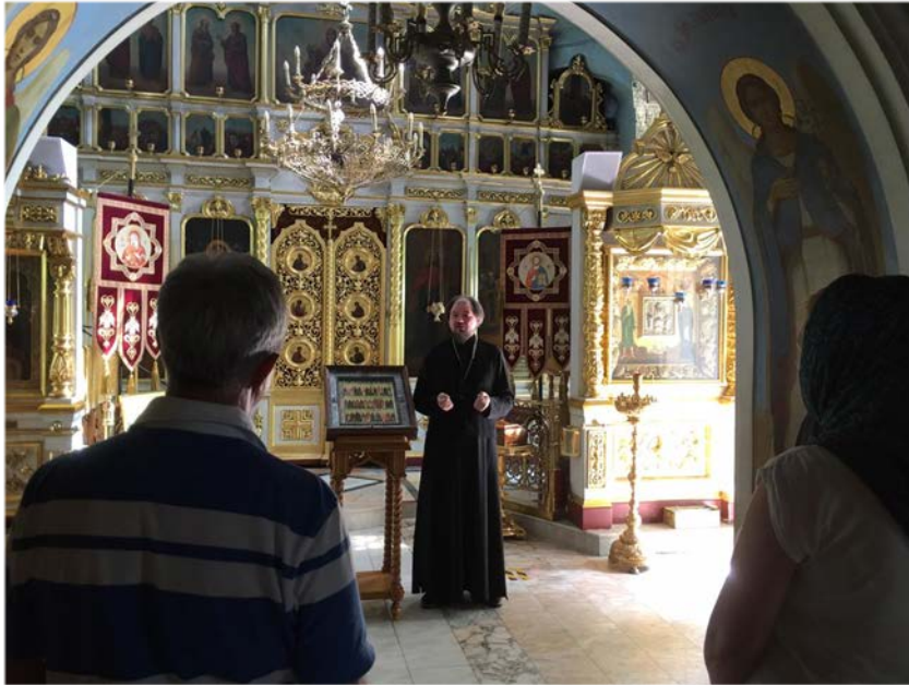
Abbildung 14: Während der internationalen Pilgerfahrt.

Mit dem Segen von Hilarion, dem Metropolit von Wolokolamsk, wurde vom 8. bis zum 13. August eine sechstägige Pilgerfahrt zu Fuß, über 150 km von Moskau zum Kloster der Dreifaltigkeit und des Heiligen Sergius organisiert. Die Organisation fand durch das Pilgerzentrum der Tschernigower Metochi des Patriarchen mit der Unterstützung der Gesamtkirchlichen Aspirantur und Doktorantur „Kyrill und Method“ und des Auslandsbüros KAS in Russland statt.