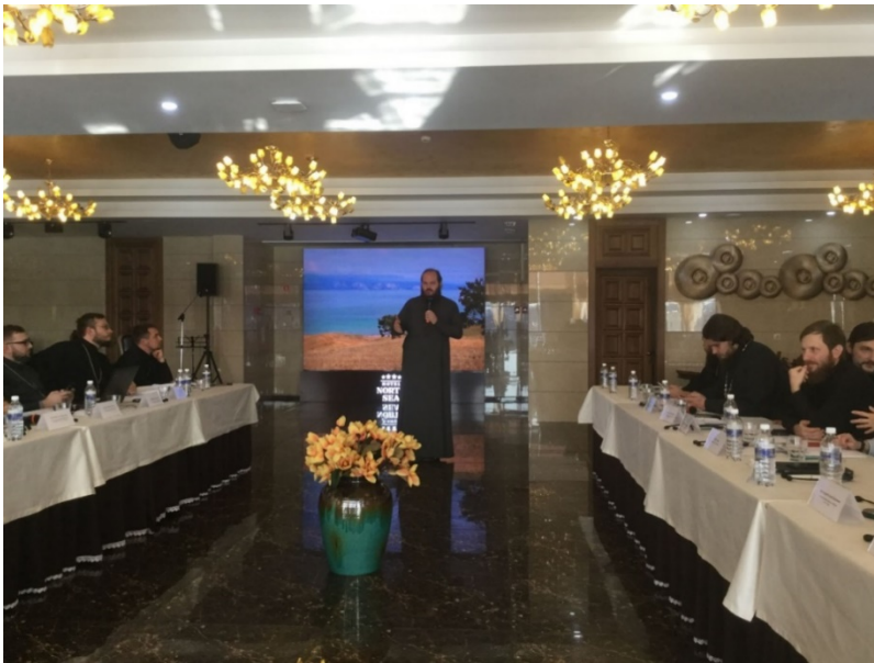
Abbildung 10: Am Rundtisch nahmen russische Geistliche-Videoblogger und Experten für die Arbeit in den sozialen Netzwerken aus Deutschland und Russland.

Am 9. Dezember 2019 fand im Moskauer Haus des Journalisten der Rundtisch «Soziale Netzwerke als Raum für christliches Zeugnis» statt.