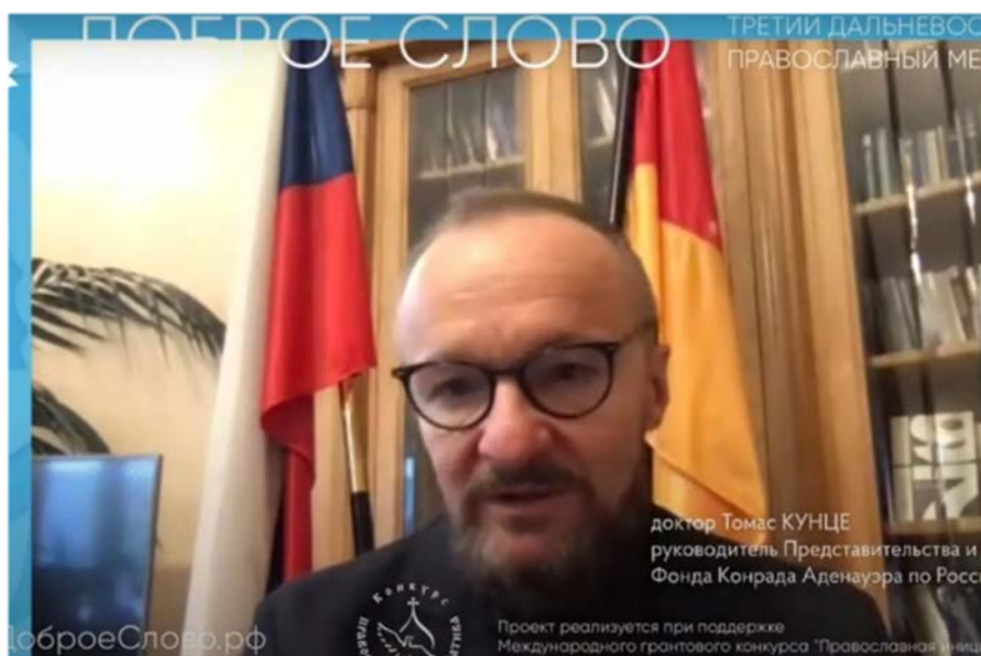
Abbildung 18: Eine Reihe von Rundtischen wurde den Beziehungen zwischen Religion und Gesellschaft, u. a. auf dem Gebiet der Kultur, gewidmet und in Kooperation der KAS mit der Russisch-Orthodoxen Kirche durchgeführt.

Die Konrad-Adenauer-Stiftung, die Gesamtkirchliche Aspirantur und Doktorantur „Kyrill und Method“ der ROK, die Wohlfahrtsstiftung „Posnanije“ („Gnosis“), das orthodoxe Webportal „Jesus“, das Staatliche Moskauer P.-I.-Tschaikowski-Konservatorium, der Moskauer Synodalchor, das Solistenensemble „Wera“ („Der Glaube“), wurden Mitbegründer des schöpferischen Wettbewerbs der ersten Moskauer Biennale der christozentrischen Kunst und des ersten internationalen Wettbewerbs der Komponisten christlicher Kirchenmusik. Die Finale der beiden Wettbewerbe finden 2021 statt. An beiden Wettbewerben sollen 2021 nehmen Kirchenvertreter, christliche und weltlicher Komponisten und Maler aus Russland, Deutschland und aus über dreißig anderen Staaten teilnehmen.