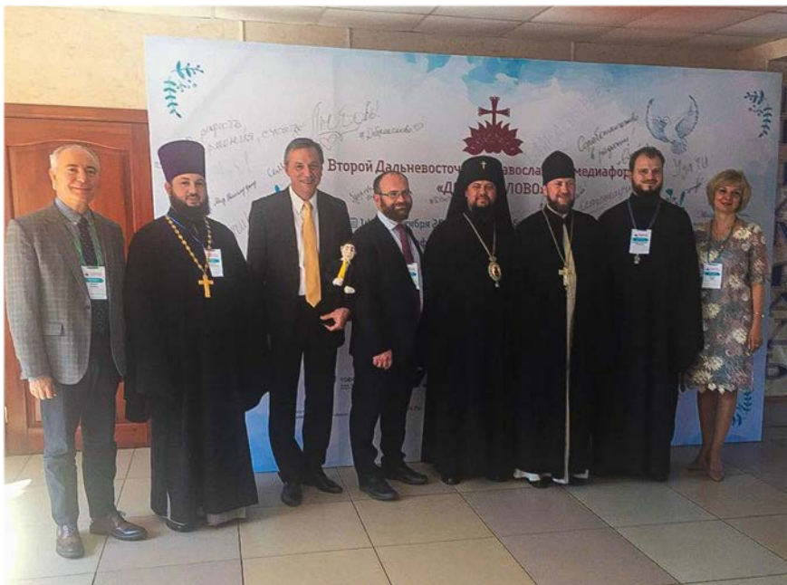
Abbildung 9: Am Mediaforum nahmen Efrem (Prosjanok), Erzbischof von Birobidschan und Kuldur sowie andere Vertreter der ROK, Journalisten, Gebiets- und Stadtverwalter.

Im September 2019 nahm Vertreter des Auslandsbüros der KAS am II. Medienforum der ROK „ Dobroje Slowo “ („Das Gute Wort“) in Birobidschan teil.