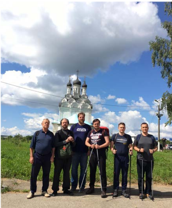
Abbildung 15: Teilnehmer der internationalen Pilgerfahrt.

Die Christliche Kulturwoche fand vom 1. bis 8. September 2020 statt. Diese Veranstaltung wurde zu einem Meilenstein im Bereich der geistlichen und weltlichen Bildung, weil sie die Ansätze der kirchlichen und säkularen Kultur zur Bildung der Gesellschaft und der Entwicklung sozialer Projekte verband. Im Rahmen der Woche der christlichen Kultur wurde eine Reihe von Tagungen und Runtischen durchgeführt, an denen führende Experten auf diesem Gebiet teilnahmen. Im Blickpunkt der Teilnehmer standen u.a. Themen wie: „Die Entwicklung der Ausbildung in den geistlichen Schulen der Russisch-Orthodoxen Kirche als Herausforderung während der Pandemie in Russland“ und „Das Christentum – eine lebendige, für den Dialog und Kulturaustausch offene Kultur, ohne die sich der Bereich der modernen Kultur in der multipolaren Welt nicht entwickeln kann“.