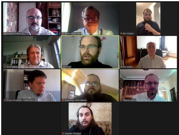
Abbildung 12: Seminar „Christliches Zeugnis unter den Bedingungen der Corona-Pandemie: Erfahrungen und Perspektiven“.

nicht gleichgültig gegenüber, aufgrund dessen diskutierten Experten darüber wie die Gläubigen digital am besten zu erreichen sind. Einige sehen in der aktuellen Situation neue Chancen, allerdings sieht man auch neue Probleme und Herausforderungen, die es vorher nicht gab. Die Konferenz legte den Grundstein zu einer Reihe von Webinaren und Offline-Veranstaltungen, die der Tätigkeit der Kirche unter Verwendung von Errungenschaften auf dem IT-Gebiet gewidmet ist.