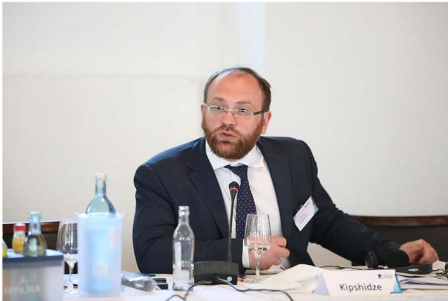
Abbildung 8: Vortrag des stellv. Vorsitzenden der Synodalabteilung des Patriarchats für Beziehungen zwischen Kirche, Gesellschaft und Medien Wachtang Kipschidze auf dem Zukunftsforum

Im September 2019 nahm Vertreter des Auslandsbüros der KAS am II. Medienforum der ROK „ Dobroje Slowo “ („Das Gute Wort“) in Birobidschan teil.