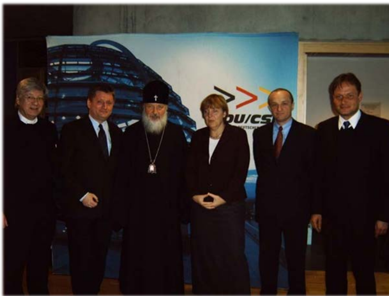
Abbildung 1: Treffen von Metropolit Kyrill und Angela Merkel, Vorsitzende der CDU-Partei Deutschlands, organisiert von der Konrad-Adenauer-Stiftung, 22. Februar 2005.