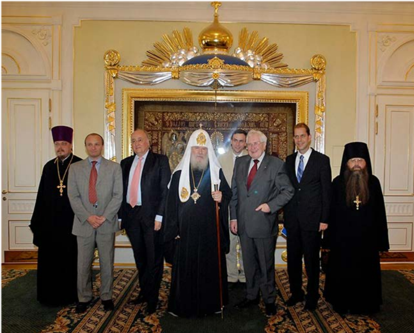
Abbildung 4: Das Treffen des Heiligen Patriarchen Alexius II. mit dem Vorsitzenden der Konrad-Adenauer- Stiftung Prof. Dr. Bernhard Vogel , 30. Mai 2007.

Am 30. Mai 2007 fand im Danilow-Kloster, dem Amtssitz des Patriarchen, ein Treffen des Heiligen Patriarchen Alexius II. mit dem Vorsitzenden der KAS Prof. Bernhard Vogel statt. Es wurden Fragen der Religion in Russland sowie die der interreligiösen Kooperation besprochen.