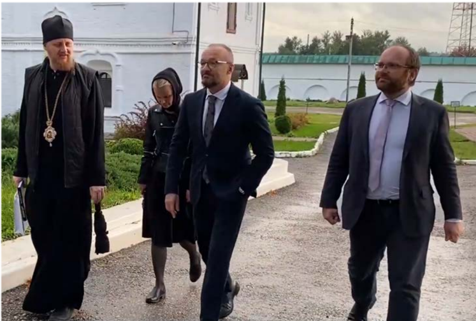
Abbildung 16: Die Konferenz „Betrug im Internet. Herausforderungen für die christliche Präsenz im virtuellen Raum“.