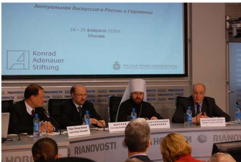
Abbildung 5: Konferenz „Religions- und Werteunterricht an staatlichen Schulen“. 24. Februar 2010

Das KAS-Auslandsbüro Moskau veranstaltete zusammen mit dem Patriarchat der ROK vom 23. – 25. Februar 2010 in Moskau eine interreligiöse Konferenz zum Thema „Religions- und Werteunterricht an staatlichen Schulen“. Die Debatte zur Einführung eines wertebildenden Faches in Form eines orthodoxen Religionsunterrichts an staatlichen Schulen in Russland wurde von der orthodoxen Kirche und dem Präsidenten der