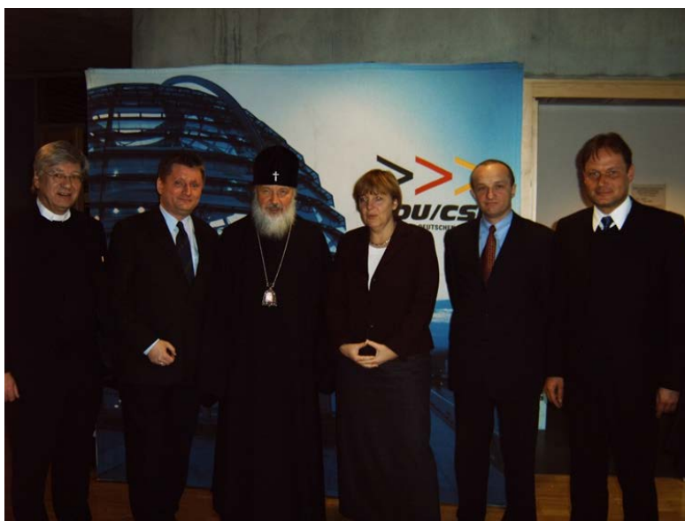
Фото 1: Встреча митрополита Кирилла и Ангелы Меркель, председателя ХДС Германии, организована фондом Конрада Аденауэра, 22 февраля 2005 года.

22 февраля 2005 года состоялась встреча с Ангелой Меркель, председателем Христианско-демократического союза (ХДС) Германии и председателем фракции ХДС/ ХСС в Бундестаге, а также д-ром Вольфгангом Шойбле, заместителем председателя фракции ХДС/ ХСС в Бундестаге. Во время встречи в Бундестаге митрополит Кирилл подчеркнул важность сложившихся отношений между РПЦ МП и христианскими Церквями Германии для развития дружественных связей между народами двух стран.