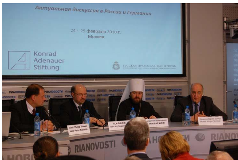
Фото 5. Конференция „Преподавание религии в школе в общественной дискуссии“. 24 февраля 2010 года.

Московское представительство фонда Конрада Аденауэра и Московский Патриархат РПЦ провели 23-25 февраля 2010 года в Москве межрелигиозную конференцию на тему „Преподавание религии в школе в общественной дискуссии“. Дискуссия о введении дополнительной учебной дисциплины «Основы православной культуры» в государственных школах в России была начата православной церковью и Президентом Российской Федерации Дмитрием Медведевым, поскольку назрела необходимость чем-то заполнить возникший после исчезновения государственной идеологии из Конституции и коммунистического воспитания из школ духовный, ценностный вакуум. Фонд Конрада Аденауэра опубликовал отчет о дискуссии по данной проблематике в России и в Германии.