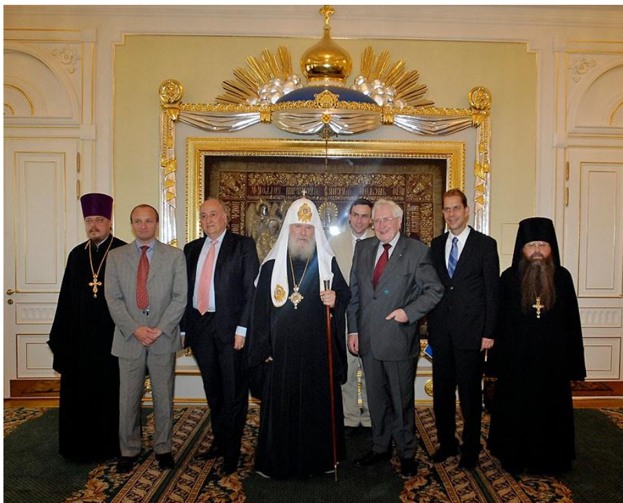
Фото 4: Встреча святейшего Патриарха Московского и всея Руси Алексия II и председателя фонда Конрада Аденауэра проф. Бернхарда Фогеля. 30 мая 2007 года.

30 мая 2007 года в Свято-Даниловом монастыре, патриаршей и синодальной резиденции, прошла встреча Предстоятеля Русской Православной Церкви Алексия II с Председателем Фонда Конрада Аденауэра проф. Бернхардом Фогелем. Обсуждались вопросы религии в России, а также вопросы межконфессионального сотрудничества.