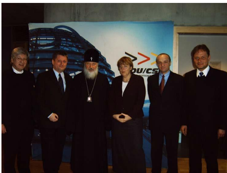
Фото 1. Встреча митрополита Кирилла и Анжелы Меркель, председателя ХДС Германии, организована Фондом Конрада Аденауэра, 22 февраля 2005 года.

22 февраля 2005 года состоялась встреча с Ангелой Меркель, председателем Христианско-демократического союза (ХДС) Германии и председателем фракции ХДС/ ХСС в Бундестаге, а также д-ром Вольфгангом Шойбле, заместителем председателя фракции ХДС/ ХСС в Бундестаге. Во время встречи в Бундестаге митрополит Кирилл подчеркнул важность сложившихся отношений между РПЦ МП и христианскими Церквями Германии для развития дружественных связей между народами двух стран.