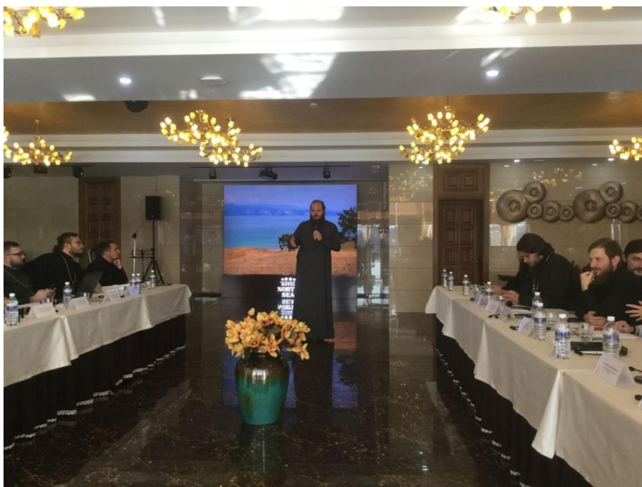
Фото 10. В работе круглого стола участвовали российские священнослужители-videоблогеры и эксперты по работе в социальных сетях из Германии и России.

В октябре 2019 года в Иркутске прошел Российско-немецкий круглый стол « Христианское свидетельство в формате видеоблогинга: текущий статус и перспективы ».