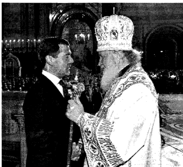
Enger Schulterschluss zwischen Staat und Kirche. Präsident Medwedjew und Patriarch Kirill begegnen sich am 7. Januar in der Moskauer Ernter-Kathedrale zur Feier des orthodoxen Weihnachtstestes.

Russland führt zum 1. April auf Erlass Medwedjews probeweise den Religionsunterricht ein – Experten diskutierten darüber auf Einladung der Konrad-Adenauer-Stiftung