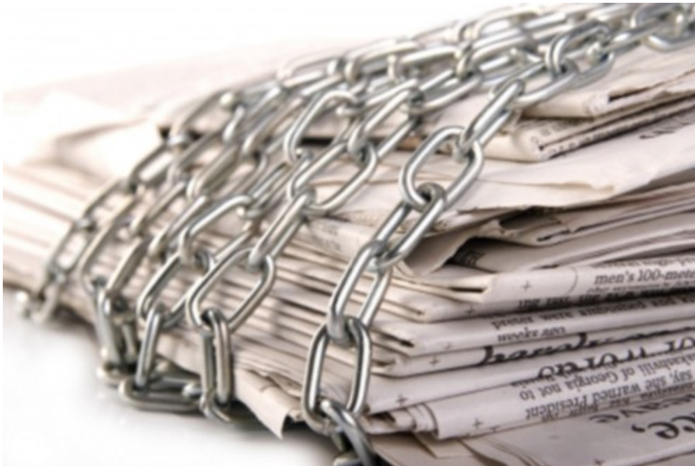
Photo: Media freedom