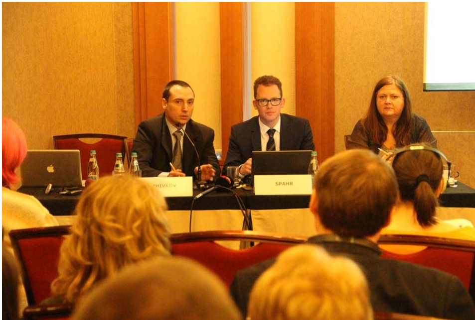
Photo: Press conference speakers, Source: Media Program South East Europe

Author: Center for Independent Journalism