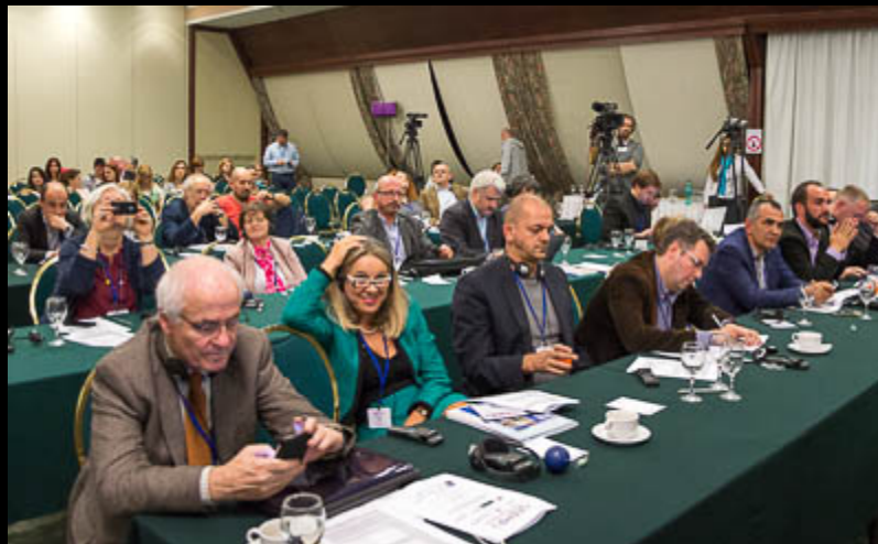
Journalisten aus ganz Europa beim SEEMF 2014