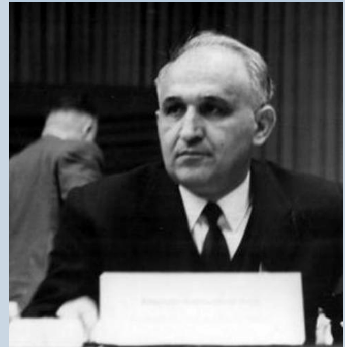
Diktator Todor Schiwkow