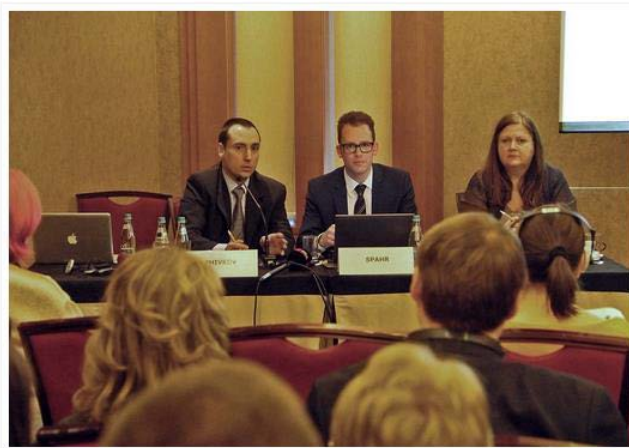
Monitorizare mass-media în 2015: Tendințe în jurnalismul politic în România