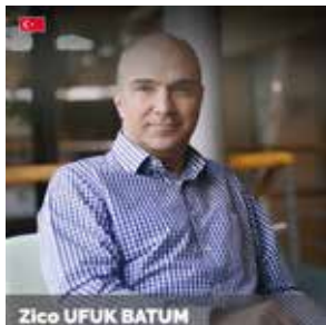
Zico UFUK BATUM