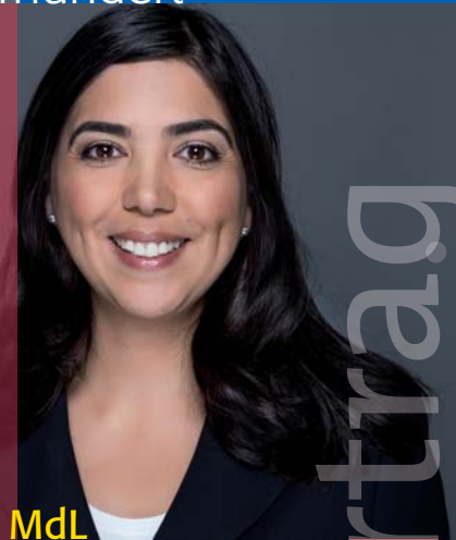
Aygül Özkan M.D. Ministerin a.D.