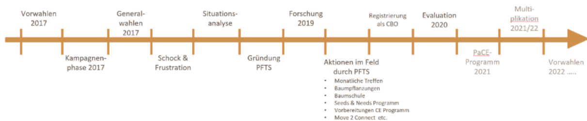
Abbildung 2: Etappen im Demokratisierungsprozess auf der Zeitachse

Die einzelnen Etappen auf dem so initiierten Veränderungsprozess und das darin stattfindende soziale Handeln sollen nun in chronologischer Reihenfolge beschrieben und die darin für die Demokratisierung als relevant erachteten Aspekte explizit herausgestellt werden.