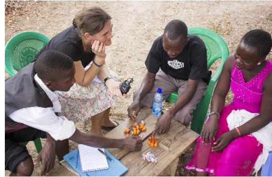
Forschungssetting März 2019

Auffallend an den Interviews, in denen neben offenen Impulsfragen auch projektive Techniken und systemische Aufstellungsfiguren zum Einsatz kamen, war die sehr offene Gesprächsatmosphäre. Trotz des für sie völlig ungewohnten Settings zeigten sich die Befragten aufgeschlossen, interessiert und auskunftsfreudig und meldeten zurück, dass die Tatsache, dass ihnen und diesen Themen eine so große Aufmerksamkeit entgegengebracht werde, die Aussprache über Themen ermögliche, die sonst nicht zur Sprache kämen. Den wenigsten war bis dahin PFTS ein Begriff, das Interesse an ihrer Tätigkeit wuchs durch dieses Forschungsvorhaben allerdings stark an.