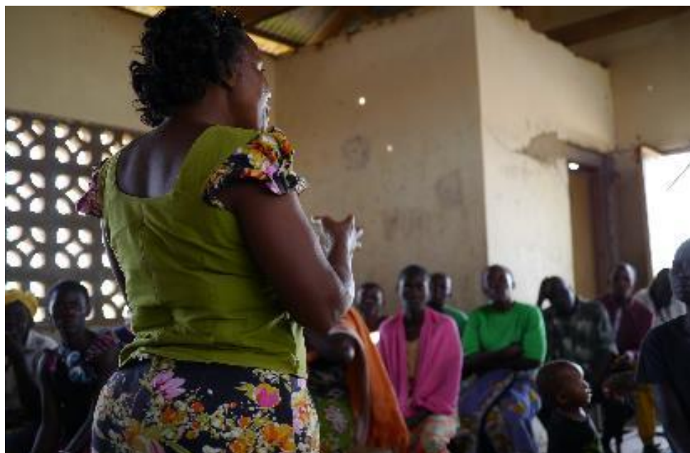
Wahlveranstaltungen in der Kampagnenzeit 2017