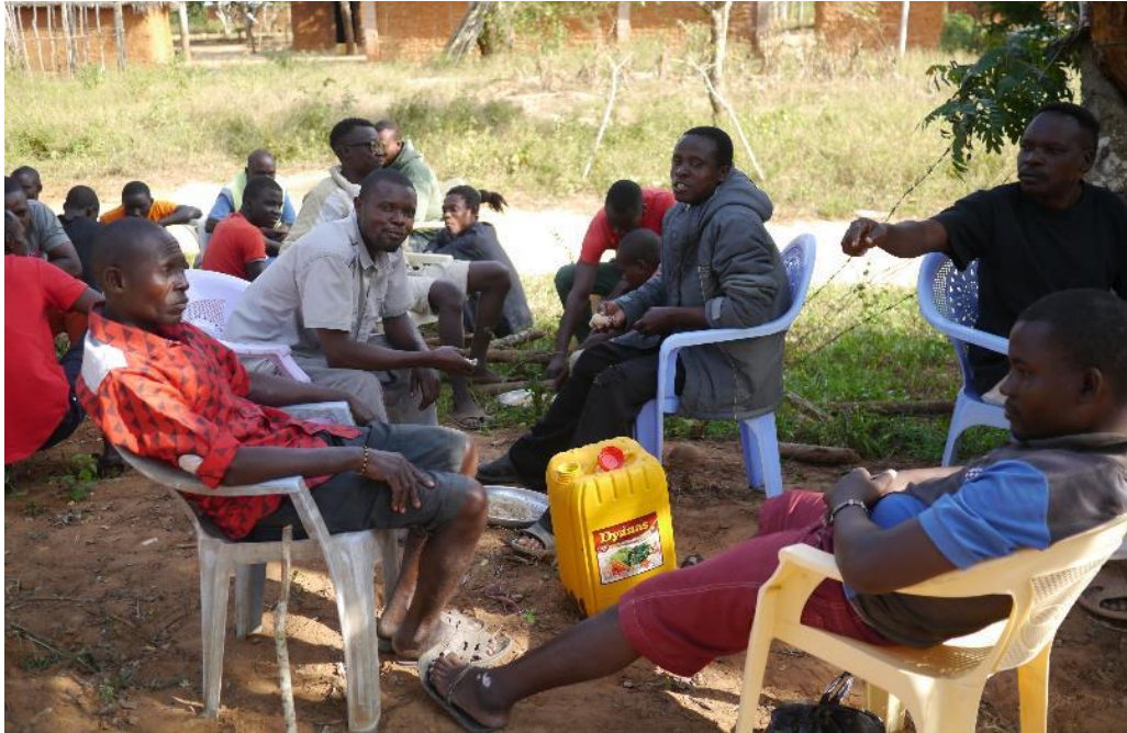
Ratlosigkeit und Enttäuschung im Kampagnenteam, August 2017

In dieser aufgeheizten Stimmung brachten EKB und die als Gast anwesende QMR-Mitarbeiterin auch Methoden des Deep Democracy-Ansatzes zum Einsatz.