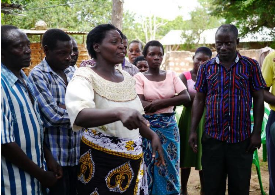
Gruppenprozess mit Rollenwechsel, August 2017

Die Gruppe unternahm den Versuch eines gemeinsamen Ausblicks in die Zukunft mit der Fragestellung, wie man trotz und in dieser Situation gemeinsam weitermachen könne. Da alle Bedürfnisse, die in EKB's Manifesto gesammelt worden waren, auch weiterhin Bestand hatten und die Hoffnung unter den Anwesenden gering war, dass der gewählte MCA seine Wahlversprechungen tatsächlich realisieren würde, diskutierten sie die Option einer Art „Schattenkabinetts“. Dies könne ohne Mandat an der Umsetzung der Themen praxisbezogen weiterarbeiten. EKB sei zwar nicht der MCA in seat, aber der MCA der Tat.