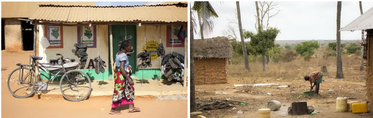
Marafa Ward Alltag

In Zeiten der Corona-Pandemie sind die externen Erwerbsmöglichkeiten größtenteils weggebrochen – dies führte dazu, dass ein stärkerer Fokus auf die Landwirtschaft gerichtet wird. In diesem Ausnahmejahr 2020 zeigten sich die Witterungsbedingungen mit ausreichend Regen- und Sonnentagen relativ günstig, nachdem in den Vorjahren sowohl Dürren als auch zu lange Regenzeiten zu erheblichen Ernteeinbußen geführt hatten.