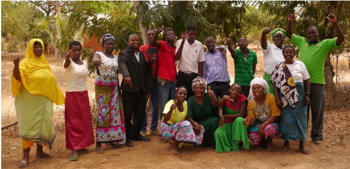
PFTS-Gründungsmitglieder im März 2018

Das ehemalige Kampagnenteam wandelt sich zu einer Gruppe, die politische Bildungsarbeit („Civic Education“) zur Demokratieentwicklung fördern will und übernimmt damit eine neue Rolle und Verantwortung.