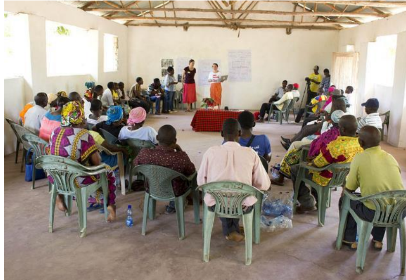
Präsentation und Diskussion der Forschungsergebnisse März 2019