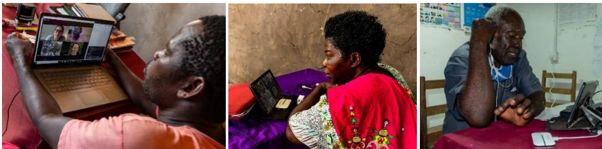
Online-Interviews zur Evaluation im November 2020

Im November 2020 führte QMR zu diesen Fragestellungen insgesamt 21 Interviews mit Bürger*innen aus Marafa Ward, darunter auch 3 Vertretern der lokalen Administration. Aufgrund der Corona-bedingten Reise- und Kontaktbeschränkungen wurden diese jeweils 60 Minuten dauernden Interviews in Form von Online-Gesprächen via Zoom durchgeführt. Ein der englischen, deutschen und lokalen Sprachen mächtiger Dolmetscher übernahm die simultane Übersetzung dieser Gespräche.