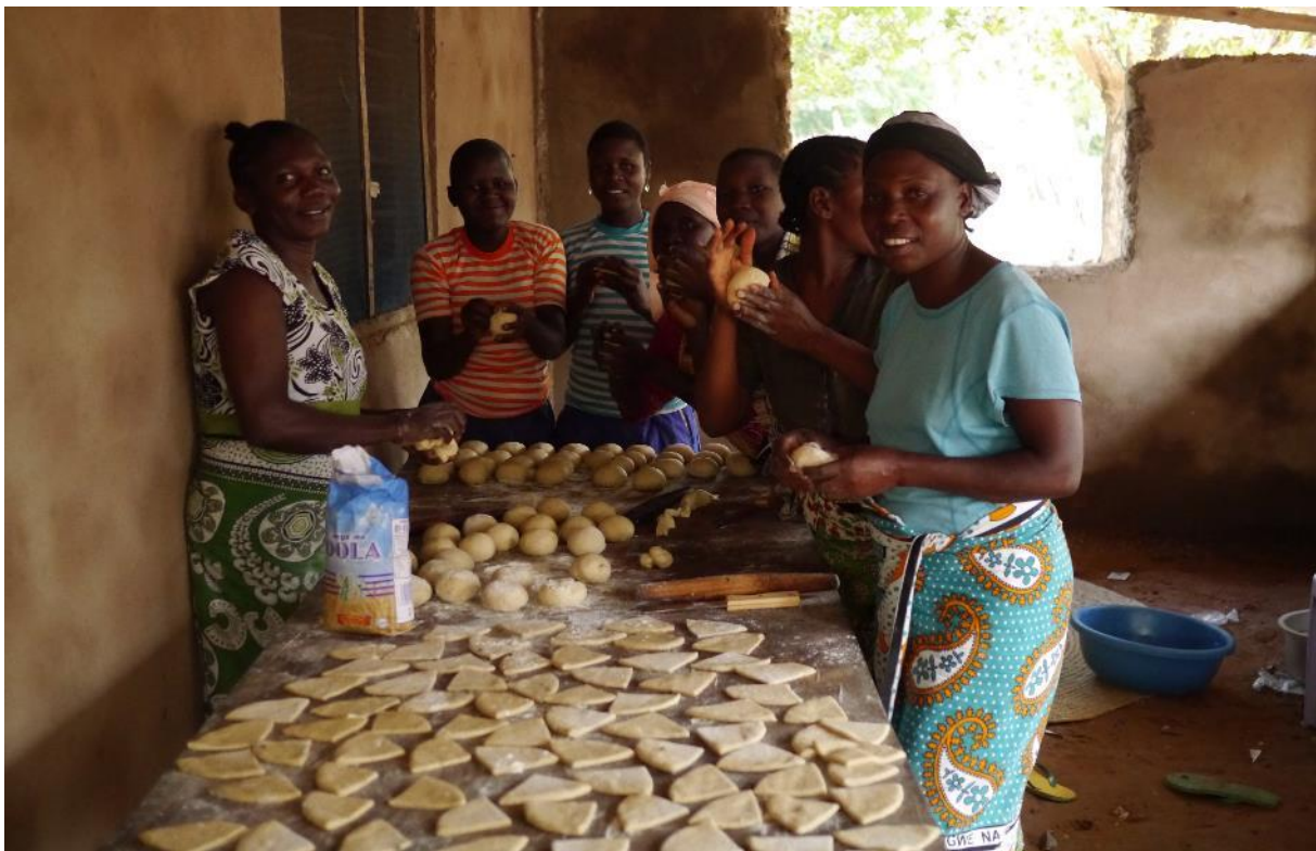
Speisezubereitung am Tag vor der Wahl im August 2017

Schon am Vortag und die ganze Nacht hindurch hatte EKB's Ehefrau mit vielen Frauen aus der Gegend reichlich Speisen vorbereitet, um damit entweder den Wahlsieg zu feiern oder im Falle einer Niederlage - wie sie sich durch Gerüchte ja bereits angekündigt hatte – beieinander zu sein, das „Gesicht zu wahren“ und gemeinsam den Wahlverlauf auszuwerten. Egal wie die Wahl ausgehen würde, so ihre Auffassung, sollte man ein gemeinsames Essen zelebrieren. Genau so – so entschied der engere Kreis um EKB – wolle man es trotz dieser doppelten Enttäuschung nun handhaben.