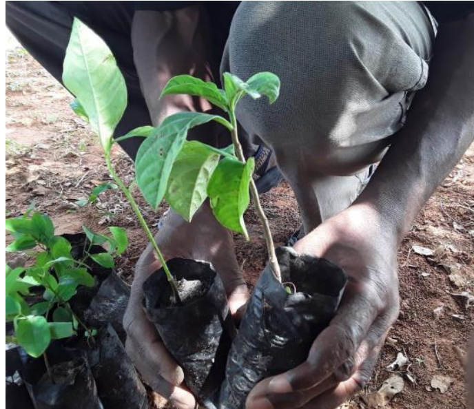
Baumpflanzung und Setzlinge im November 2019