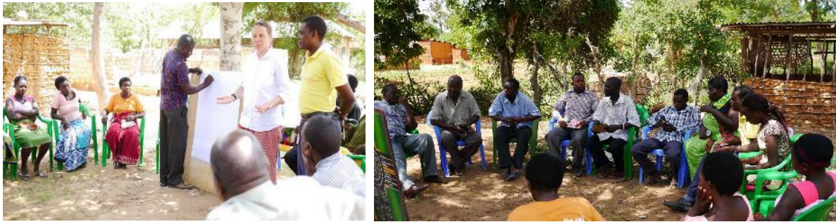
Workshop im Dezember 2017