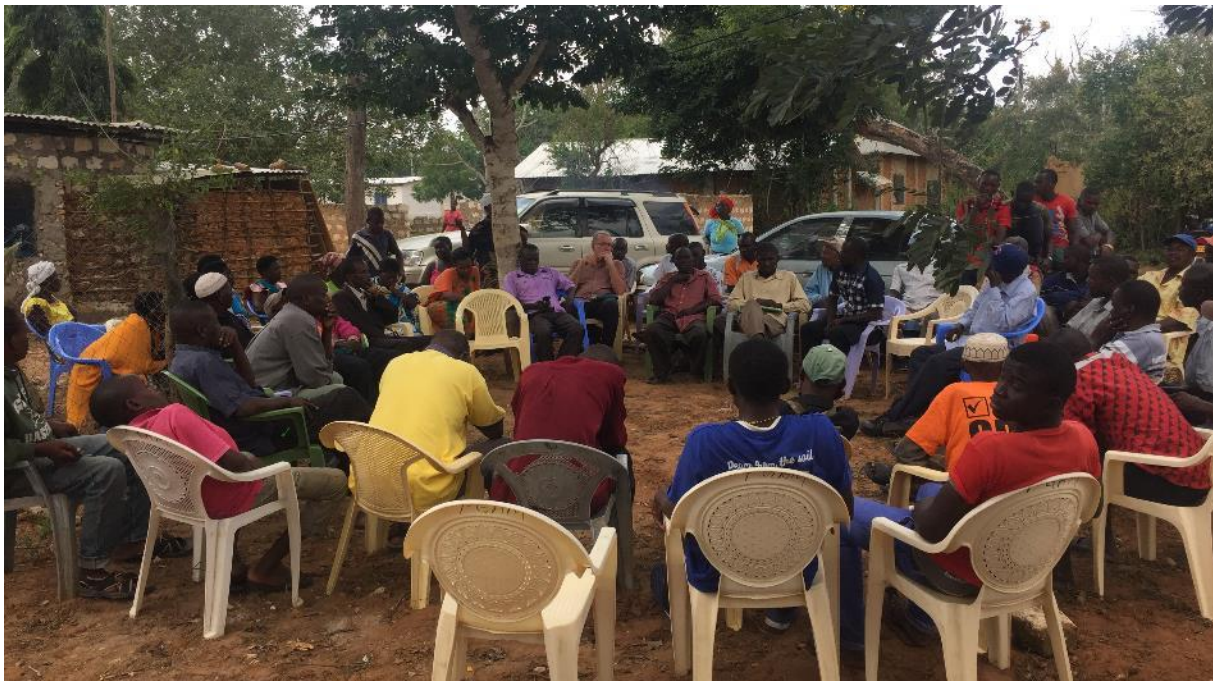
Versammlung des Kampagnenteams am Tag nach der Wahl im August 2017

Beim Hinterfragen, wie es zu so starken Abweichungen hatte kommen können, kamen erste Zweifel an der Integrität der eigenen Gruppenmitglieder auf und die Vermutung, dass viele derjenigen, die sich eigentlich als Unterstützer von EKB's Kampagne positioniert hatten, in letzter Minute konträre Wahlempfehlungen in ihrem Dorf ausgesprochen hatten. Mit der Suche nach Ursachen wuchs das Misstrauen untereinander und Vorwürfe gegen anwesende Einzelpersonen und Dorfvorsitzende und insbesondere gegen „die Frauen“ standen im Raum. Anschuldigungen wurden ausgesprochen. Zerknirscht räumte eine ganze Reihe der Anwesenden ihr Abweichen ein. Sie versuchten ihr Verhalten mit ihrer finanziellen Bedürftigkeit oder mit dem Argument „ich stand neben mir, ich weiß auch nicht, warum ich das getan habe“ zu rechtfertigen.