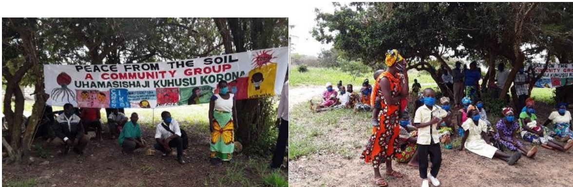
Seeds & Needs Informationsveranstaltung zu Corona im Mai 2020

Die PFTS beschrieben die Situation als eine Art Starre, in die sich das Ward hinein zu bewegen drohe und formulierten ihren inneren Impuls, als Bürgerinitiative in dieser Situation unbedingt helfen zu wollen. Gemeinsam wurde diskutiert, wie man unterstützend in dieser Situation wirken könne. Es wurde ein Projektplan entwickelt, der Informationsveranstaltungen über Corona kombiniert mit der Ausgabe von Saatgut.