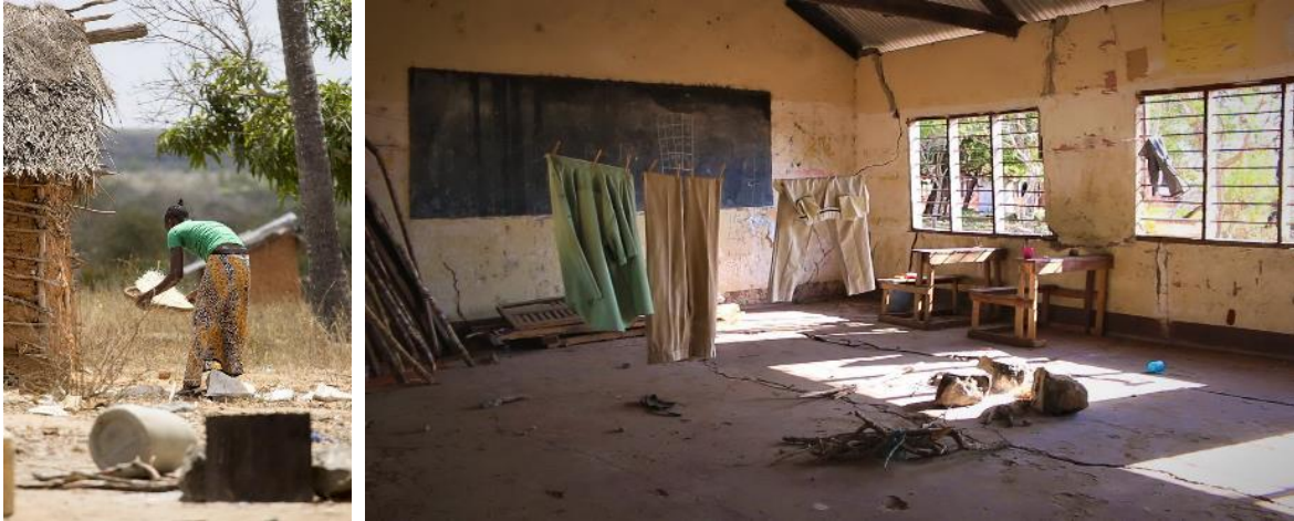
Haushaltstätigkeiten und Schulgebäude

In Marafa Ward wird berichtet, dass es dabei auch immer wieder zu Konflikten zwischen der mittleren Generation und den Alten kommen, wenn es um die Übergabe der Landrechte an die nächste Generation und die Verteilung unter den Erben geht. Ältere Menschen laufen Gefahr, der Hexerei beschuldigt zu werden und aus diesem Grund ermordet zu werden, während im Hintergrund ein Generationen- und Verteilungskonflikt schwelt.