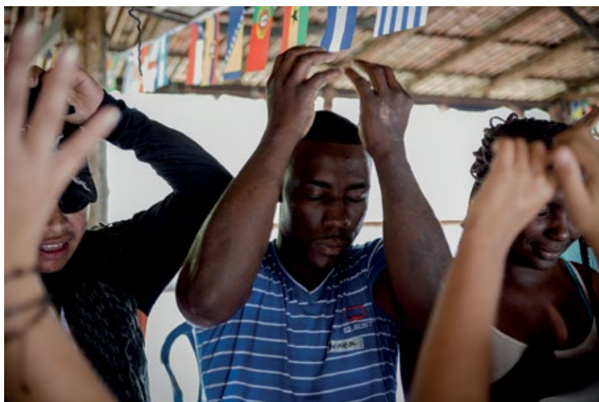
PARTICIPANTES DEL TALLER EN SANTANDER DE QUILICHAO, CAUCA. ACTIVIDAD DE RESPIRACIÓN Y VISUALIZACIÓN DEL ÁRBOL. SEPTIEMBRE DE 2015.