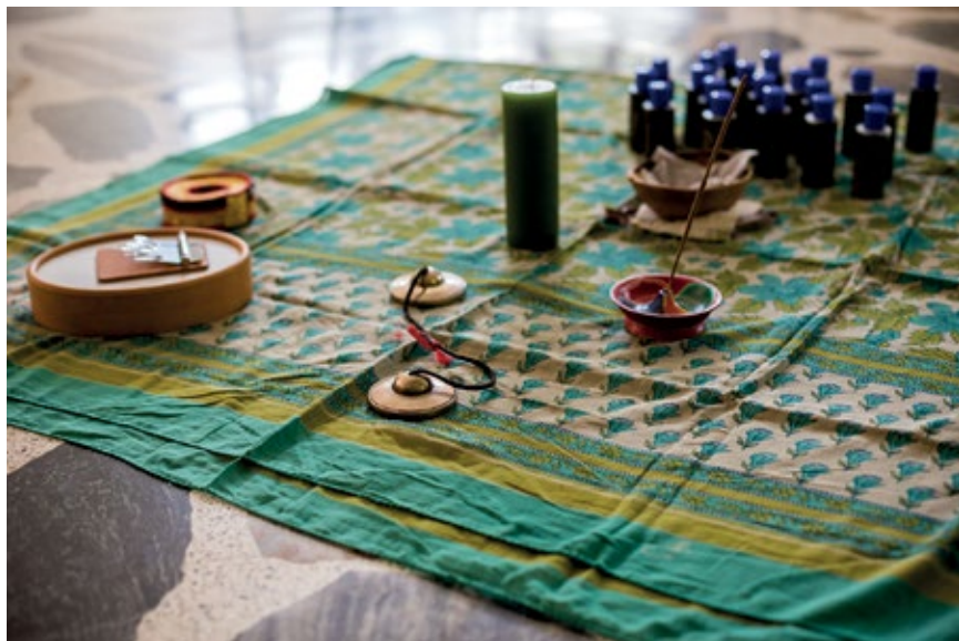
TALLER EN COCORNÁ, ANTIOQUIA. JULIO DE 2015. ALISTAMIENTO DEL ESPACIO: TELA CON VELA ENCENDIDA, ESENCIAS HERBALES, INSTRUMENTOS Y OBJETOS DE VALOR SIMBÓLICO QUE SE CONSIDEREN PROPICIOS.

Se recibe a quienes van a participar con música mientras van llegando y se les ayuda a ubicarse en un lugar. Los detalles son importantes: por ejemplo, quitar elementos innecesarios y que distraen.