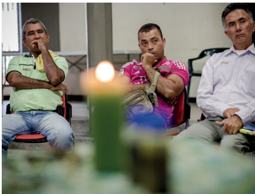
HOMBRES PARTICIPANTES DEL TALLER EN PUERTO ASÍS, PUTUMAYO. ACTIVIDAD DE DIÁLOGO GRUPAL. SEPTIEMBRE DE 2015.

Un ejemplo para comprender esto último fue recordar (o aludir) a la respiración como un mecanismo que nos acompaña toda la vida -el aire que entra y el aire que sale-; mientras estemos respirando el cuerpo seguirá su proceso de regeneración celular, es decir, de cambio y de impulso.