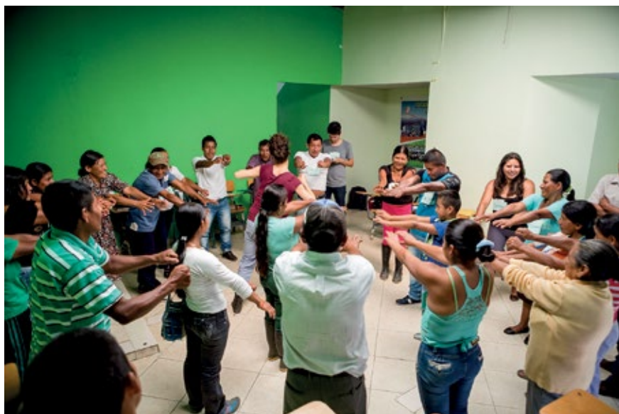
PARTICIPANTES DEL TALLER EN RICAURTE, NARIÑO. ACTIVIDAD PARA ESTIRAR Y MOVILIZAR PARTES DEL CUERPO. AGOSTO DE 2015.

Para el informe “La guerra escondida. Minas Antipersonal y Remanentes Explosivos en Colombia”, dado su alcance nacional, se debía abarcar un número de regiones significativo y por tanto los talleres no podían prolongarse a varios encuentros. Lo anterior dificultaba procesos de transformación individual.