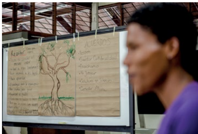
HOMBRE DEL TALLER EN PUERTO ASÍS, PUTUMAYO. ATRÁS LAS REFLEXIONES QUE SE ANOTARON SOBRE LO QUE LAS PERSONAS PARTICIPANTES REFLEXIONARON EN TORNO A LAS PREGUNTAS ¿PARA QUÉ RECORDAR? ¿PARA QUÉ OLVIDAR? SEPTIEMBRE DE 2015.

Escribimos en la cartulina las ideas principales de tal manera que sea visible para todos. Se lee en alto lo que se escribe para las personas invidentes o para quienes no saben leer.