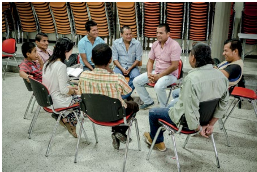
PARTICIPANTES DEL TALLER EN PUERTO ASÍS, PUTUMAYO. GRUPO EN DONDE CADA QUIEN HABLA DE LOS MOMENTOS IMPORTANTES DE SU BIOGRAFÍA. SEPTIEMBRE DE 2015.

Se recomienda empezar preguntándoles por las memorias de infancia o adolescencia y se busca rescatar los rasgos particulares de cada historia, pero también los aspectos que se comparten y se entrecruzan, como las ramas del árbol. Adicionalmente se les pregunta acerca de sus saberes y actos de resistencia, sobre las posibles acciones organizativas y estrategias que han usado para salir adelante.