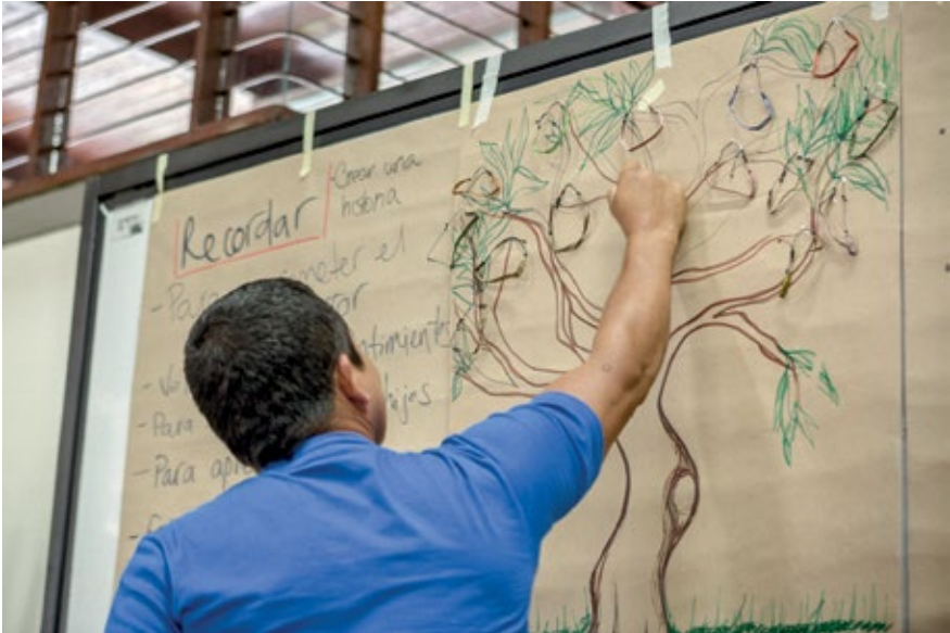
HOMBRE PARTICIPANTE DEL TALLER EN PUERTO ASÍS, PUTUMAYO. ACTIVIDAD EN DONDE EL PARTICIPANTE ELIJE UNA MANILLA PARA REGALÁRSELA A OTRA PERSONA PARTICIPANTE. SEPTIEMBRE DE 2016.

que también se promuevan narraciones y representaciones que vayan más allá de los hechos victimizantes, como por ejemplo, las pruebas de la comida propia de la región, actividades culturales o de entretenimiento como irse a bañar al río o también animales con los que se pueda encontrar en el recorrido por el territorio.