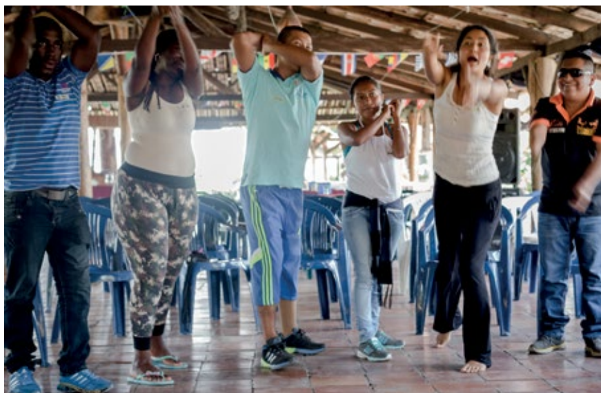
TALLER EN SANTANDER DE QUILICHAO, CAUCA. ACTIVIDAD DONDE LAS PERSONAS PARTICIPANTES REPRESENTAN ACCIONES QUE SE HACEN EN EL CAMPO, EN ESTE CASO, PESCAR. SEPTIEMBRE DE 2015.