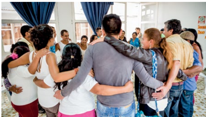
PARTICIPANTES DEL TALLER EN SAMANIEGO, NARIÑO. ACTIVIDAD DE CIERRE EN EL QUE TIENE LUGAR UN ABRAZO COLECTIVO. OCTUBRE DE 2015.