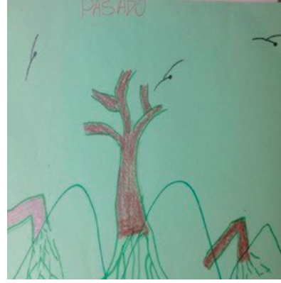
DIBUJOS REALIZADOS POR MUJER DEL TALLER EN COCORNÁ, ANTIOQUIA. JULIO DE 2015.

La invitación al movimiento es una manera de integrar a las personas participantes y posibilitarles que se conecten consigo mismas y con los demás. Los espacios en que todas las personas pueden moverse de acuerdo a su sentir y voluntad representan una oportunidad para participar, estar presente y comunicar. Para quienes no hablan mucho o les cuesta expresarse verbalmente, los espacios de movimiento son inclusivos y en varios casos divertidos. En efecto, consideramos que fue un gran acierto metodológico introducir elementos lúdicos y hasta con un pequeño reto de movilidad. Por ejemplo, se les invitó a hacer una coreografía corta que se fue construyendo con movimientos creados por ellos. Este elemento ayudó a que los cuerpos se soltaran, relajaran y además fue una manera diferente de compartir en colectividad.