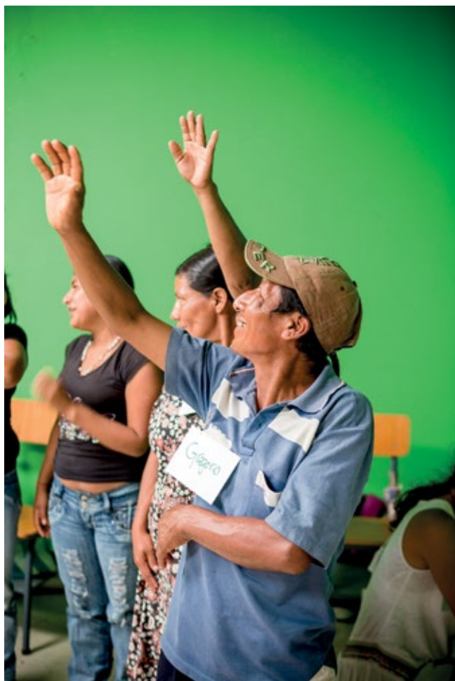
PARTICIPANTES DEL TALLER EN RICAURTE, NARIÑO. ACTIVIDAD PARA ESTIRAR Y MOVILIZAR PARTES DEL CUERPO. AGOSTO DE 2015.