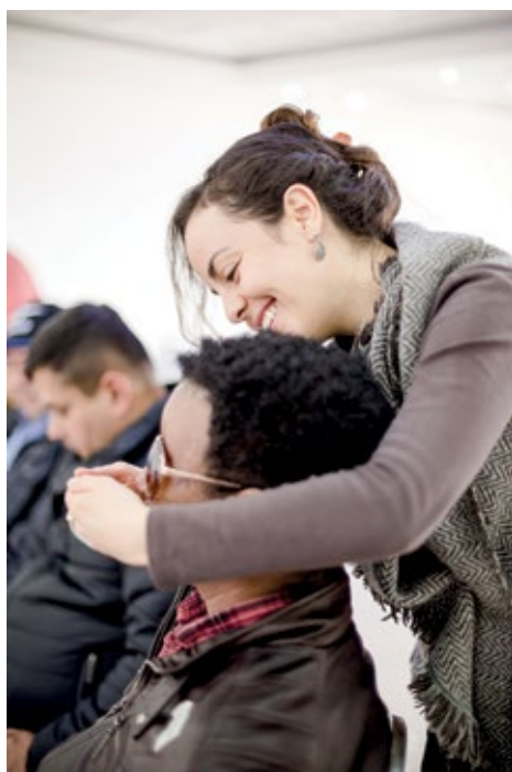
HOMBRE PARTICIPANTE DEL TALLER PARA POLICÍAS EN BOGOTÁ. EN ALGUNOS TALLERES LAS FACILITADORAS AYUDAN A PERSONAS PARTICIPANTES A OLER LA ESENCIA CUANDO HAY ALGUNA DISCAPACIDAD CON SUS MIEMBROS SUPERIORES QUE NO SE LO PERMITA. ABRIL DE 2016.