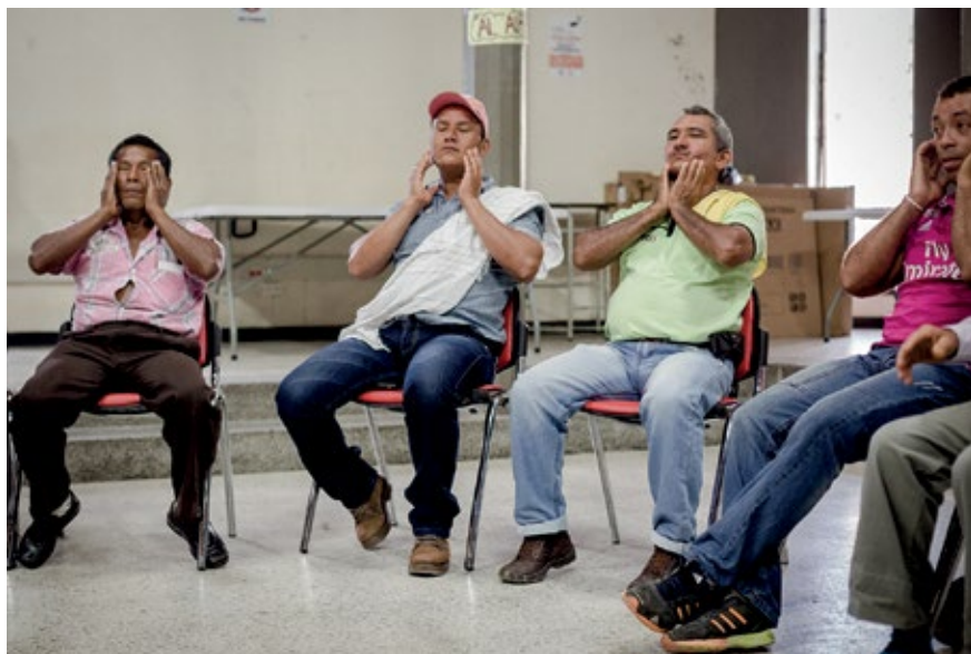
PARTICIPANTES DEL TALLER EN PUERTO ASÍS, PUTUMAYO. ACTIVIDAD DONDE CADA PERSONA PARTICIPANTE REALIZA UN AUTOMASAJE PARA DESPERTAR Y DISTENSIONAR LOS MÚSCULOS. SEPTIEMBRE DE 2015.