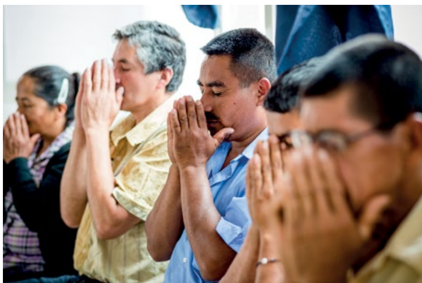
PARTICIPANTES DEL TALLER EN SAMANIEGO, NARIÑO. EJERCICIO PARA ACTIVAR LA RESPIRACIÓN POR MEDIO DE UNA ESENCIA HERBAL. OCTUBRE DE 2015.