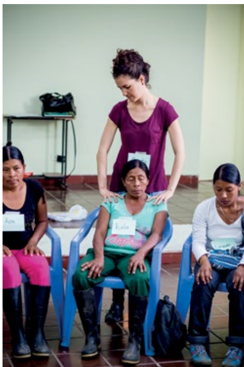
PARTICIPANTES DEL TALLER EN RICAURTE, NARIÑO. AGOSTO DE 2015. ACTIVIDAD DE RESPIRACIÓN EN DONDE QUIEN FACILITA PONE SUS MANOS EN LOS HOMBROS DE UNA PARTICIPANTE.