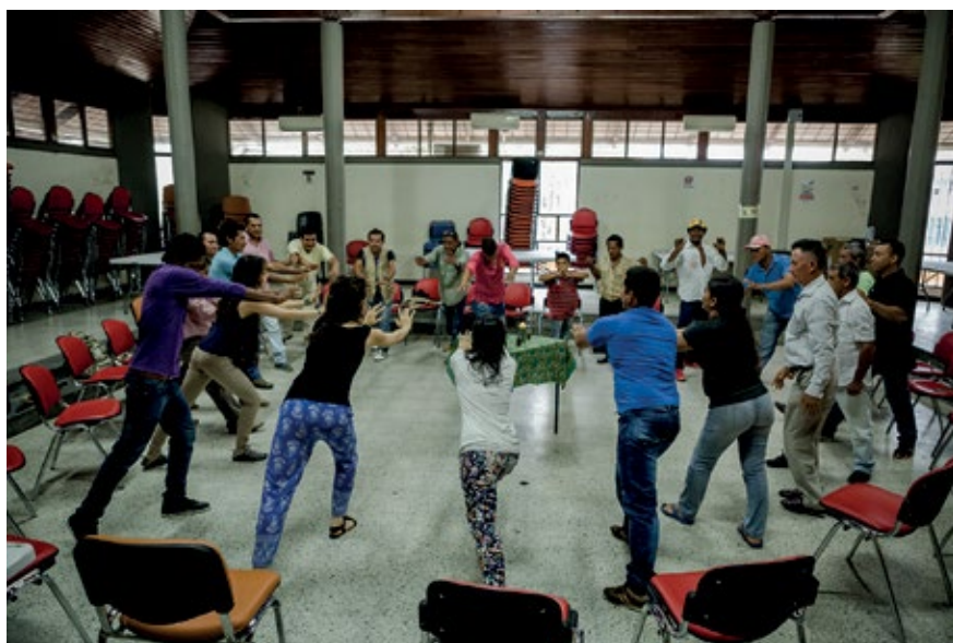
PARTICIPANTES DEL TALLER EN PUERTO ASÍS, PUTUMAYO. ACTIVIDAD DONDE LAS PERSONAS PARTICIPANTES REPRESENTAN ACCIONES QUE SE HACEN EN EL CAMPO. SEPTIEMBRE DE 2015.

Una segunda ronda puede hacerse con una música movida y divertida. En la misma dinámica grupal, se invita a que den ideas y representen movimientos y acciones que se hacen en el campo (o relacionados con los oficios típicos de la región), por ejemplo: cortar leña, arar la tierra, palear, pescar, cazar, cocinar, etc.