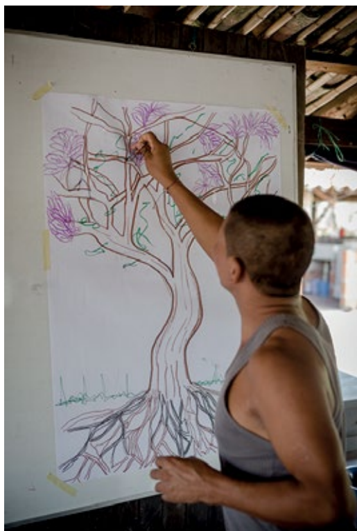
PARTICIPANTE DEL TALLER EN SANTANDER DE QUILICHAO, CAUCA. EL PARTICIPANTE ESTÁ TOMANDO UNA DE LAS MANILLAS QUE SE ENTREGAN COMO CIERRE SIMBÓLICO EN EL SEGUNDO DÍA DE TALLER (VER EXPLICACIÓN MÁS ADELANTE). SEPTIEMBRE DE 2015.

te poder enunciar e identificar las formas particulares como el territorio se ve afectado.