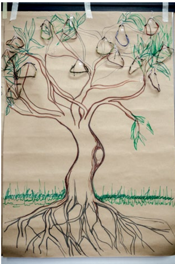
DIBUJO REALIZADO POR EL EQUIPO PARA EL TALLER EN COCORNÁ, ANTIOQUIA. JULIO DE 2015.

una de esas partes se va delineando en la medida en que se pasa por el nivel correspondiente.