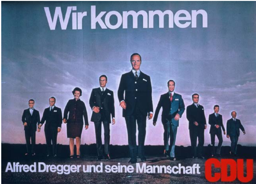
„Django-Plakat“, ACDP Plakatarchiv 10-007-301.

die Idee der Darstellung der Führungsmannschaft also aufgegeben, der Spitzenkandidat immer klarer herausgestellt wurde. 263