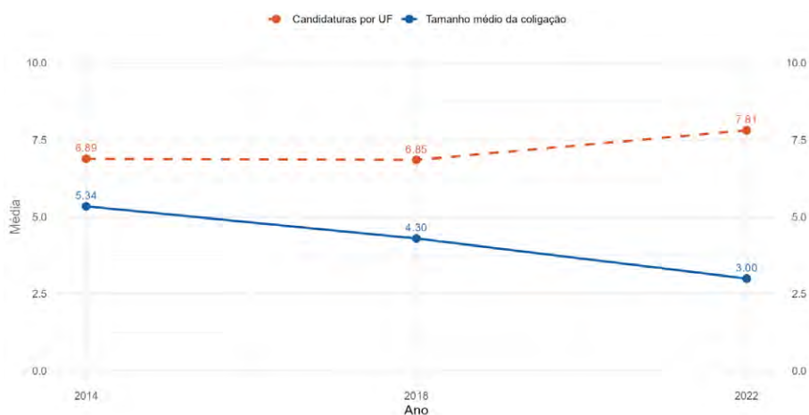
GRÁFICO 1. Tamanho médio das coligações majoritárias e número de candidatos a governador. Eleições estaduais – 2014, 2018 e 2022