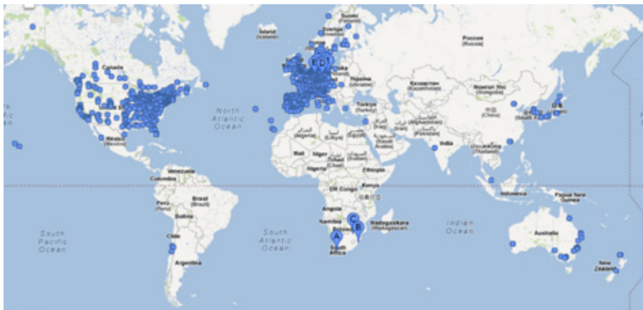
Distribuição mundial das universidades com bolsistas do programa Ciência sem Fronteiras, dados de setembro de 2012

Transpondo para o setor da educação, isso significa que o Brasil quer que os líderes de suas universidades sejam participantes com direitos iguais nas redes internacionais. É interessante para a Alemanha e seus parceiros europeus observar a direção que tomam o interesse e a mobilidade dos jovens. O programa oferece bolsas para todas as universidades de excelência a nível internacional. Uma verdadeira legião de delegações de universidades e governos estrangeiros vem visitando Brasília. CAPES e CNPq assinaram inúmeros acordos e ganharam também novos parceiros.