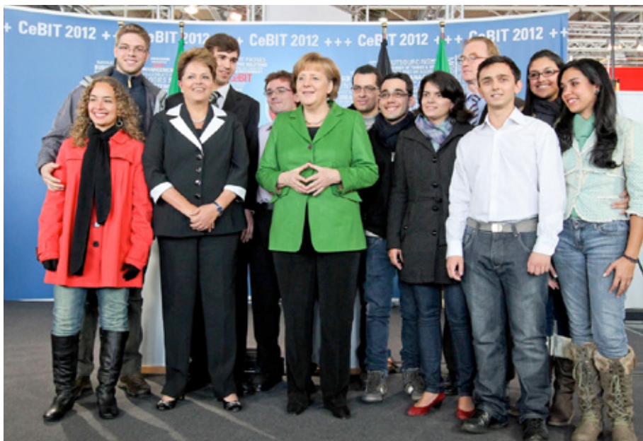
A Presidente Dilma Rousseff e a Chanceler da Alemanha Angela Merkel em encontro com o primeiro grupo de bolsistas do programa Ciência sem Fronteiras na Feira CeBit, em Hannover, em abril de 2012